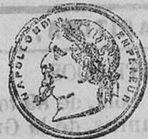
GRAN MEDALLA DE HONOR.