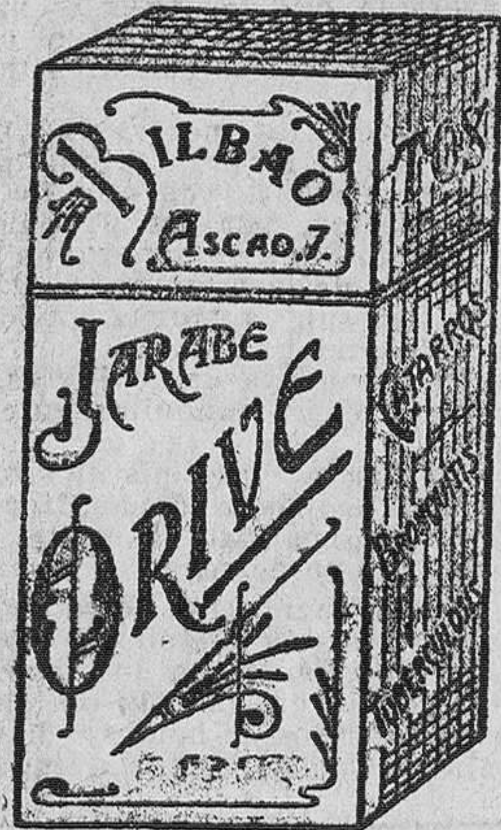
El MEJOR remedio para EL PEOR catarro Jarabe Orive.

Rebajas a familias, sacerdotes, compañías de teatro y en billetes de ida y vuelta. Estos magníficos vapores, de gran porte y comodidades, para mayor atracción del pasaje hispano americano, han sido dotados, para los servicios de primera, segunda y tercera clases, de camareros y cocineros españoles, que servirán la comida al estilo español. Llevan también médico español. Los pasajeros de tercera clase van alojados en camarotes de dos, cuatro y seis personas, con cuartos de baño, amplios comedores y espaciosas cubiertas de paseo. Para toda clase de informes dirigirse a sus Agentes en Santander, HIJOS DE BASTERRECHEA , paseo de Pereda, 9. Teléfono número 41.