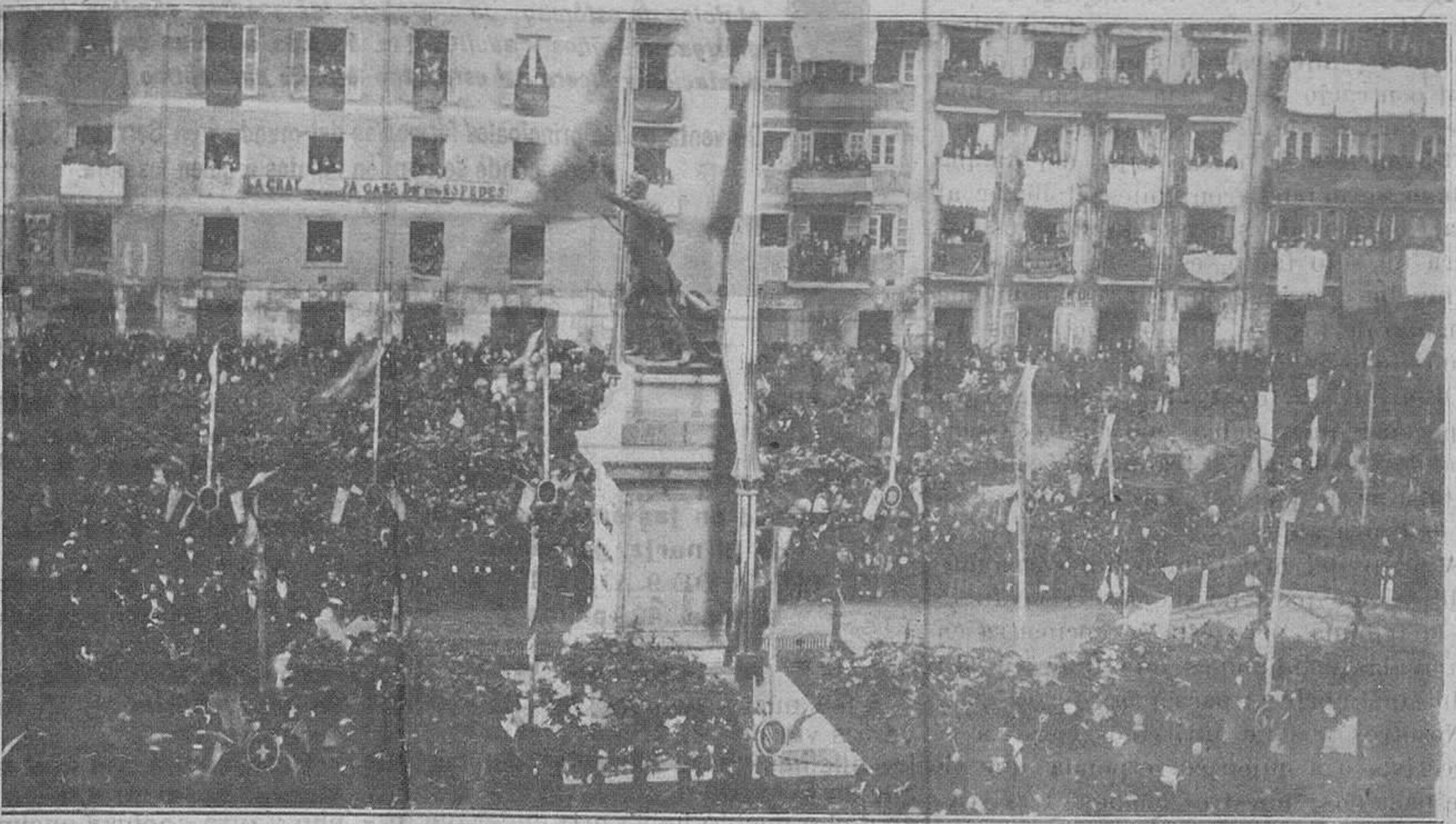
Inauguración de la estatua de don Pedro Velarde el 2 de mayo de 1880. Todo el pueblo está congregado junto al héroe.