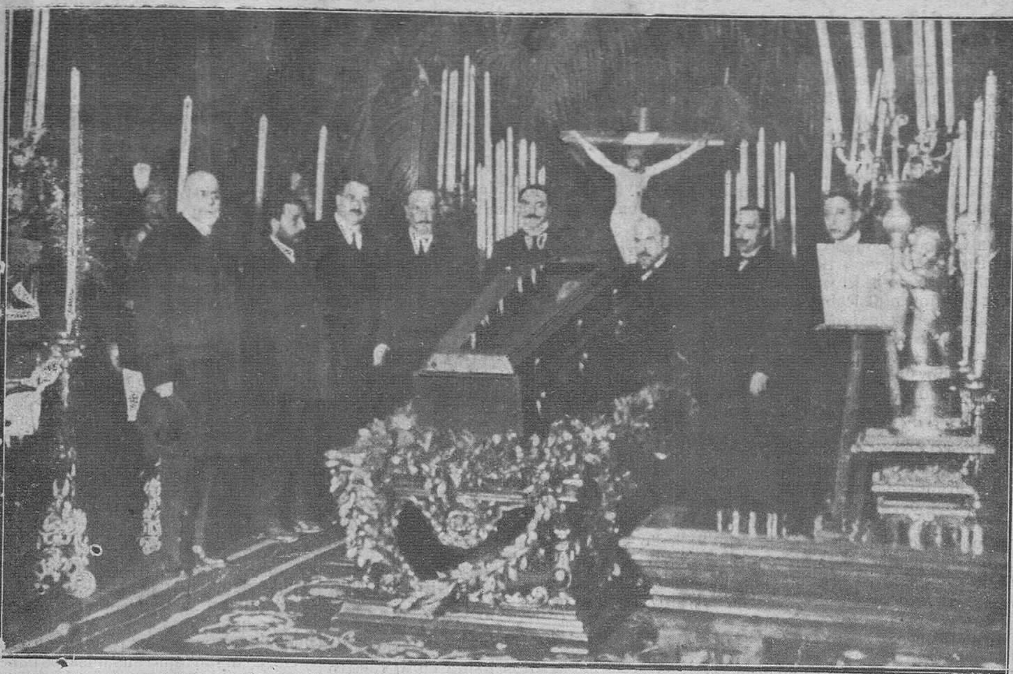
EL FALLECIMIENTO DE Galdós. La capilla ardiente instalada en el patio de cristales del Ayuntamiento durante la visita del ministro de la Gobernación