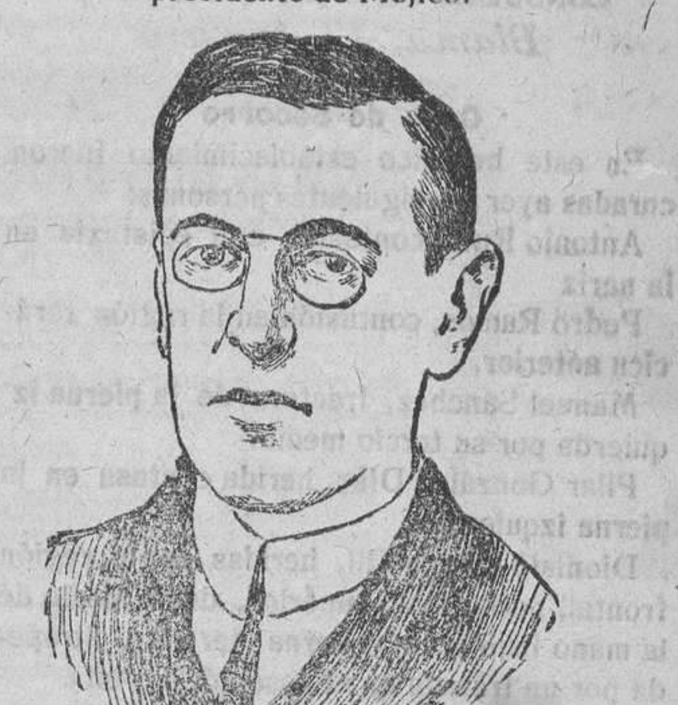
Mister Wilson presidente de los Estados Unidos