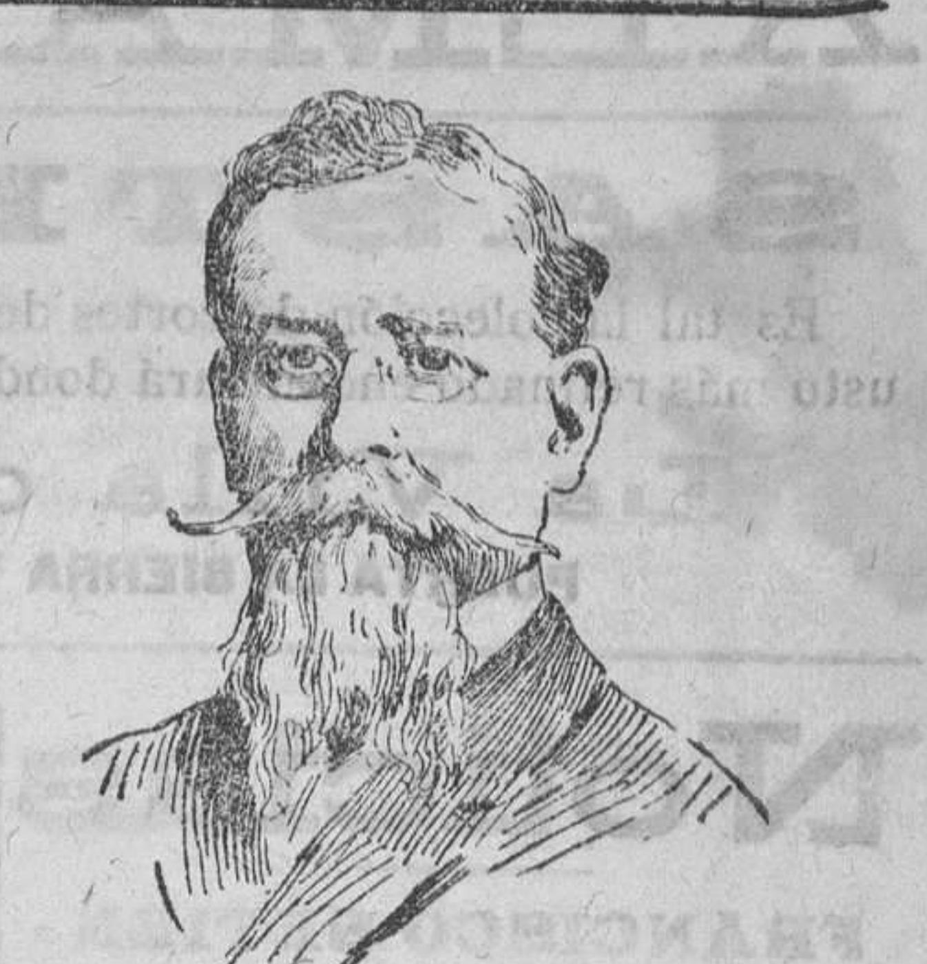
El general Carranza presidente de Méjico.