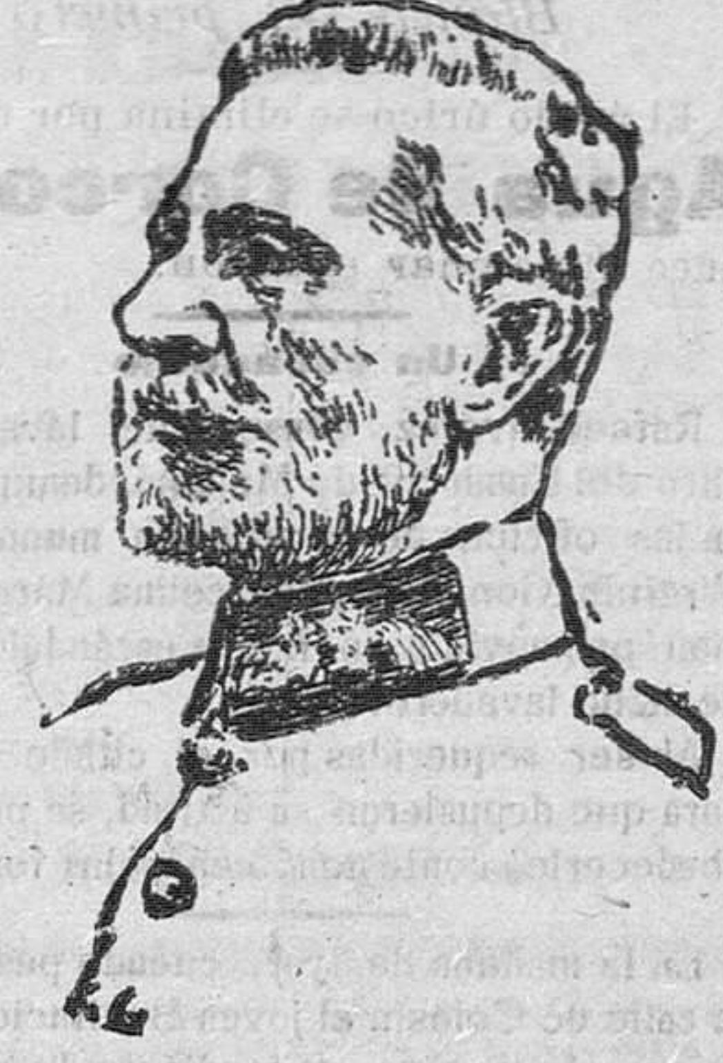
El general Gallwitz, que manda uno de los ejércitos alemanes que han invadido Serbia al mando del mariscal Mackensen.