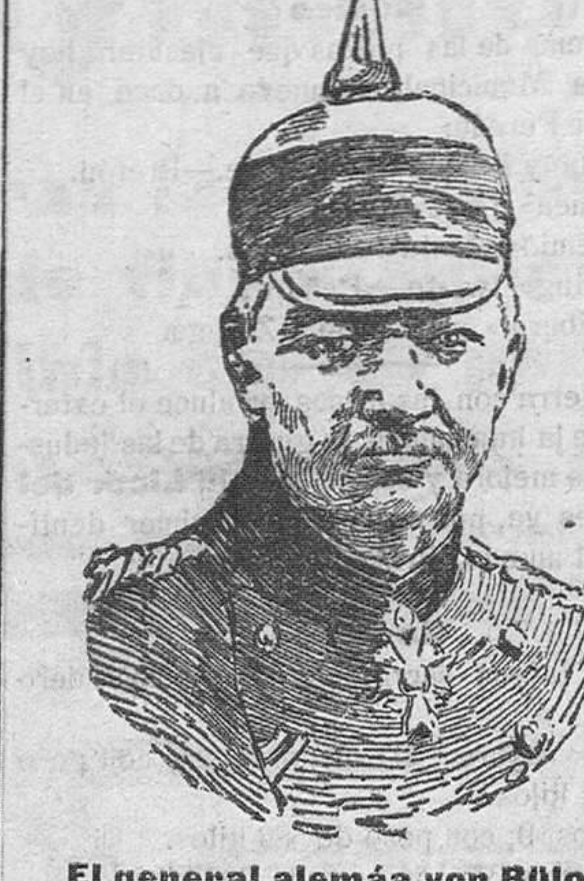
El general alemán von Bülow, que manda uno de los Cuerpos de ejército que han arrojado a los rusos de los Cárpatos.