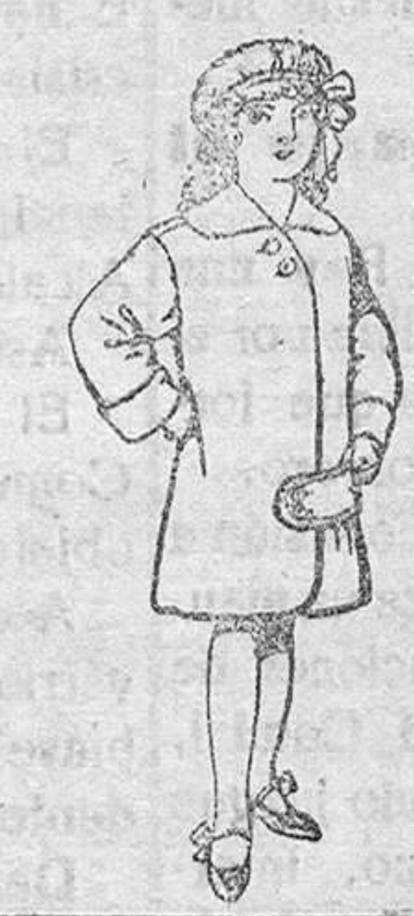
Abrigos de paten para niños de 4 a 9 años De Pts. 20 a 28

SECCIONES: Peletería, Camisería, Géneros de Punto, Corbatería, Guantería, Sombrerería, Zapatería, Paraguas, Bastones y Artículos de Viaje.