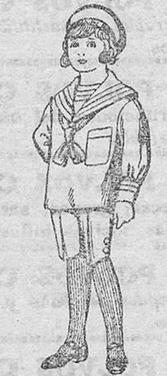
Trajes de jerga azul bordada para niños de 4 a 9 años De Pts. 20 a 22

SECCIONES: Peletería, Camisería, Géneros de Punto, Corbatería, Guantería, Sombrerería, Zapatería, Paraguas, Bastones y Artículos de Viaje.