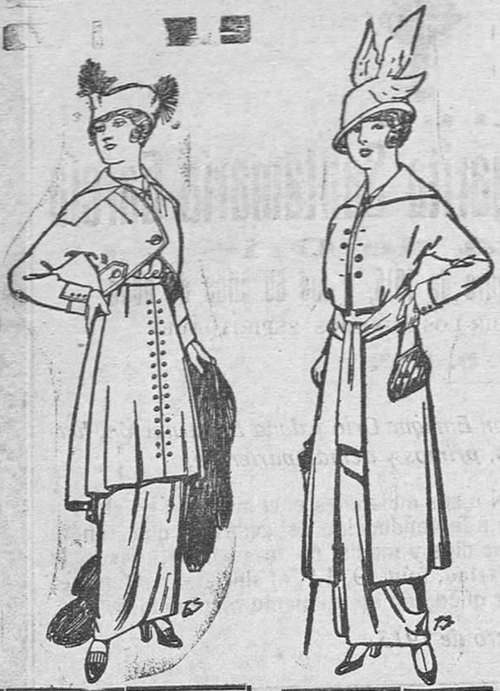
Trajes de jerga negra y azul Plas. . . 55