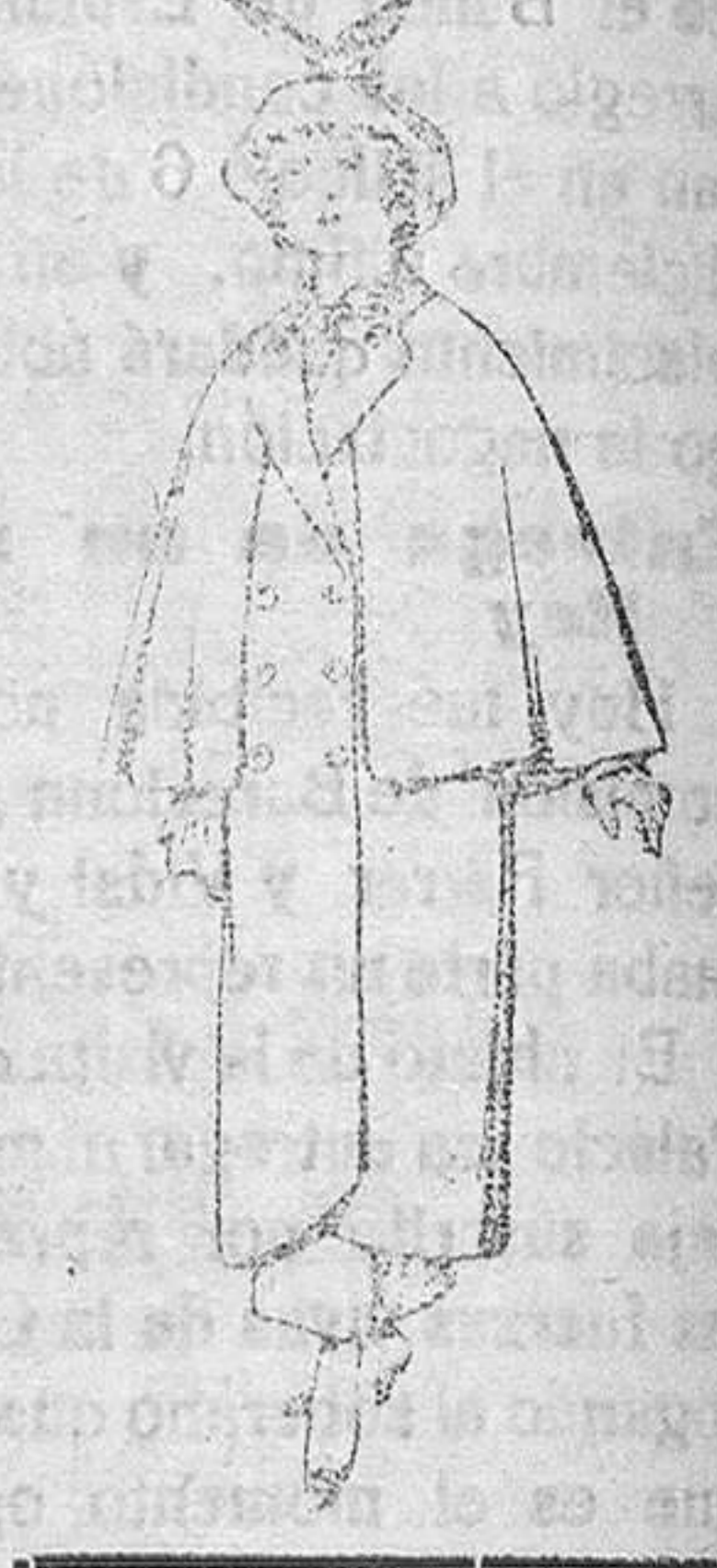
Abrigos de paten colorados para jovencitas de 10 a 16 años De Pts. 35 a 40