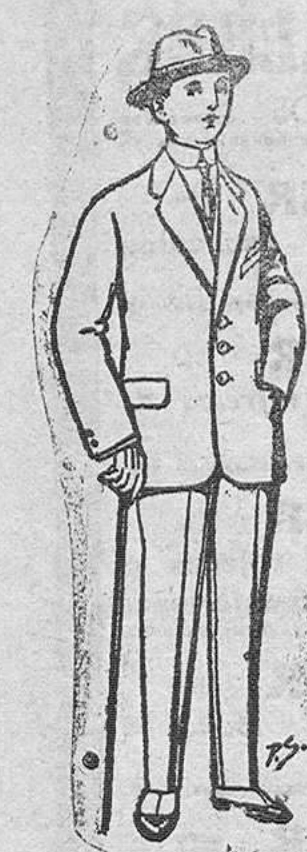
Trajes de paten vieja jerga para niños de 10 a 18 años De Pts. 13 a 48