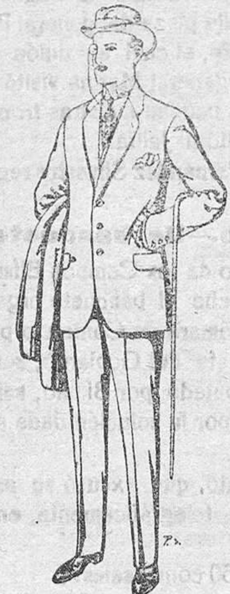
Trajes de paten cheviot, etc. De Pts. 17,50 a 70