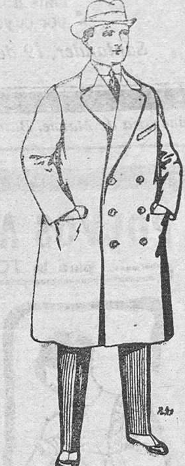
Gabanes de paten y cheviot. De Pts. 55 a 105