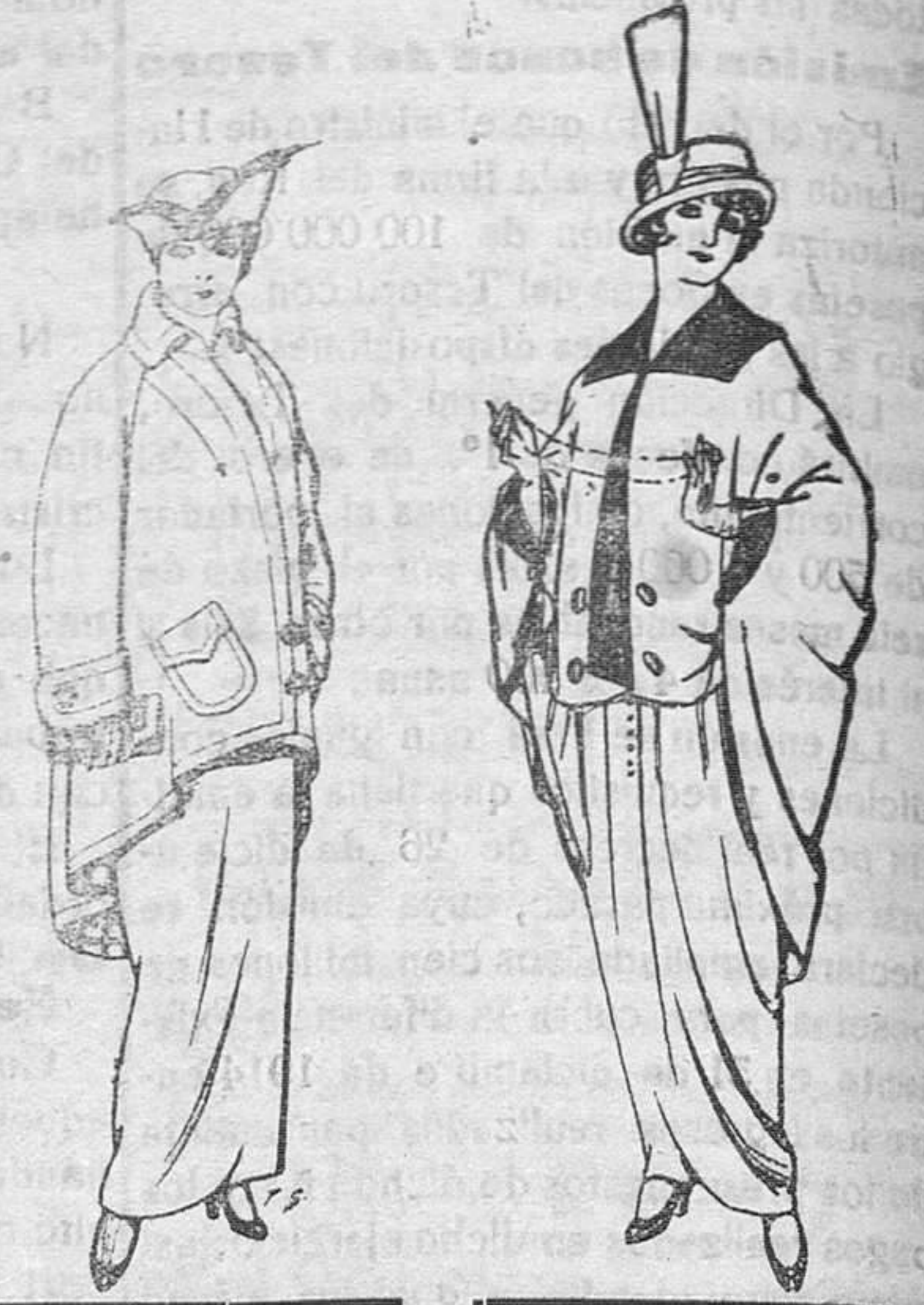
Abrigos de paten para Señora De Pts. 40 a 50