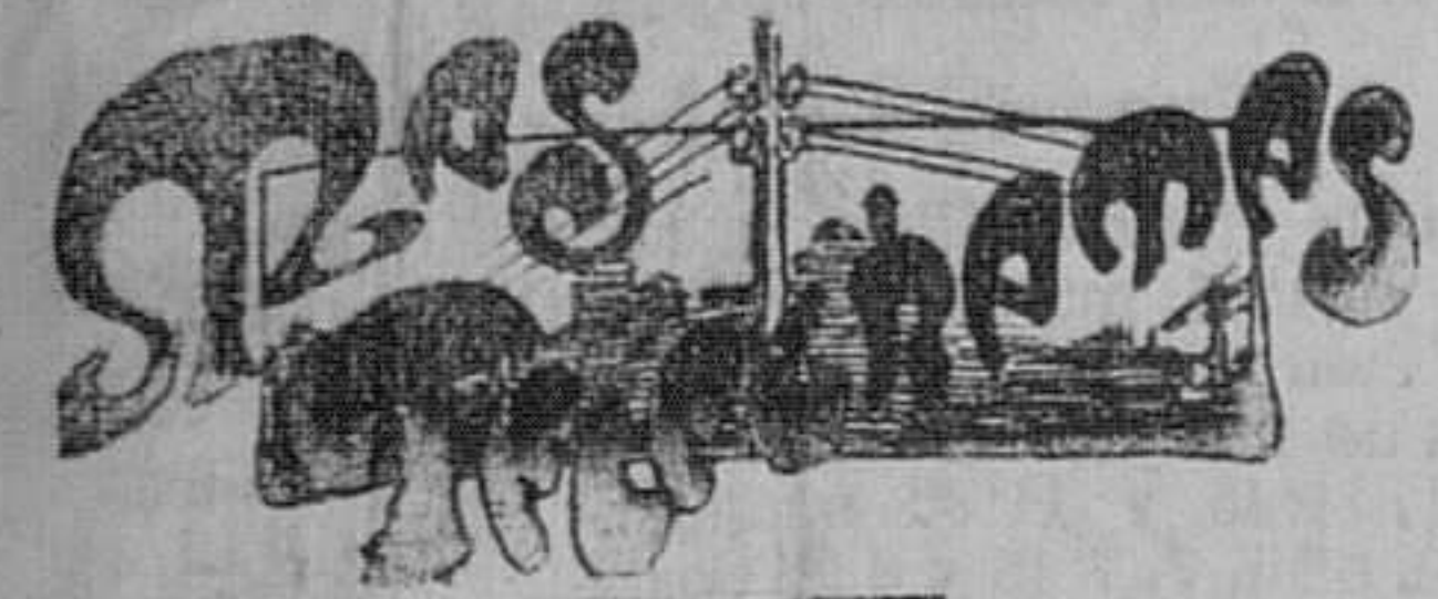
Madrid 31—(Varias horas) León XIII