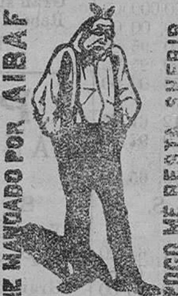
ME MUYADO POR AIBAF

(anagrama de Andrés y Fabiá, farmacéutico, premiado de Valencia, por ser el remedio más poderoso é inocente que se conoce hoy para producir ese cambio tan rápido y positivo. D struye también la fealdad que la carie comunica al aliento. De venta en todas las buenas farmacias de esta provincia. En Santander, farmacia del señor Calvo á Plaza, calle de la Blanca. DOS pesetas bote