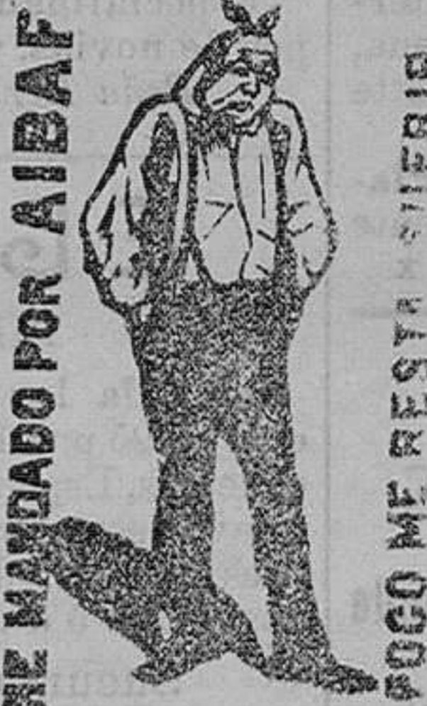
NO MANDARLO POR AIBAF POCO ME RESTA SUERTE

pone al hombre, cual le véis, desfigurado, triste, media bulto é iracundo. La causa de todos estos males se destruye en un minuto y sin riesgo alguno usando el AIBAF SERDNA (anagrama de Andrés y Fabiá, farmacéutico, premiado de Valencia, por ser el remedio más poderoso é inocente que se conoce hoy para producir ese cambio tan rápido y positivo. Destruye también la fetidez que la carie comunica al aliento. De venta en todas las buenas farmacias de esta provincia. En Santander, farmacia del señor Calvo y Plaza, calle de la Blanca. DOS pesetas bote)