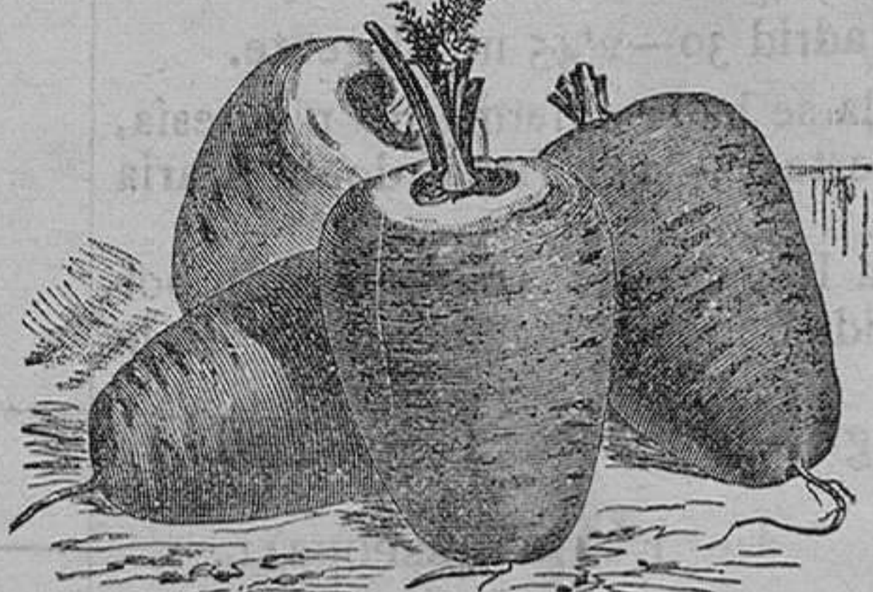
Zanahoria corta de Holanda.—Tres variedades. Onza, 75 céntimos.