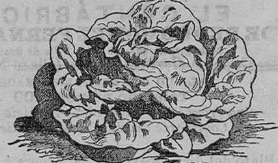
Lechugas acogolladas de Malta.—Seis variedades.—Onza, 75 céntimos.

Vende cuarenta mil vegetales de 200 variedades de árboles frutales, alta novedad.—100 variedades de árboles de sombra y maderables.—400 variedades de arbustos de adorno y floríferos.—600 variedades de cebollas y tubérculos en flor.—200 variedades de plantas en tiestos para canastillas y salones, trazados y plantaciones de parques y jardines, á precios módicos.—Hermes catálogos gratis á quien los pida.