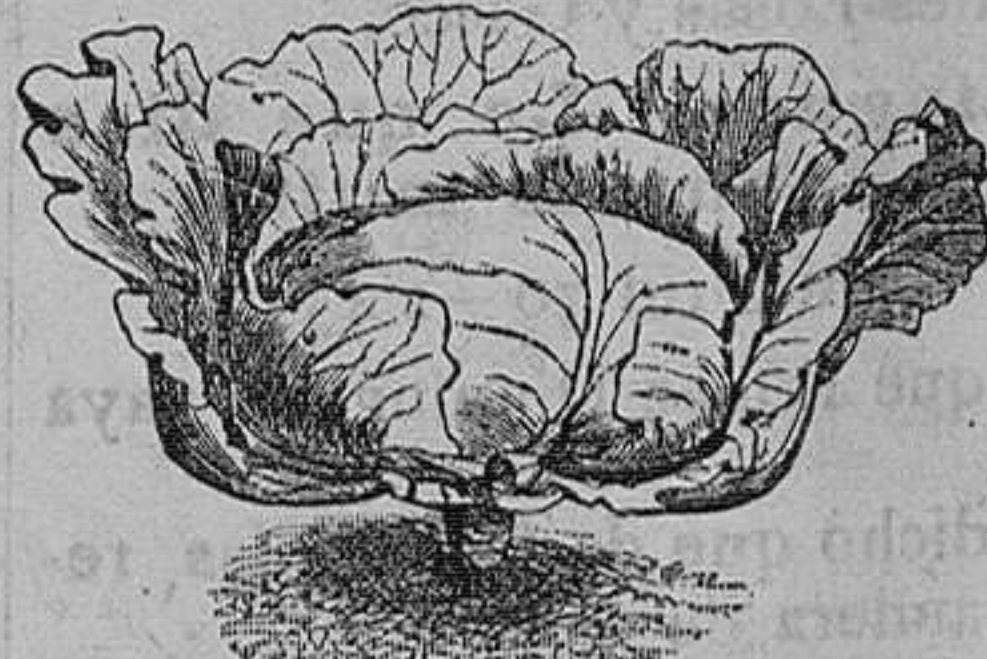
Repollas de Brunswick y de San Dionisio gruesos.—Seis variedades. Una onza, una peseta.