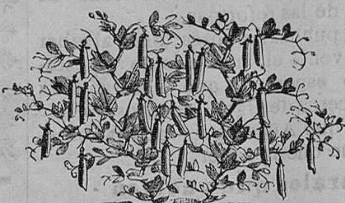
Guisantes blancos y verdes enanos. Seis variedades.—Tercia, 1'25 céntimos

Jardinero del Instituto de esta capital, calle de Magallanes, número 36, Santander. Catálogo de cebollas y tubérculos de flores, gratis á quien los pida.