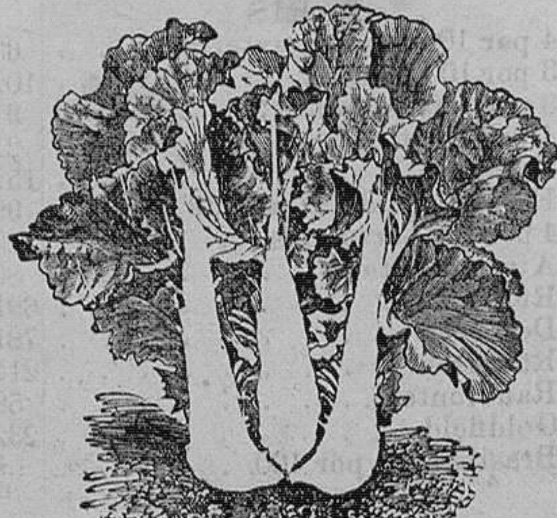
Berza asa de cántaro y rizada.—Seis variedades.—Onza, 75 céntimos.