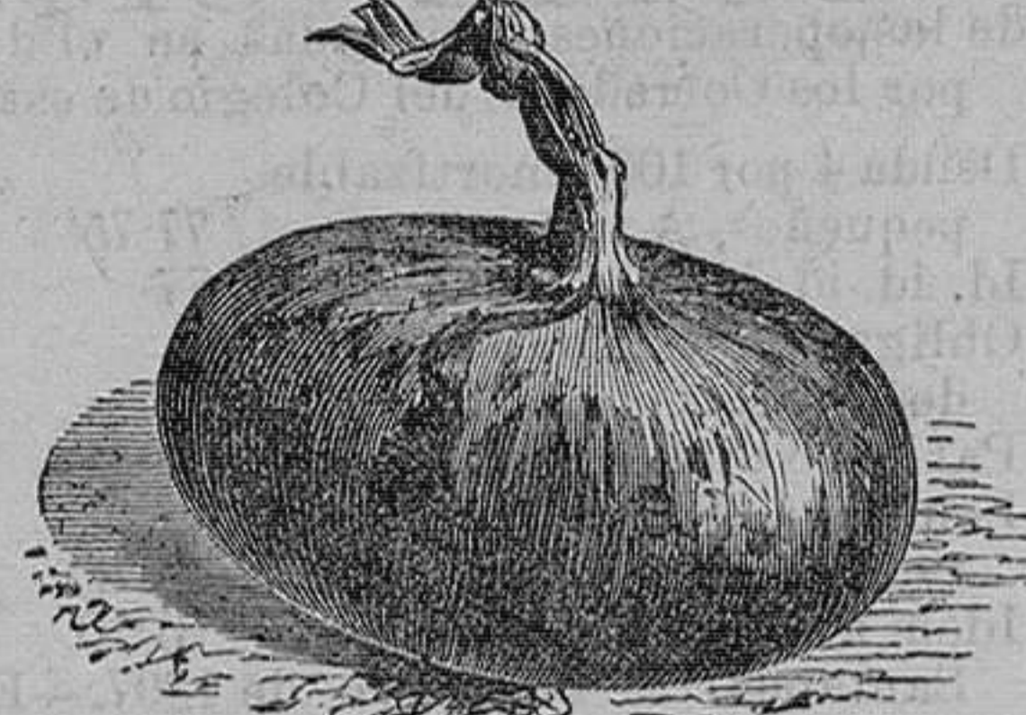
Cebolla encarnada y blanca.—Seis variedades.—Onza, 75 céntimos.