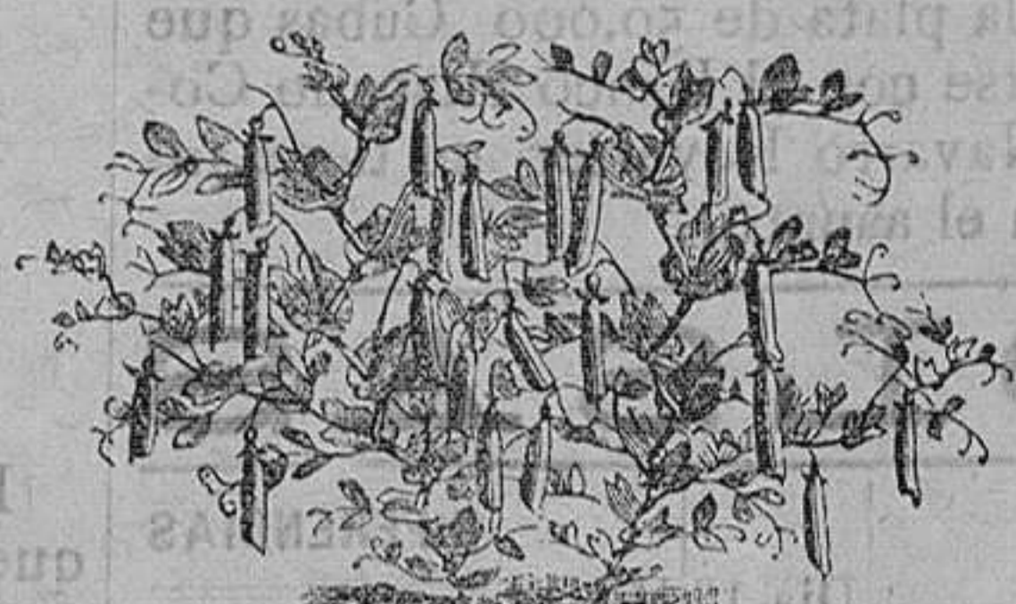
Guisantes blancos y verdes enanos. Seis variedades.—Tercia, 1'25 céntimos.