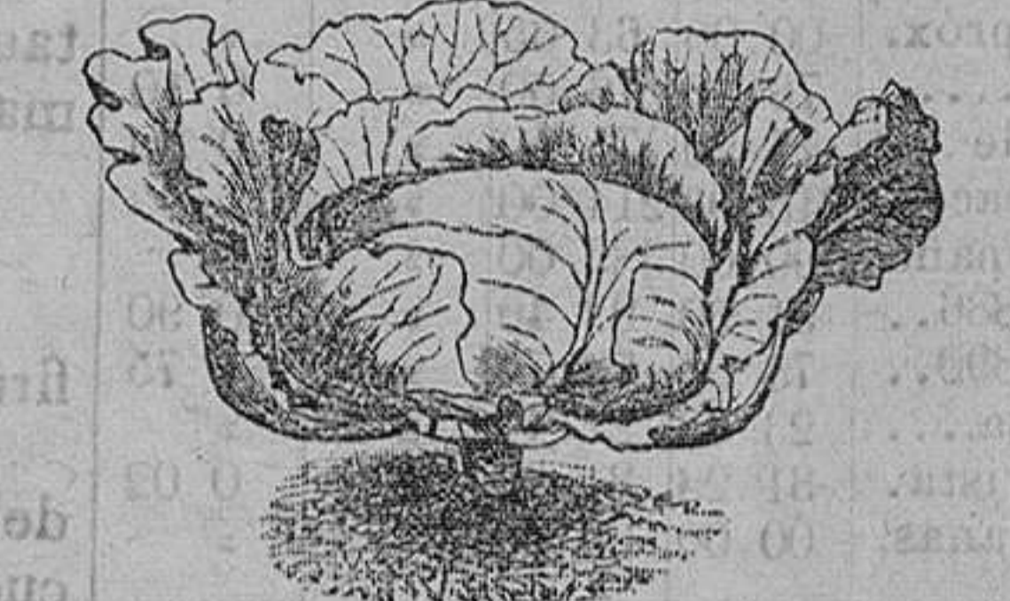
Repollas de Brunswick y de San Dionisio gruesas.—Seis variedades.—Una onza, una peseta.