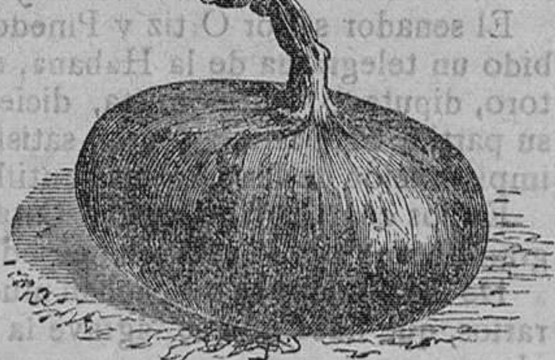
Cebolla encarnada y blanca.—Seis variedades.—Onza, 75 céntimos.