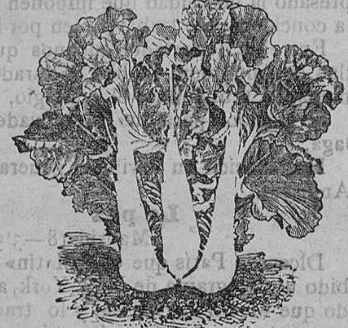
Berza asa de cántaro y rizada.—Seis variedades.—Onza, 75 céntimos.