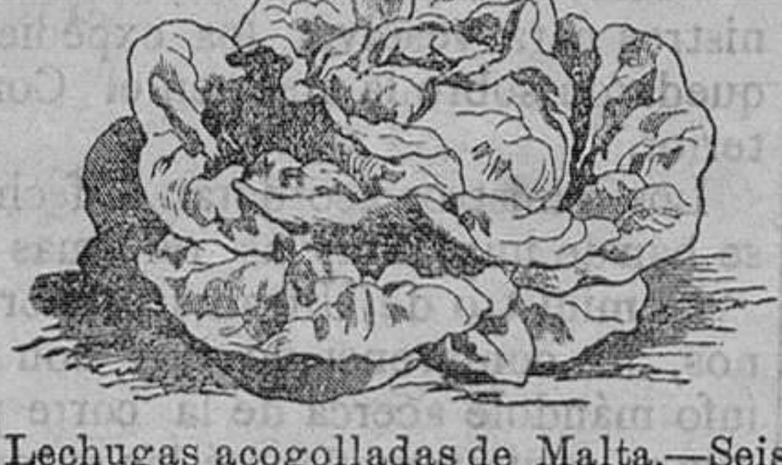
Lechugas acogolladas de Malta.—Seis variedades.—Onza, 75 céntimos.

A VISO En este establecimiento se hace toda clase de trabajo concerniente al ramo de imprenta.