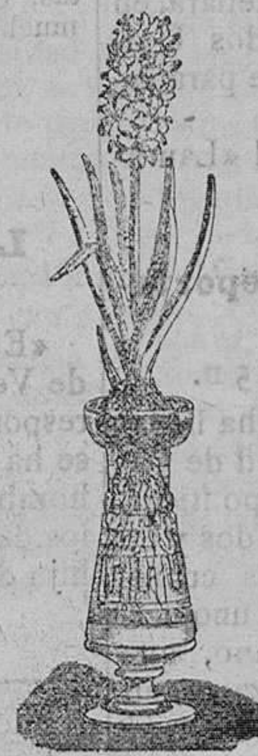
Jacintos variados dobles para agua. Pieza, 1 peseta. Idem con botella, bonito modelo, 4 pesetas pieza.