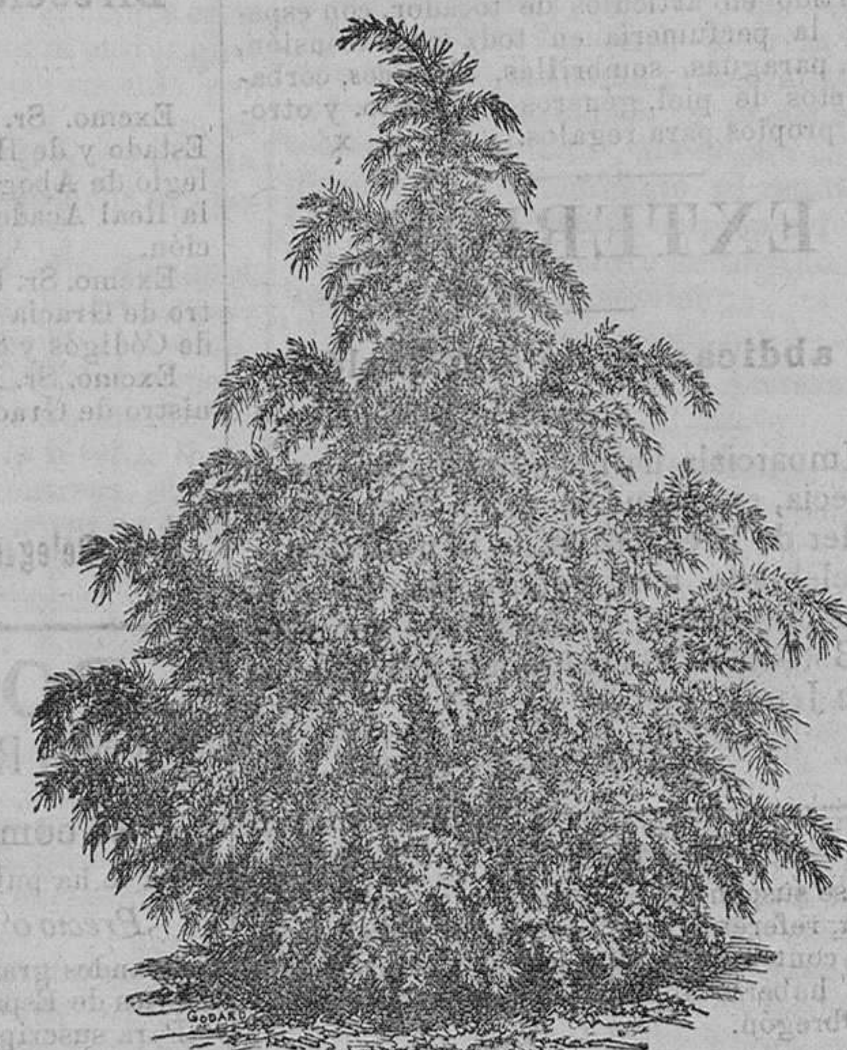
Cedro de Odra Robusta: pieza, de 1 peseta a 10 pesetas. Idem de Líbano: pieza, de 150 pesetas a 10 pesetas.

Vende cuarenta mil vegetales de 200 variedades de árboles frutales, alta novedad.—100 variedades de árboles de sombra y maderables.—400 variedades de arbustos de adorno y floríferos.—600 variedades de cebollas y tubérculos en flor.—200 variedades de plantas en tiestos para camastillas y salones, trazados y plantaciones de parques y jardines, a precios módicos.—Remite catálogos gratis a quien los pida.