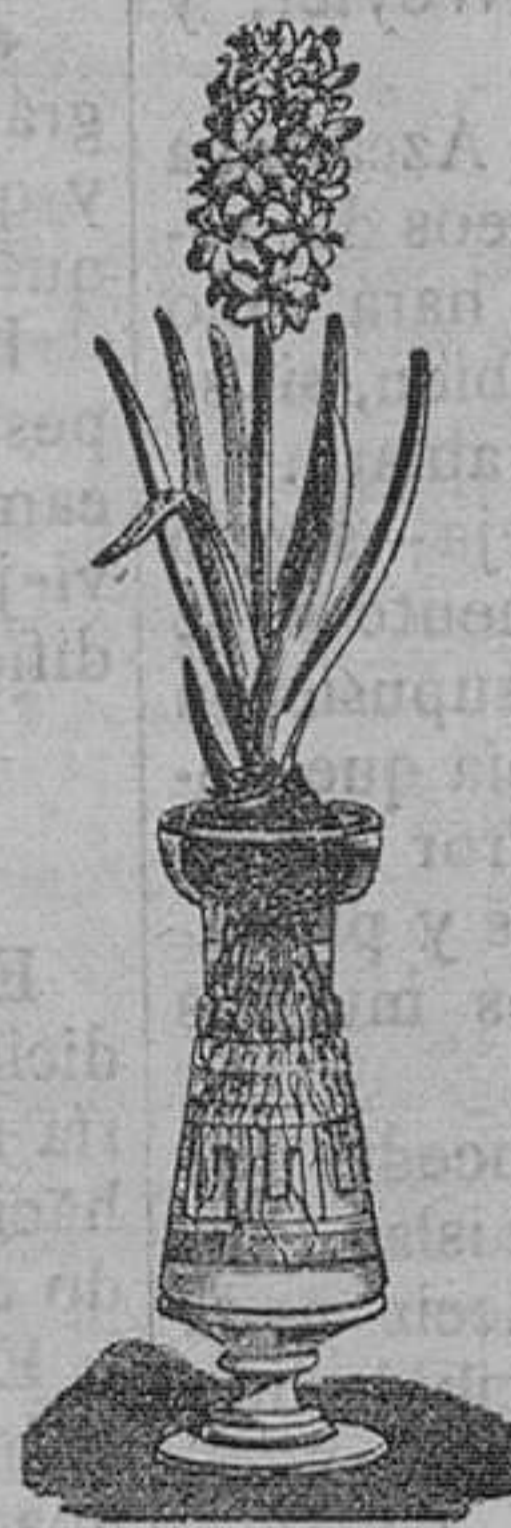
Jacintos variados dobles para agua. Pieza, 1 peseta. Idem con botella, bonito modelo, pesetas pieza.