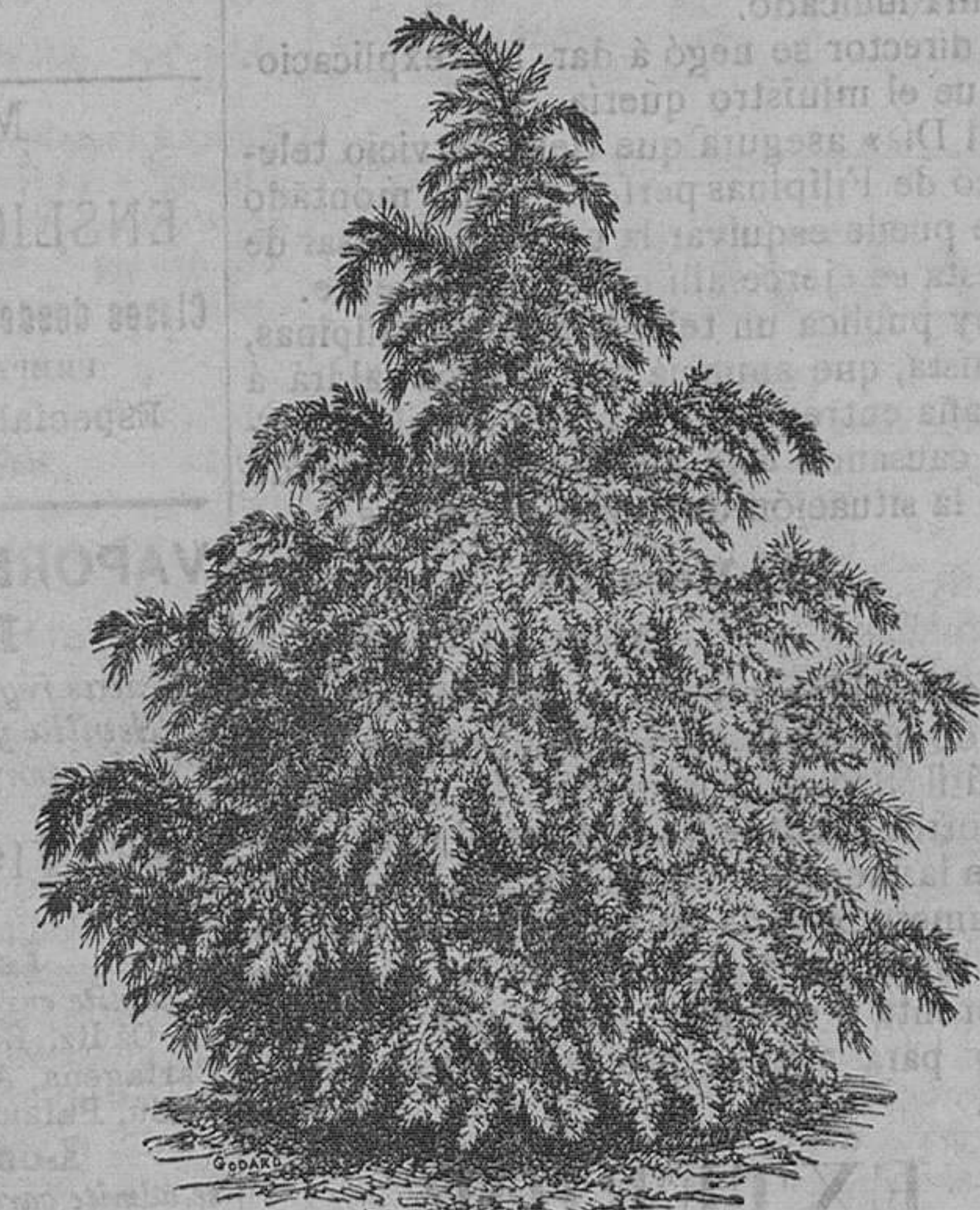
Cedro de Odora Robusta: pieza, de 1 peseta á 10 pesetas. Idem de Líbano: pieza, de 150 pesetas á 10 pesetas.

Vende cuarenta mil vegetales de 200 variedades de árboles frutales, alta novedad.—100 variedades de árboles de sombra y maderables.—400 variedades de arbustos de adorno y floríferos.—600 variedades de cebollas y tubérculos en flor.—200 variedades de plantas en tiestos para canastillas y salones, trazados y plantaciones de parques y jardines, á precios módicos.—Remite catálogos gratis á quien los pida.