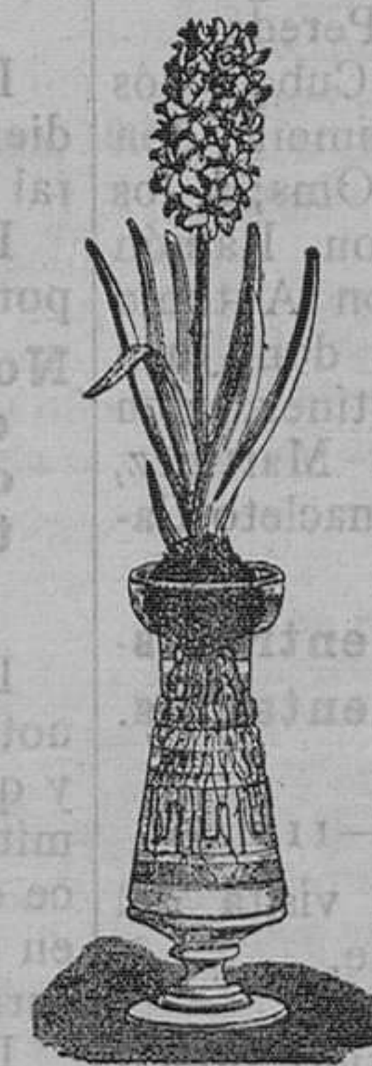
Jacintos variados dobles para agua. Pieza, 1 peseta. Idem con botella bonita modelo, 4 pesetas pieza.