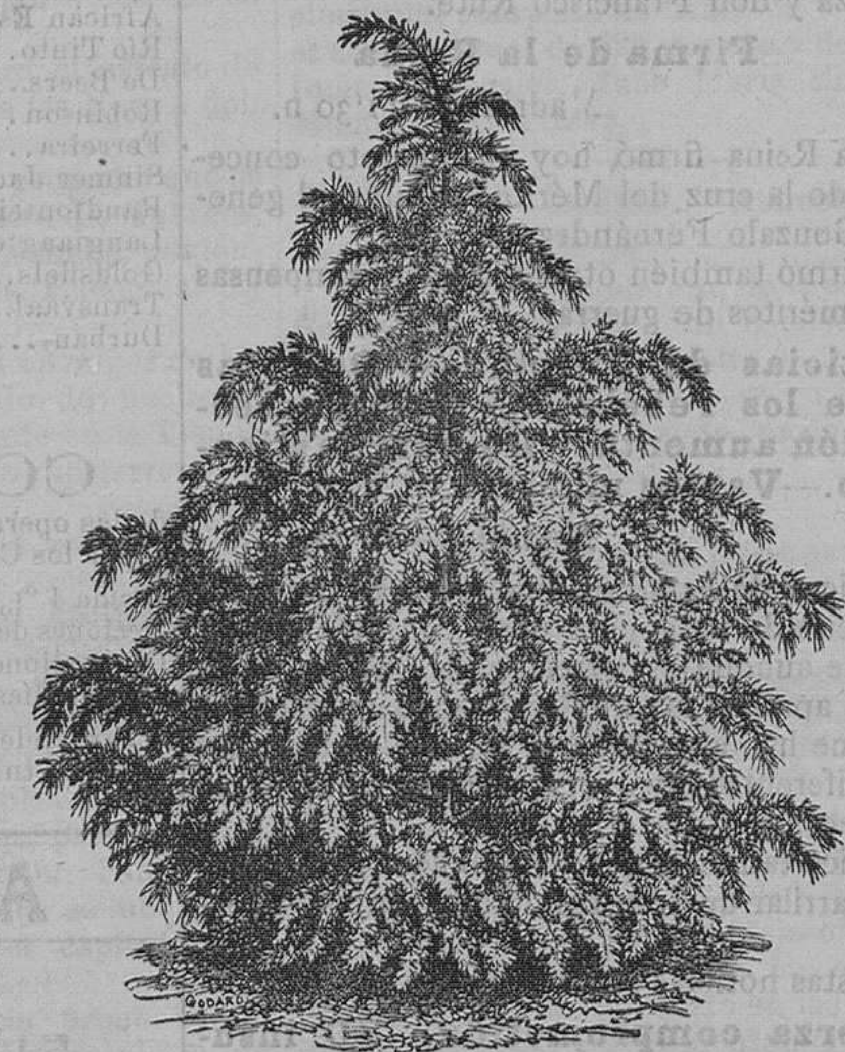
Cedro de Odra. Robusta: pieza, de 1 peseta á 10 pesetas. Idem de Líbano: pieza, de 1'50 pesetas á 10 pesetas.

Vende cuarenta mil vegetales de 200 variedades de árboles frutales, alta novedad.—100 variedades de árboles de sombra y maderables.—400 variedades de arbustos de adorno y floríferos.—600 variedades de cebollas y tubérculos en flor.—200 variedades de plantas en tiestos para canastillas y salones, trazados y plantaciones de parques y jardines, á precios módicos.—Remite catálogos gratis á quien los pida.