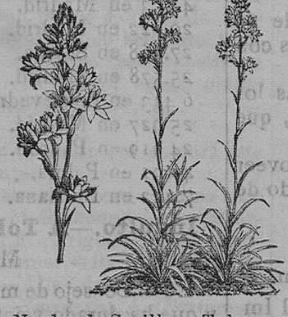
Nardos de Sevilla y Taberosa doble, muy oloroso.—Pieza, 75 céntimos; docena, 6; el 100, 25 pesetas.