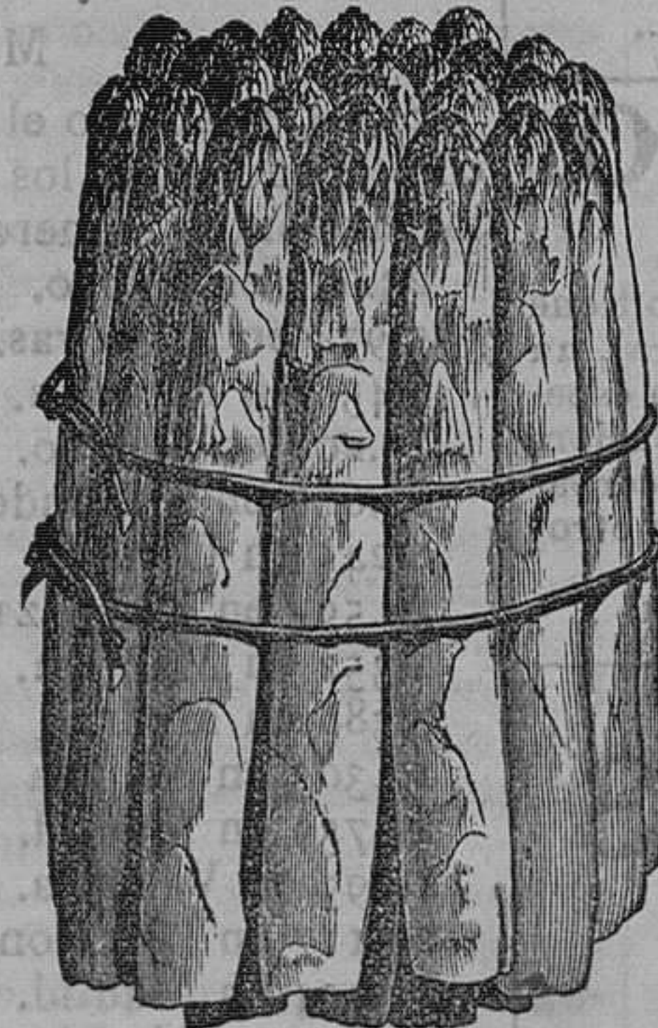
E-párragos: muy precoz de Argeuteuil grueso, el ciento, 16 pesetas.—Idem de Holanda, blanca, el ciento, 10 pesetas.