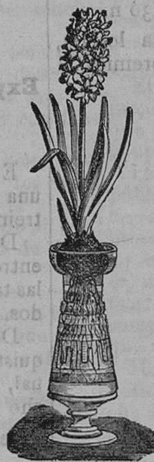
Jacintos variados dobles para agua. Pieza, 1 peseta. Id. con botella, bonito modelo, 4 pesetas pieza.