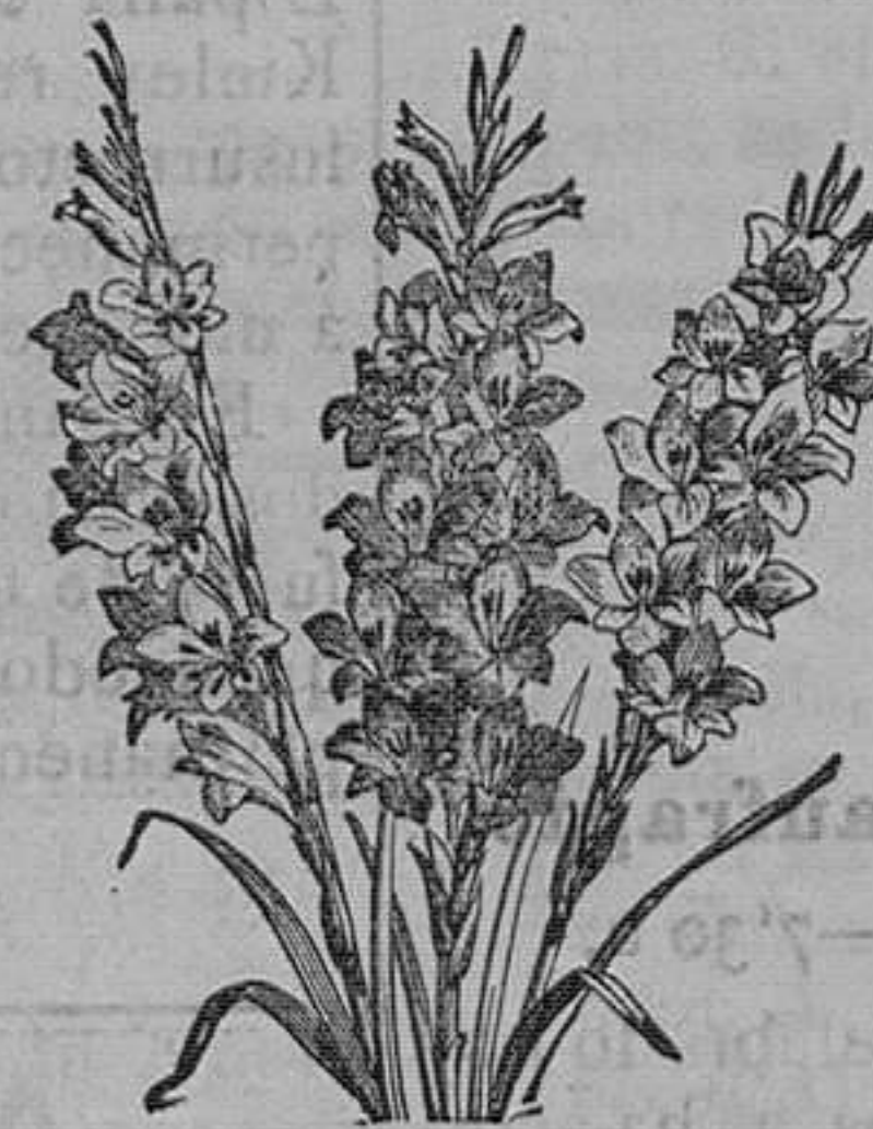
Gladiolos híbridos en 50 variedades, de los floristas. Pieza, 50 céntimos; docena, 4 ptas.; el 100, 15.