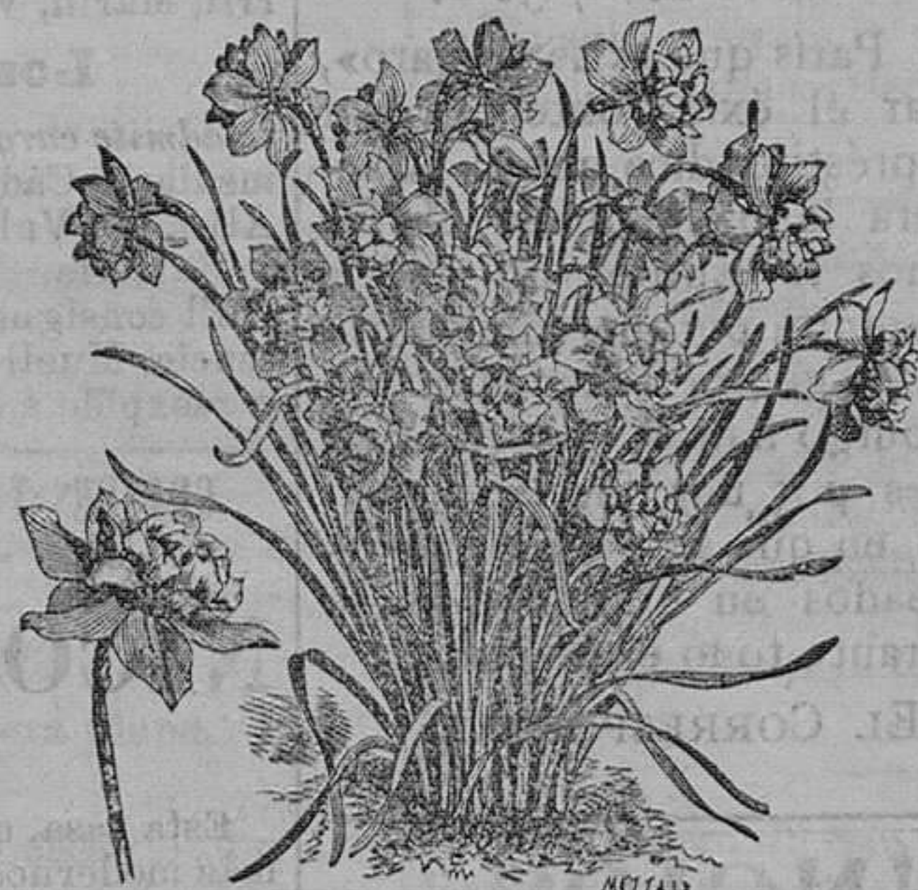
Narcisos dobles de Constantinopla, 20 variedades.—Pieza, 50 céntimos; docena, 4,50; el ciento, 26 pesetas.