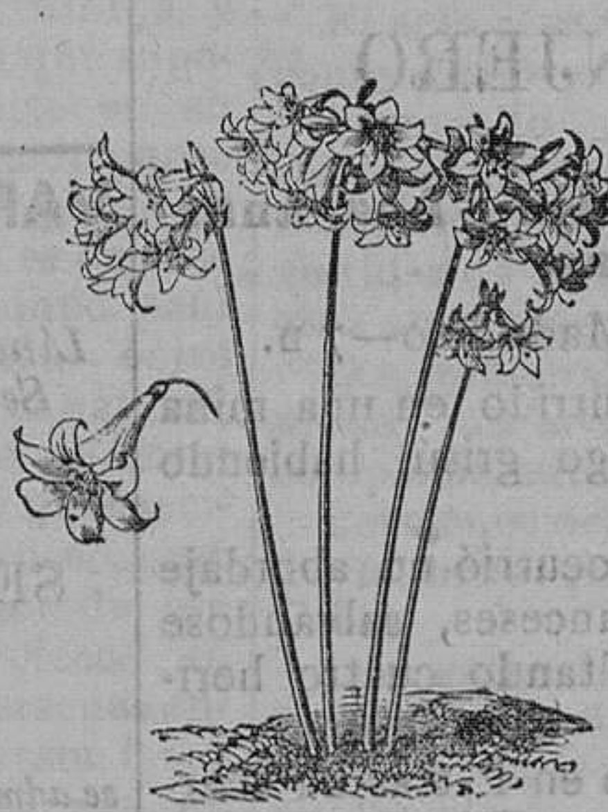
Amarilis velladona, rosa pura para hacer pomada para el pelo. Seis variedades.—Pieza, 1,25 pesetas; docena, 9 pesetas.

Jardinero del Instituto de esta capital, calle de Magallanes, número 36, Santander. Catálogo de cebollas y tubérculos de flores, gratis a quien los pida.