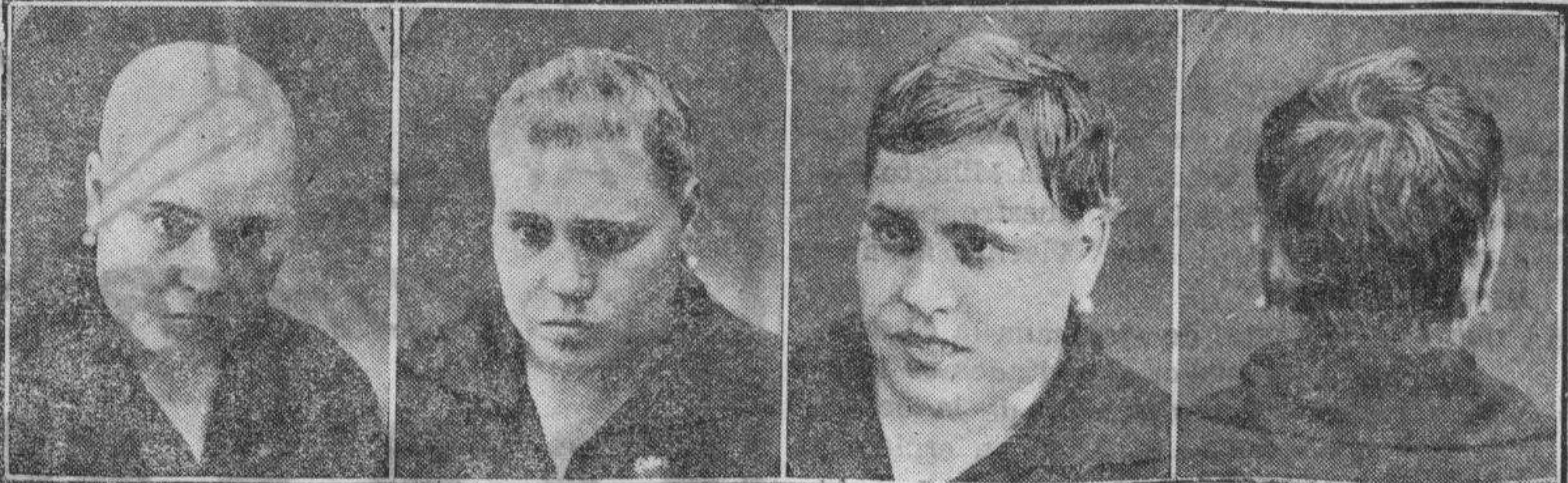
14 años calva 5 meses tratamiento 8 meses tratamiento 12 meses curada

El inventor del CAPILAR J. MOURADE, universalmente conocido por sus maravillosas curas (muy conocido en Valencia por haber curado infinidad de casos de calvicie)