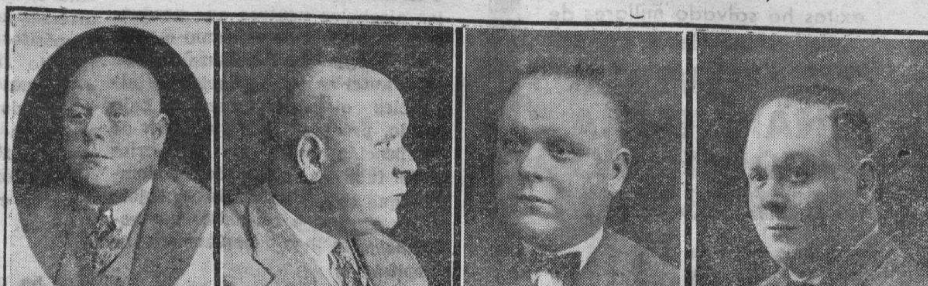
18 años calvo 5 meses tratamiento 9 meses tratamiento 14 meses curado

Instituto J. Mourade, Barcelona, Rambla de las Flores, 4, 1.ª. En Madrid, Fuencarral, 15 Desinfectante, 10 pesetas. Capilar, 20 pesetas. Curación completa, 5 frascos y de regalo uno. Ambos productos forman parte del tratamiento 27.000 enfermos de toda clase de calvicie, dejados por incurables, curados gratuitamente y en mitad de su precio para propaganda de esta maravillosa cura Película estrenada en la Facultad de Medicina de Madrid, Londres, París y Bruselas Para garantía de los compradores se han clausurado todas las sucursales. De venta en Madrid y Barcelona, envío franco de porte