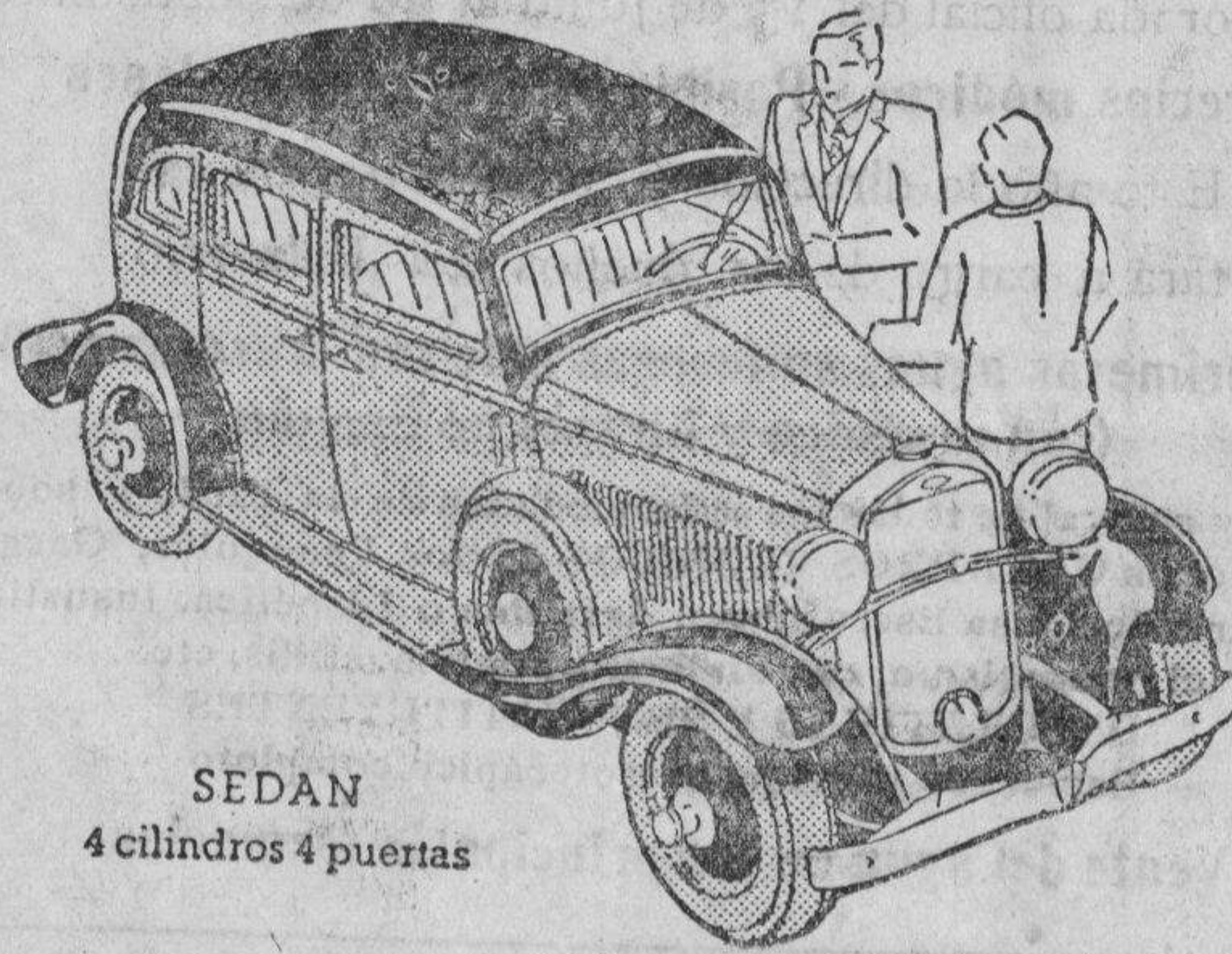
SEDAN 4 cilindros 4 puertas

mucho más amplias y cómodas. El cambio de marchas de 4 velocidades da al coche una gran flexibilidad.