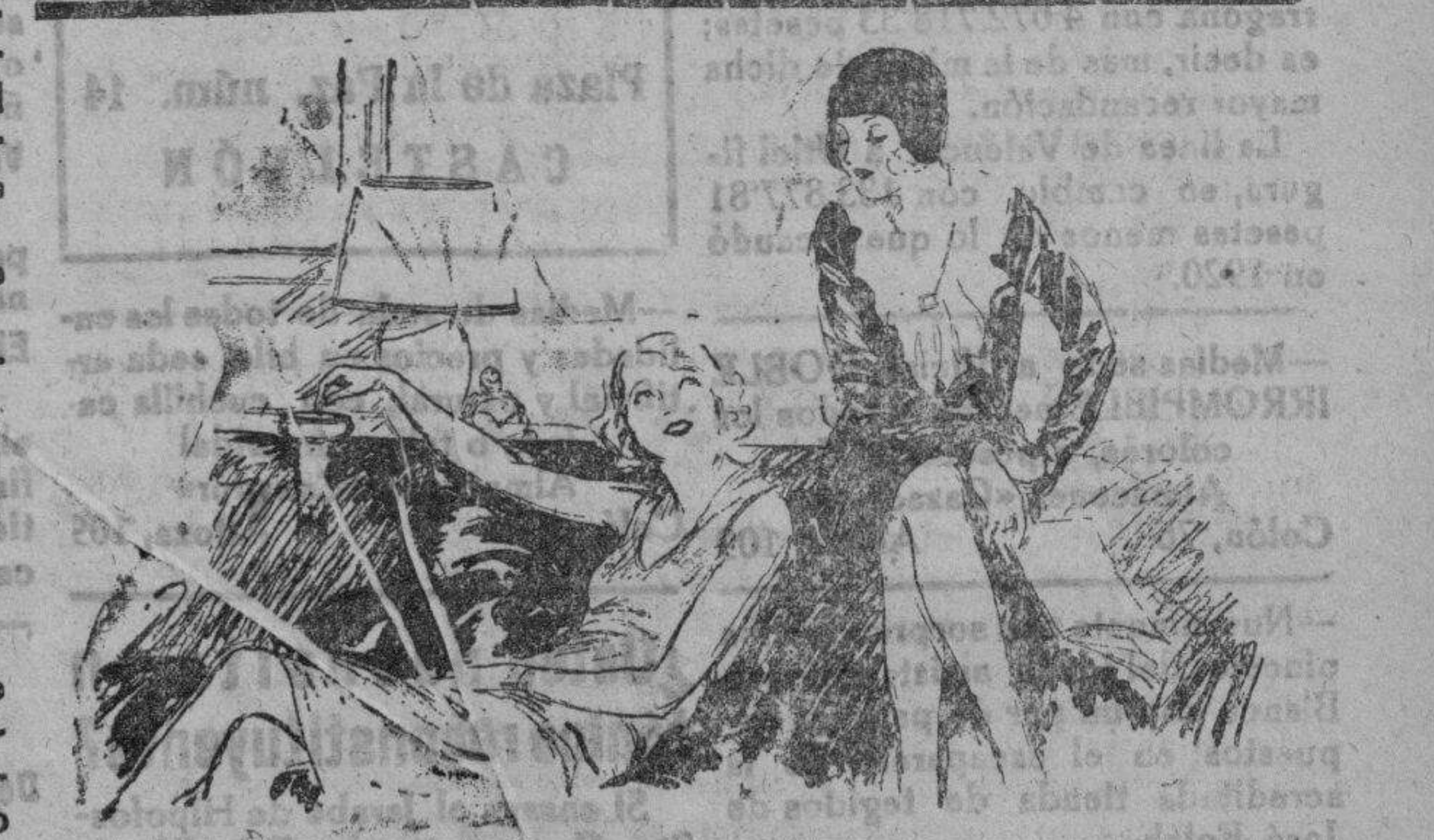
Las viudas afortunadas

Por acuerdo de esta Junta directiva las clases de Contabilidad, Francés e Inglés que patrocina esta Sociedad darán principio el próximo día quince de los corrientes, a cuyo fin queda abierta la matrícula hasta el día catorce inclusivo. Podrán asistir a las mencionadas clases además de los señores socios los hijos y dependientes de estos, menores de diez y siete años. Castellón, 1.º Octubre 1930. La Directiva