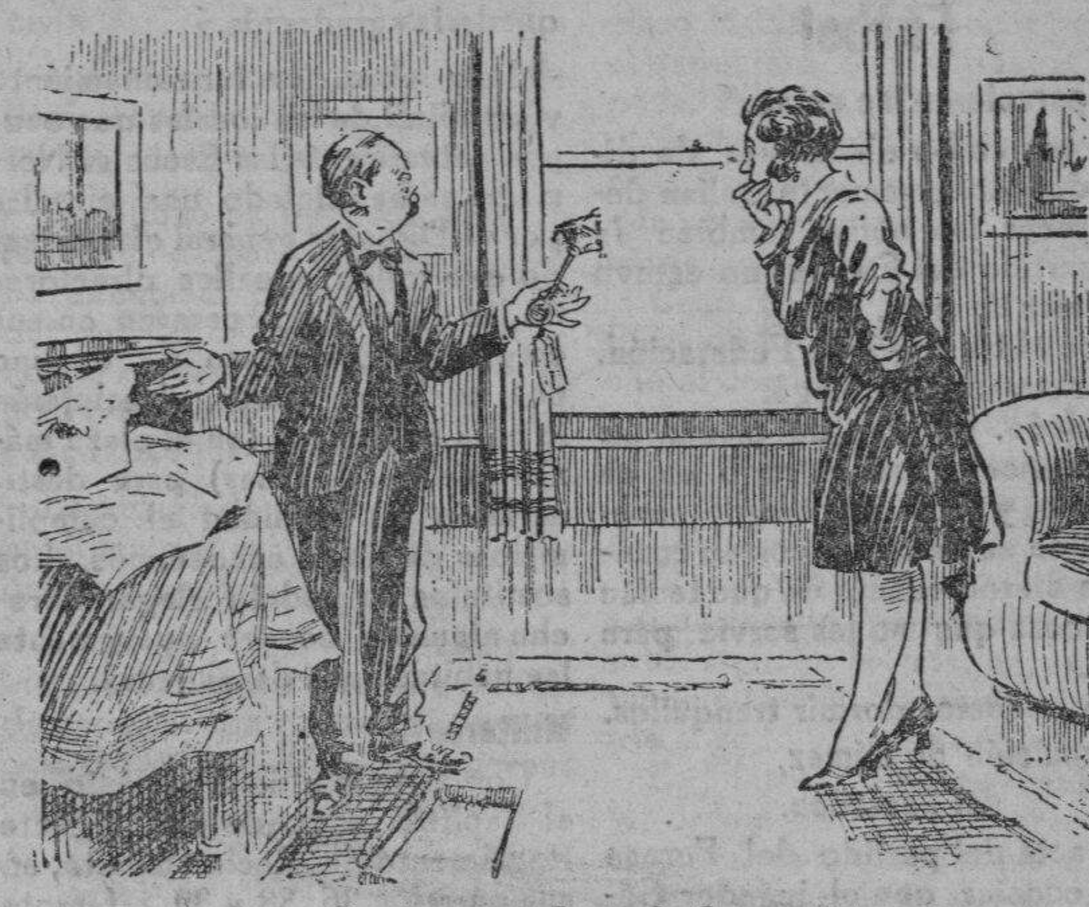
La busca de criada —Todavía estamos sin criada, Juan. ¿No has ido a buscarla a la agencia? —Sí, allí las había a docenas, pero daba la casualidad de que todas ya habían estado en casa.

mona guillo de las Oblatas! Y aún que así fuese, nunca les hubiera atacado como nunca ataco a las personas sensatas y por el contrario, estaría muy agradecido. Pregunte, pregunte a los numeros religiosos que me conocen y usted no ignora y ellos le dirán el concepto que tienen de mi conducta y si ello no le basta, prescinda de sus «sectarios» y apele al testimonio de los vecinos de esta población en donde todos nos conocemos. Dedíquese señor Cristiano a su misión y no le preocupen mis imprudencias, que seguramente las personas concientes, aequilatarán mejor su conducta por ser de mucha más trascendencia social, que no la de este «imprudente» médico. D. Bellido García. Benicassim 26 Septiembre—30.