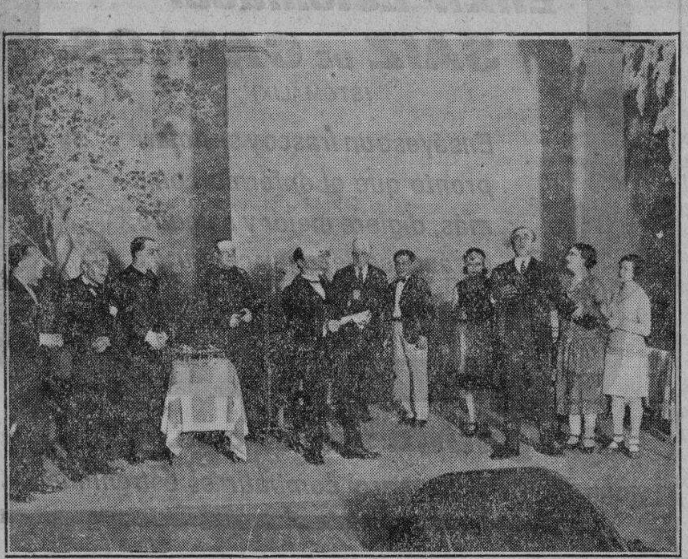
Nuestra fotografía copia una de las más interesantes escenas de la obra

En el Teatro Español y por la compañía de Santpere se ha estrenado «En Josepet de San Celoni», comedia original de Santiago Rusiñol