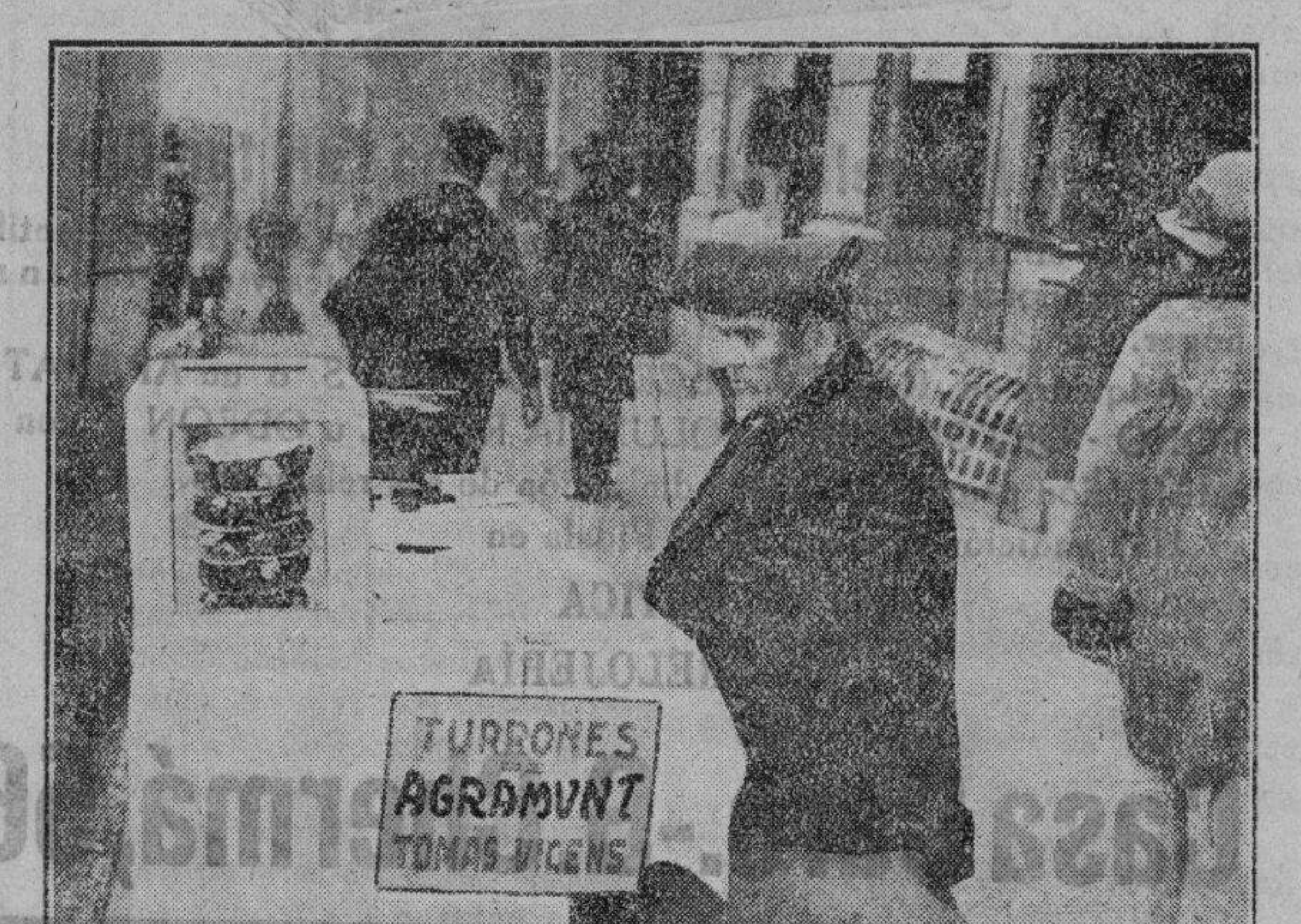
El turronero es en estos días el verdadero tipo popular que abunda en las principales vías vendiendo sus clásicos turrones