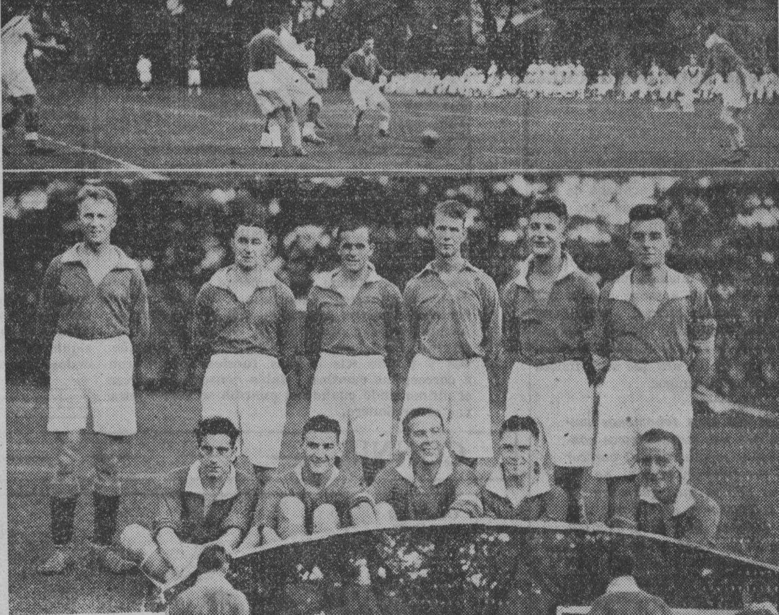
Varias vistas del partido de futbol celebrado ayer tarde en el campo de San Marcelino entre el once del 'H.M.S. Medway' y del Nomad Club...