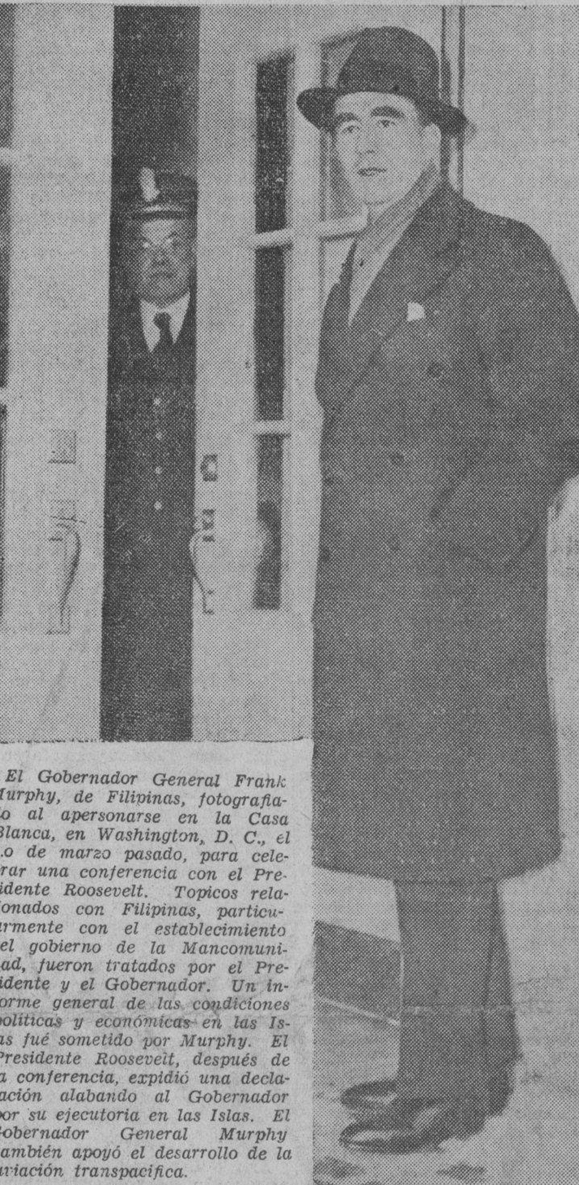
El Gobernador General Frank Murphy, de Filipinas, fotografiado al apersonarse en la Casa Blanca, en Washington, D. C., el 1.º de marzo pasado, para celebrar una conferencia con el Presidente Roosevelt.