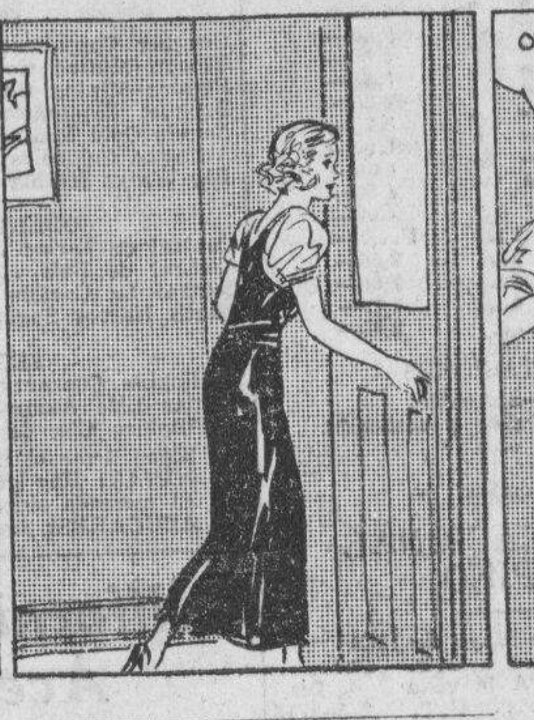
EL EXTRAÑO: Hola, cara de angel. Pues alguien de aqui sabe escoger bien.