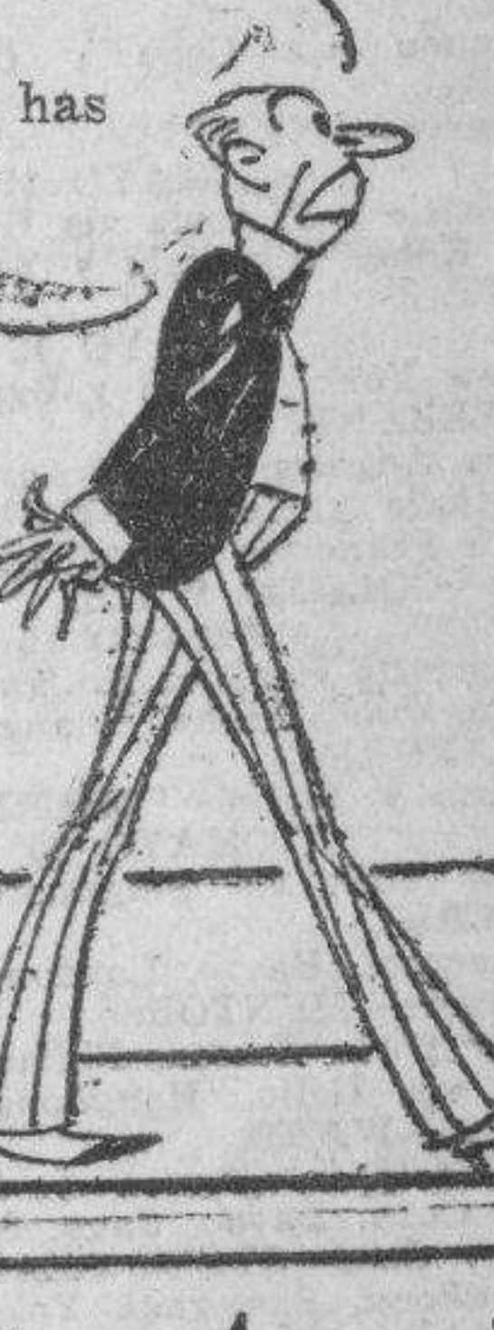
Pero has visto!