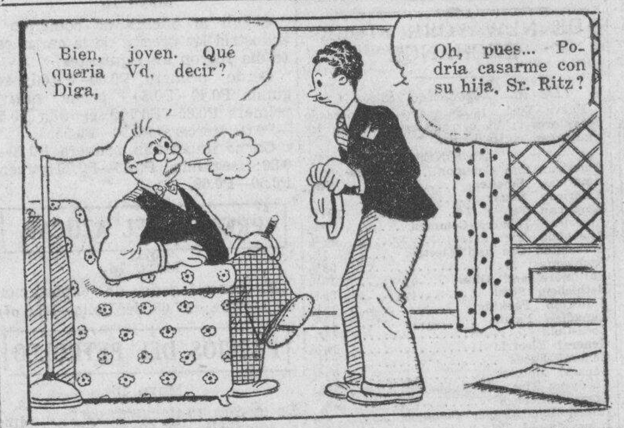
Bien, joven. Qué queria Vd. decir? Oh, pues... Podria casarme con su hija, Sr. Ritz?