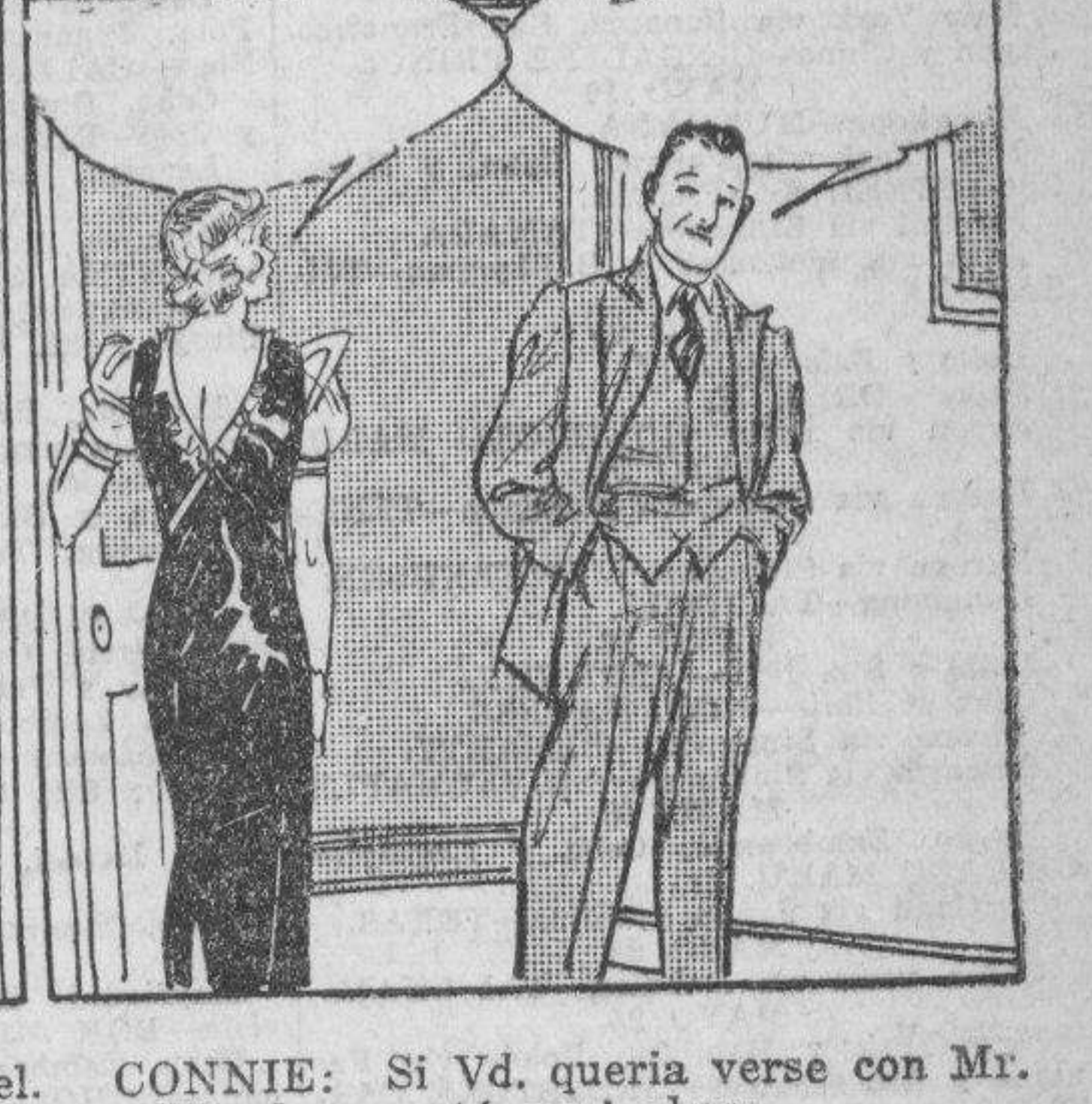
EL EXTRAÑO: Bien! Entonces me quedare aqui por un momento para trabajar amistad.