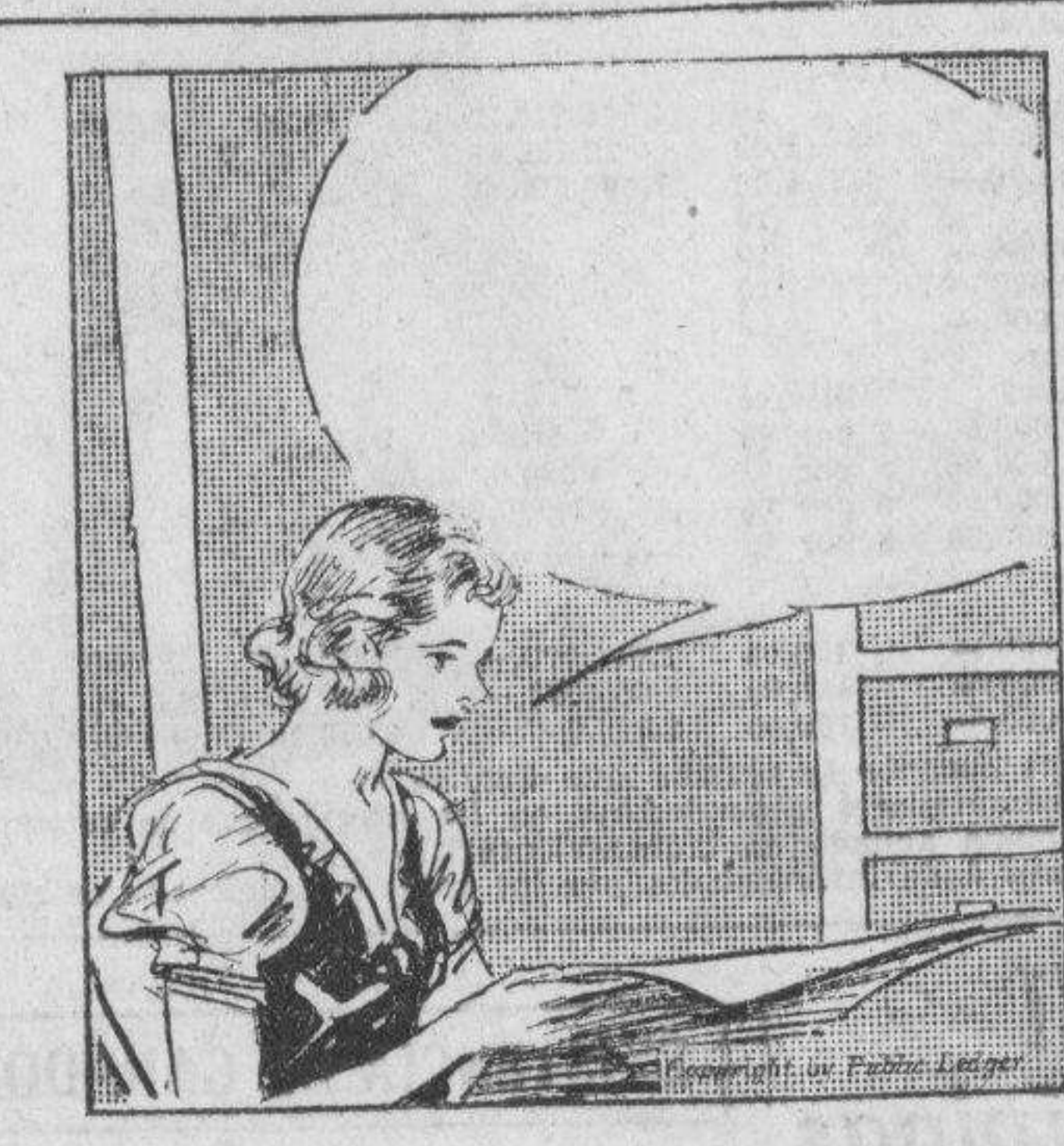
CONNIE: Pues parece que Mr. Ward creyó que todo esto estaba correcto en lo que respecta a la aritmética. Ciertamente que ha tenido un cálculo muy aproximado sobre estas partes de aeroplano. Confío que conseguiremos el contrato.