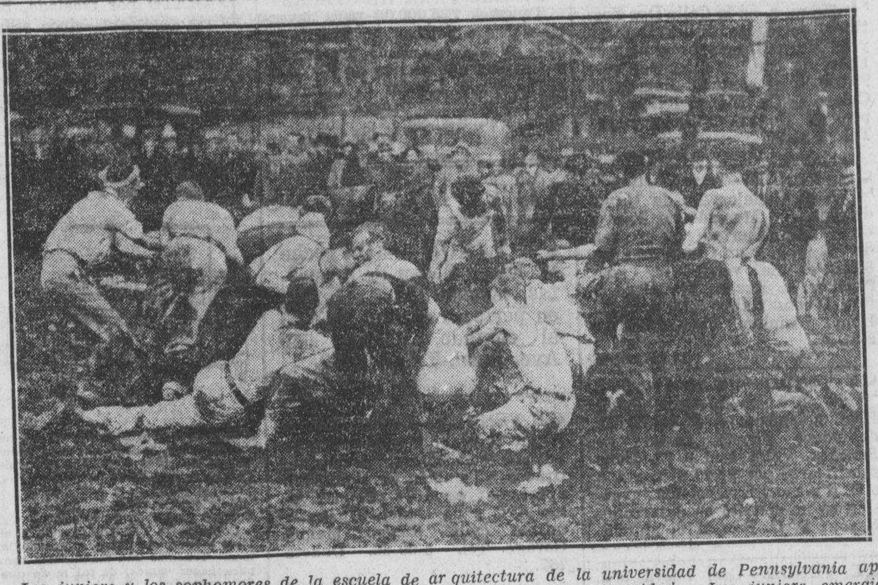
Los juniors y los sophomores de la escuela de arquitectura de la universidad de Pennsylvania...