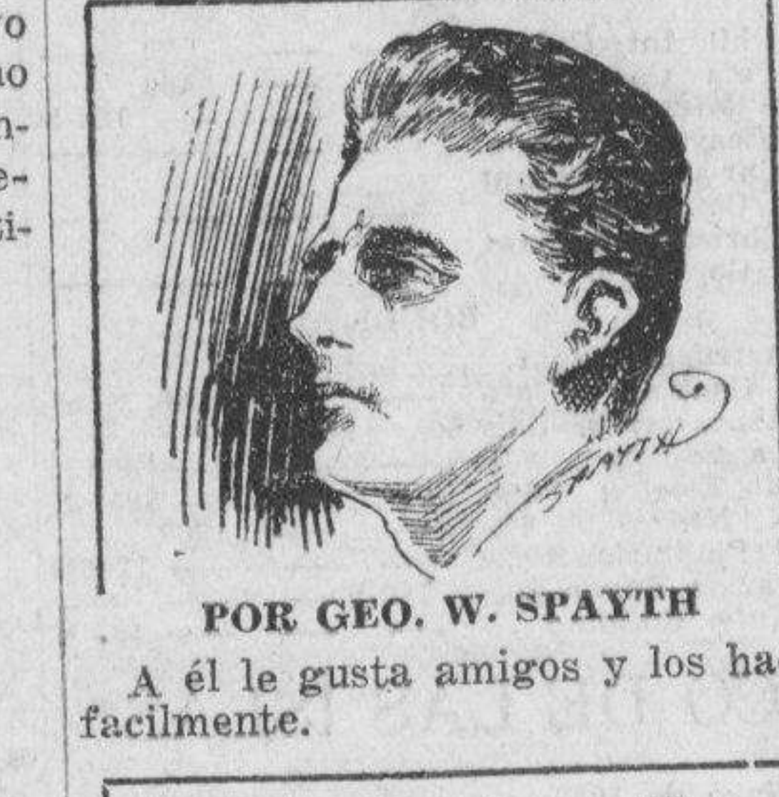
Por GEO. W. SPAYTH. A él le gusta amigos y los hace facilmente.