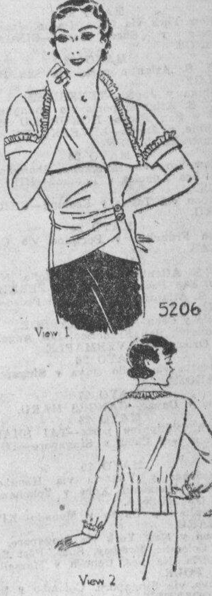
FASHION BUREAU (LA VANGUARDIA) United Features Suite 1110, 220 East 42nd St.

Los volantes valen para todo— inclusive la blusa juvenil hasta la cintura. Parece una paradoja de la moda. Pero aguarde hasta que vean cun hermoso es esto con su nuevo traje de primavera. El cuello ancho parecido a bufanda es elegante puesto fuera del abrigo, y le gustará las mangas cortas adornadas, sin mencionar el corte de la cintura. Hágalo de tafetan blanco—esa es una de las nuevas telas para blusa—o una tela de batista blanco fino. Esta blusa es tan facil y poco costoso de confeccionar, que quizas lo quiera de diferentes colores. No se olvide que las blusas oscuras son ultra elegantes con trajes ligeros. El tamaño 16 requiere 2 yardas de tela de 36 pulgadas con volantes de 1 1/4 yardas. Un inventor ruso declara que ha encontrado la fórmula para "manufacturar" alertas pastillas que, disueltas en agua, convierten la misma en gasolina para automovil. En Londres se recibió una carta dirigida a cierta dama, domiciliada "en la misma calle donde vivia Sherlock Holmes". El cartero entregó la misma sin contratiempo alguno. El Continente Antártico se estima que tiene una extensión de 5,000,000 de millas cuadradas; el de los Estados Unidos es de 3,026,789.