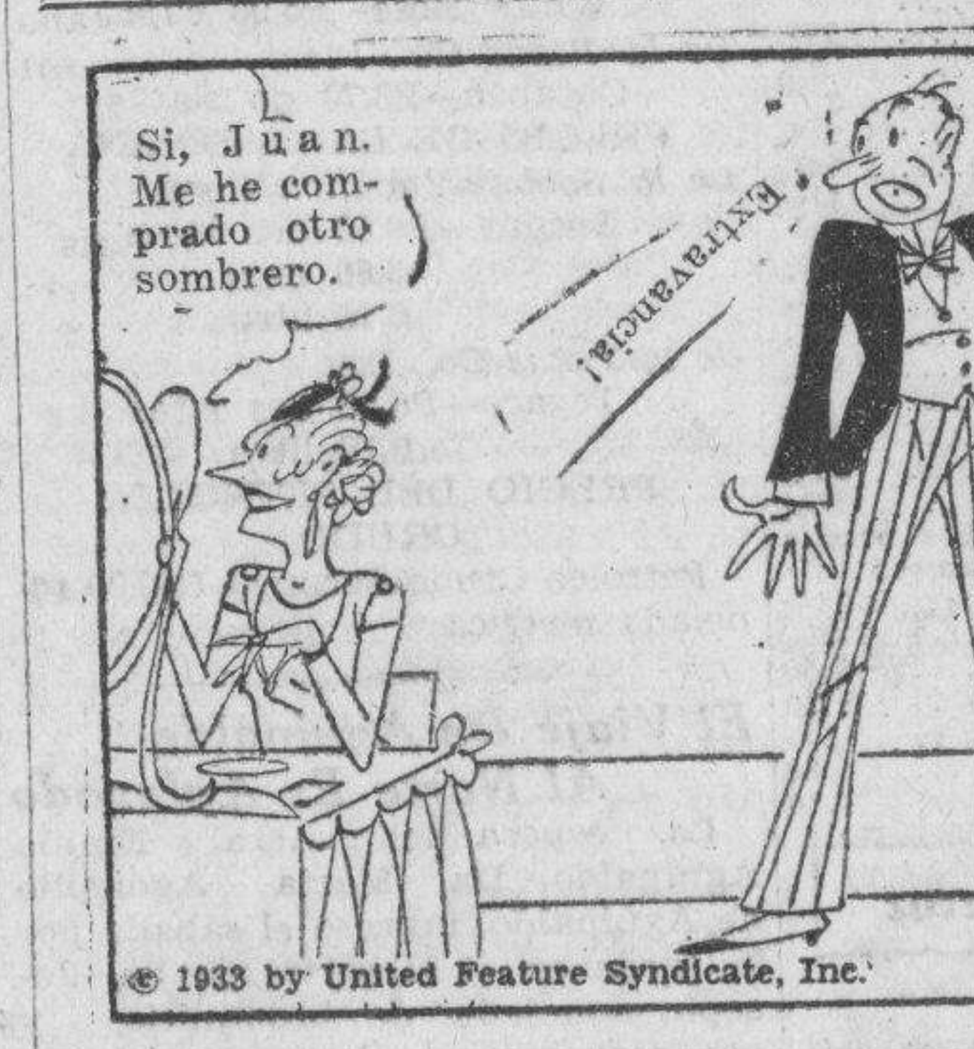
Si, Juan. Me he comprado otro sombrero.