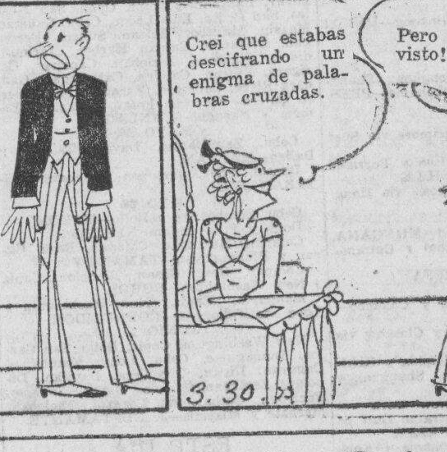
Crei que estabas descifrando un enigma de palabras cruzadas.