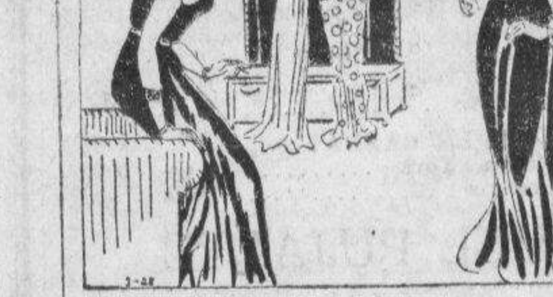
Por HELEN DECIE. Preguntas—Debe siempre levantarse una joven (como hace un hombre) cuando una mujer de mas edad entra en la sala? Algunas mujeres no casadas parecen reaccionar de esto, como una reflexión en su edad. Miss S., por ejemplo, dijo enojosamente: "sientes,