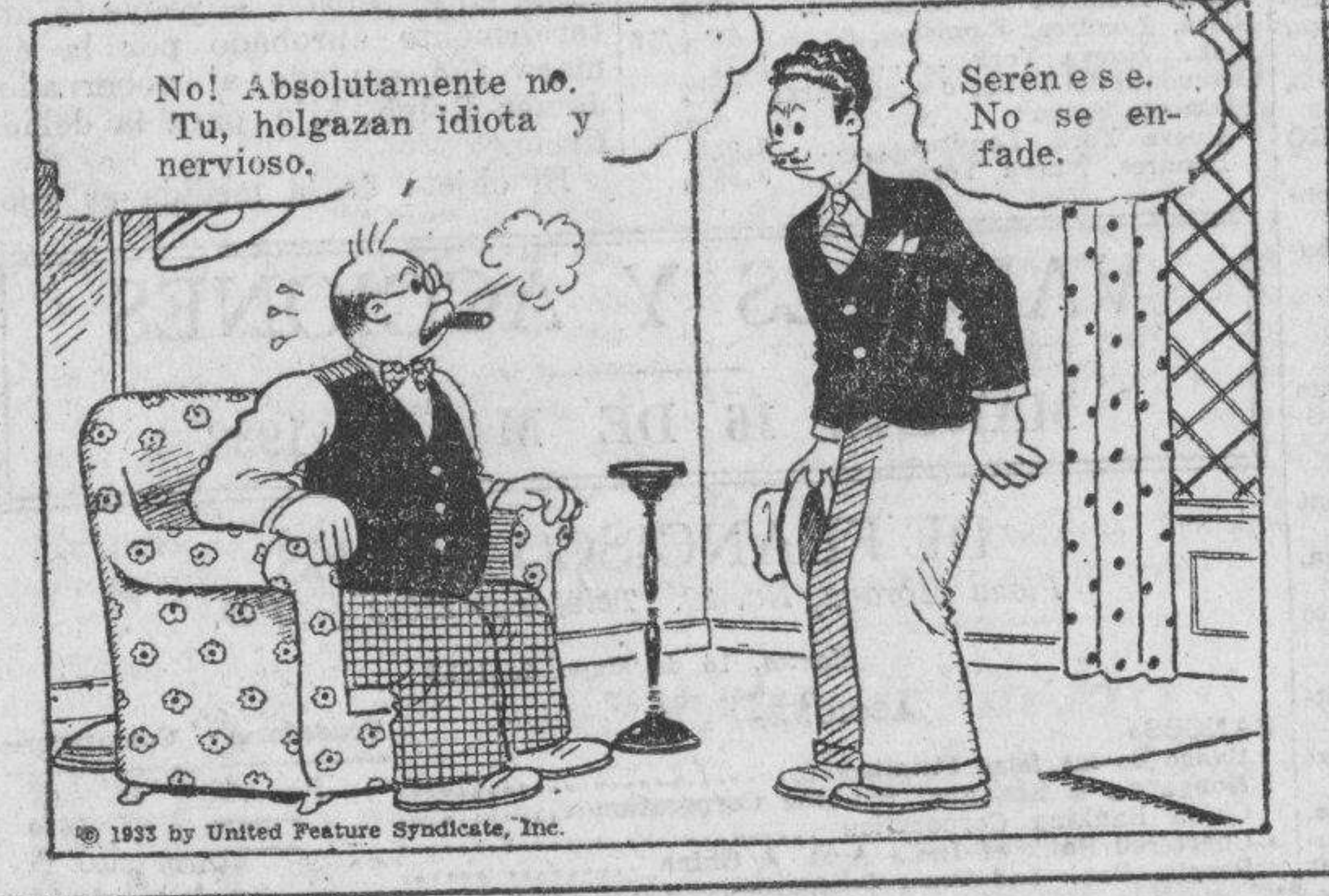
No! Absolutamente no. Tu, holgazan idiota y nervioso. Seré ese. No se enfade.