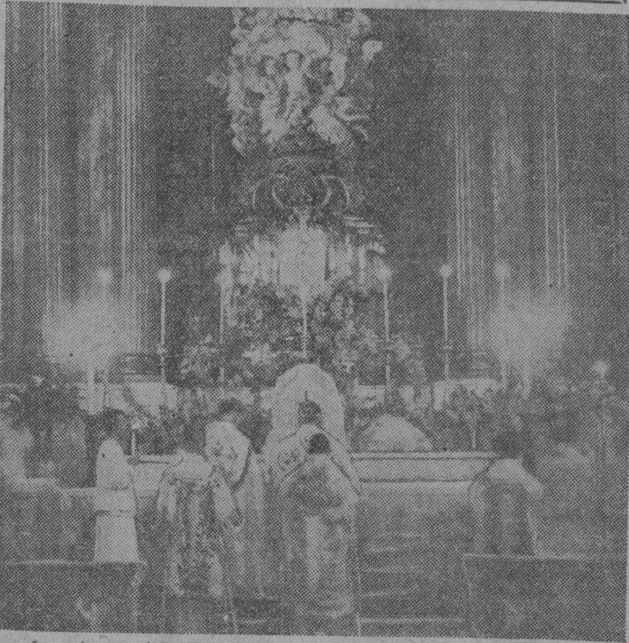
La misa pontifical que esta mañana, a las nueve, se celebró en la iglesia de San Ignacio para conmemorar el día de hoy, Día de Acción de Gracias. En la fotografía aparece el altar mayor durante la ceremonia de la misa. Aparece oficiando el Sr. Arzobispo de Manila, Mons. Miguel O'Doherty.

DE GRATITUD Y SACRIFICIO YA RECIBIDOS El total de P1,796,000.00