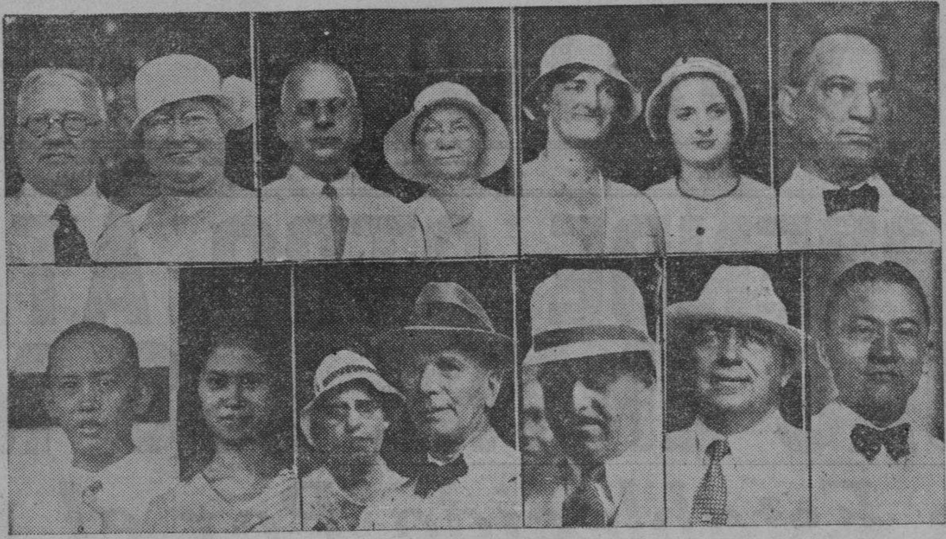
Un grupo de prominentes residentes de Manila llegaron esta mañana a bordo del transoceanico "President Hoover"...