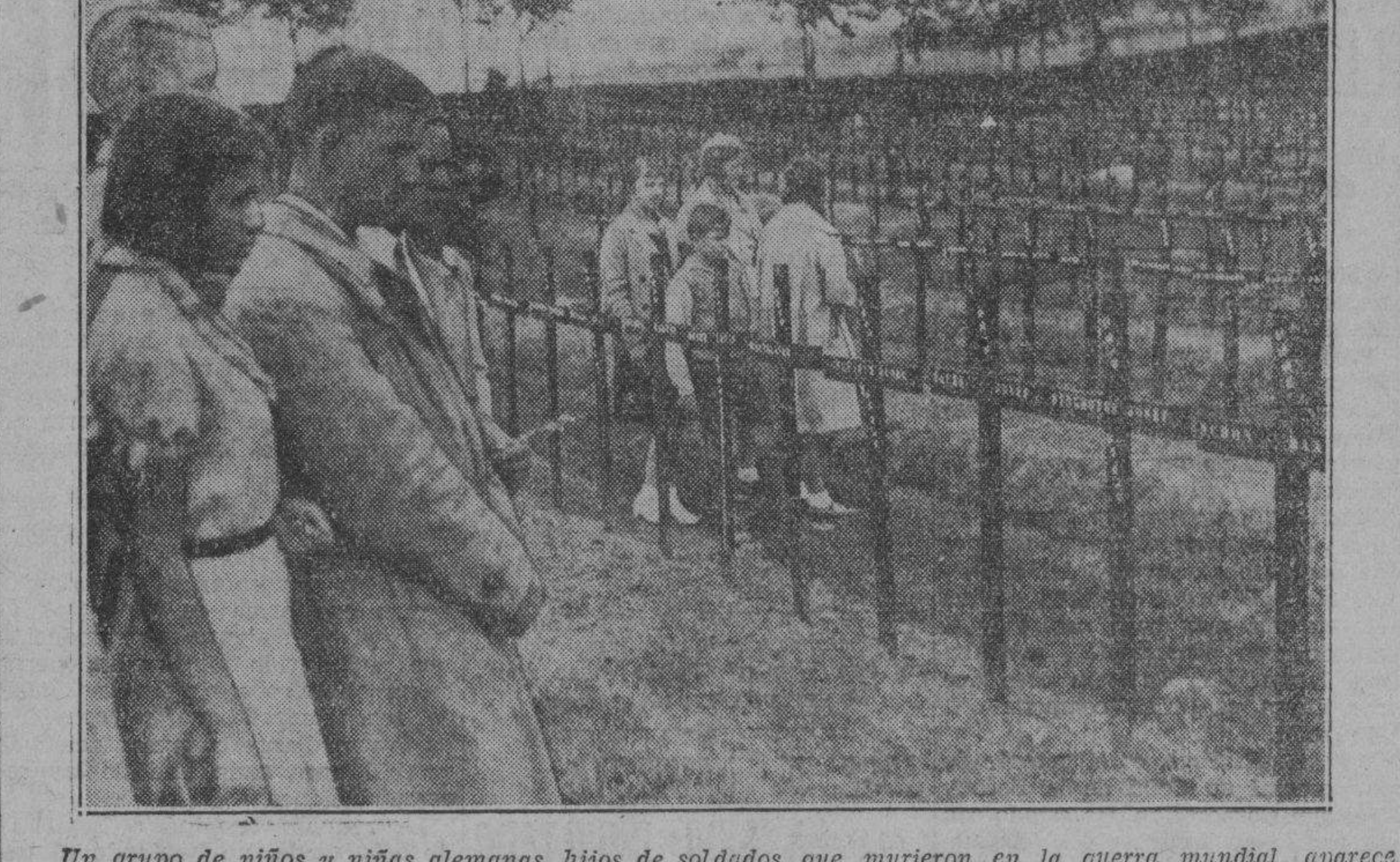
Un grupo de niños y niñas alemanas, hijos de soldados que murieron en la guerra mundial, aparecen aquí visitando las tumbas de sus padres...