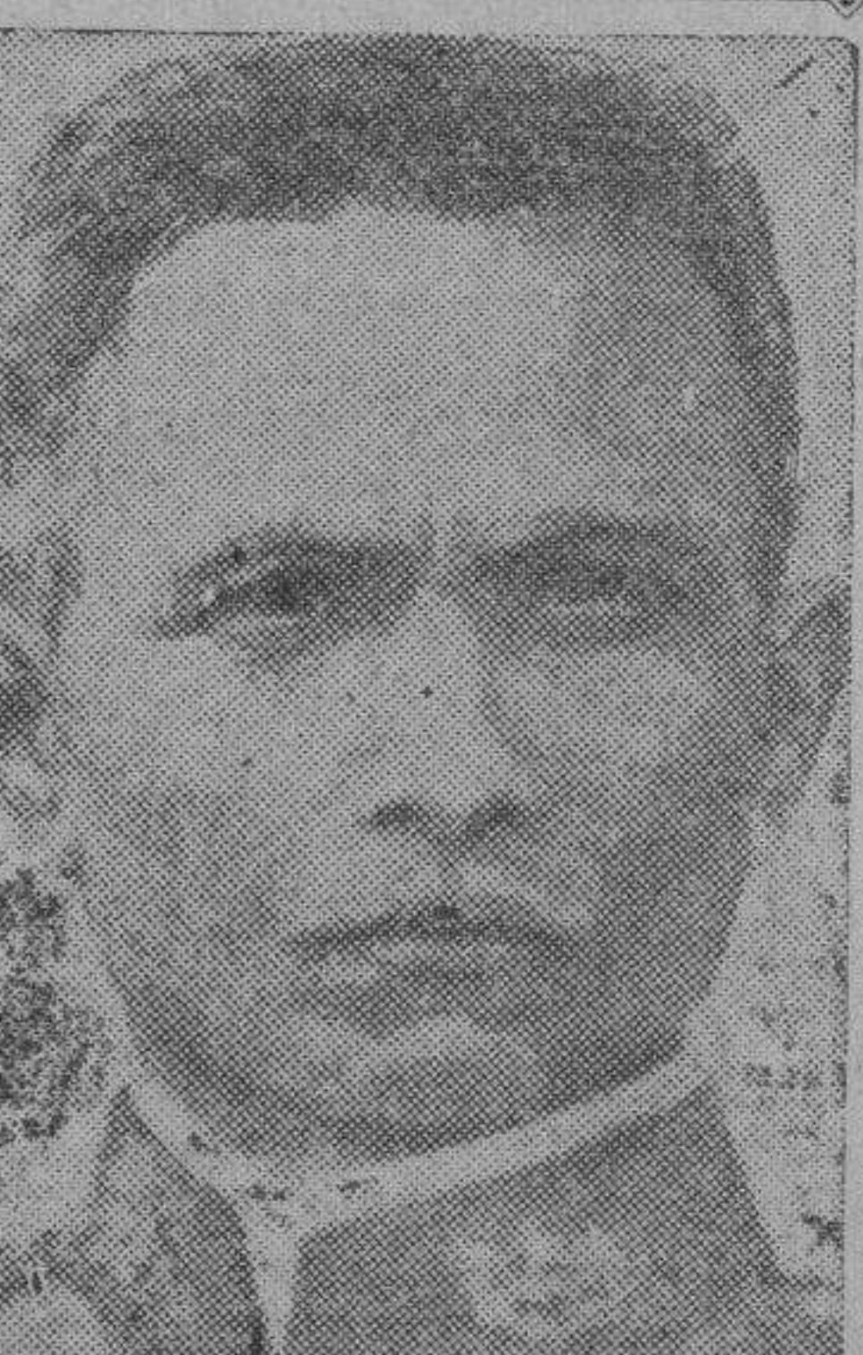
En su exilio de Yokohama, en donde vive con su familia, debe estar atareado en estos momentos, recibiendo felicitaciones de todas partes...