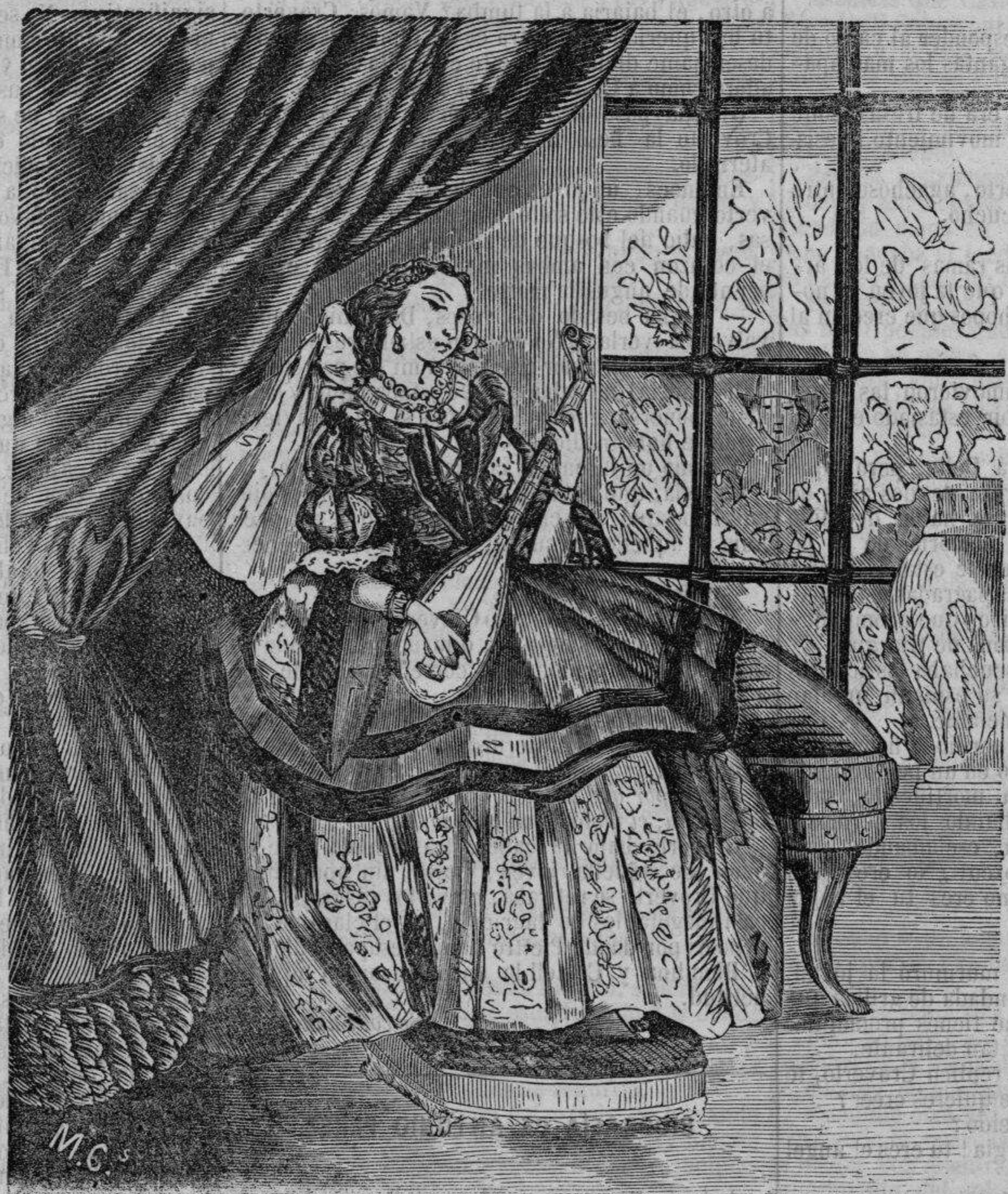
Georgia sentada á la reja acompañándose con el laúd, entonaba dulces canciones. (Pág. 486, columna 3.ª)