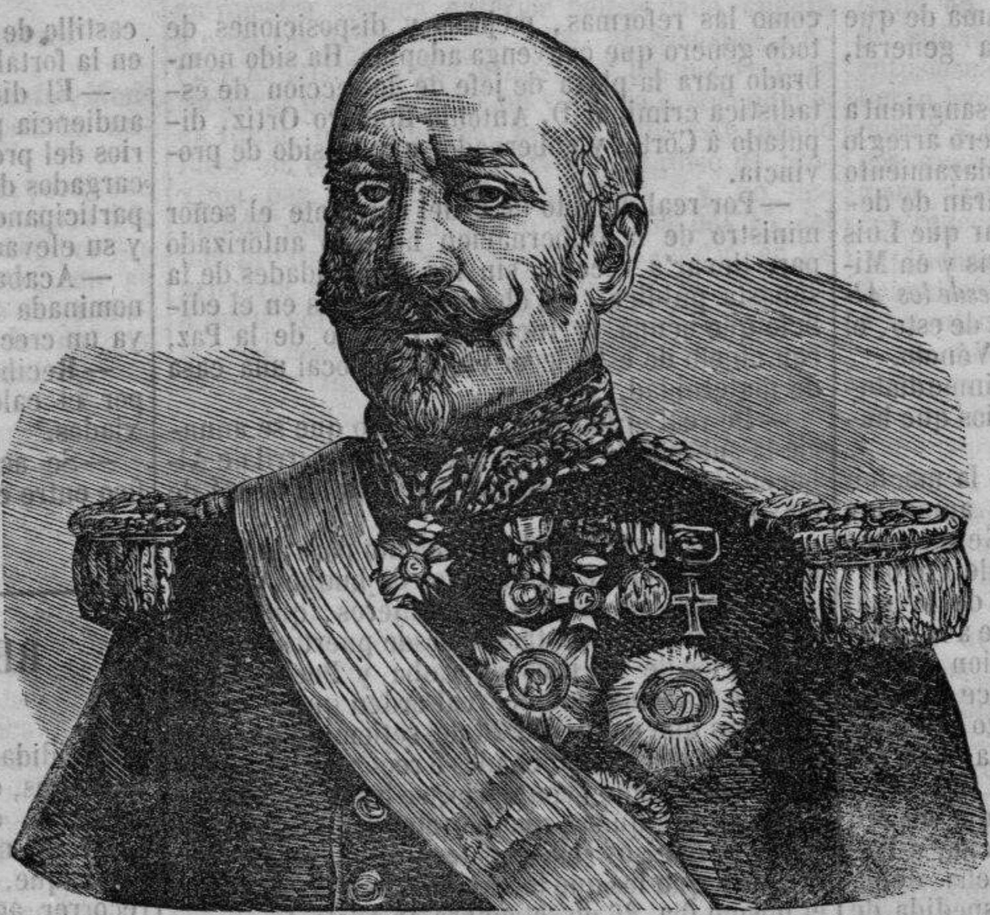
EL MARISCAL REGNAUD DE SAINT-JEAN D'ANGELY.