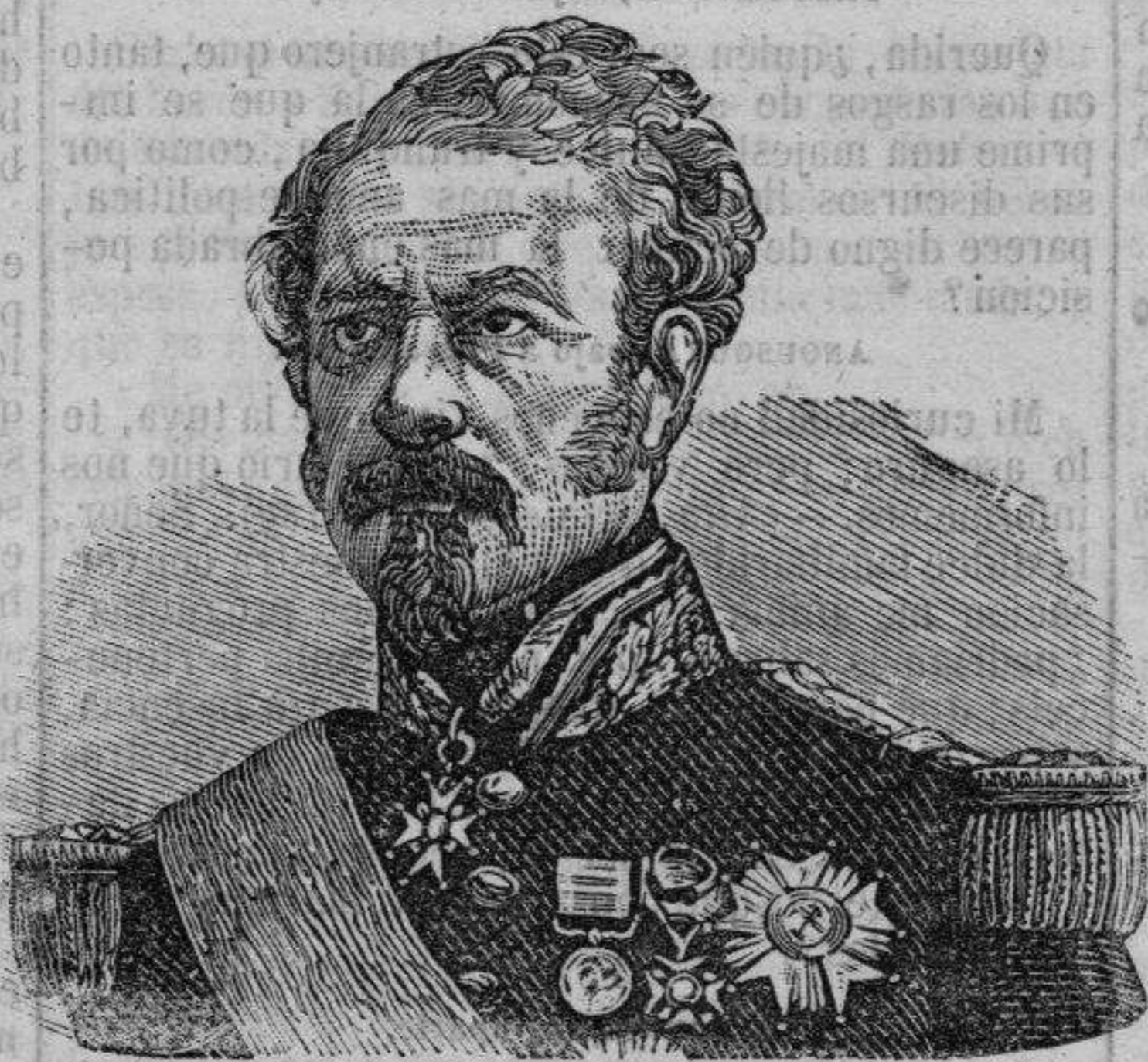
EL GENERAL NIEL.