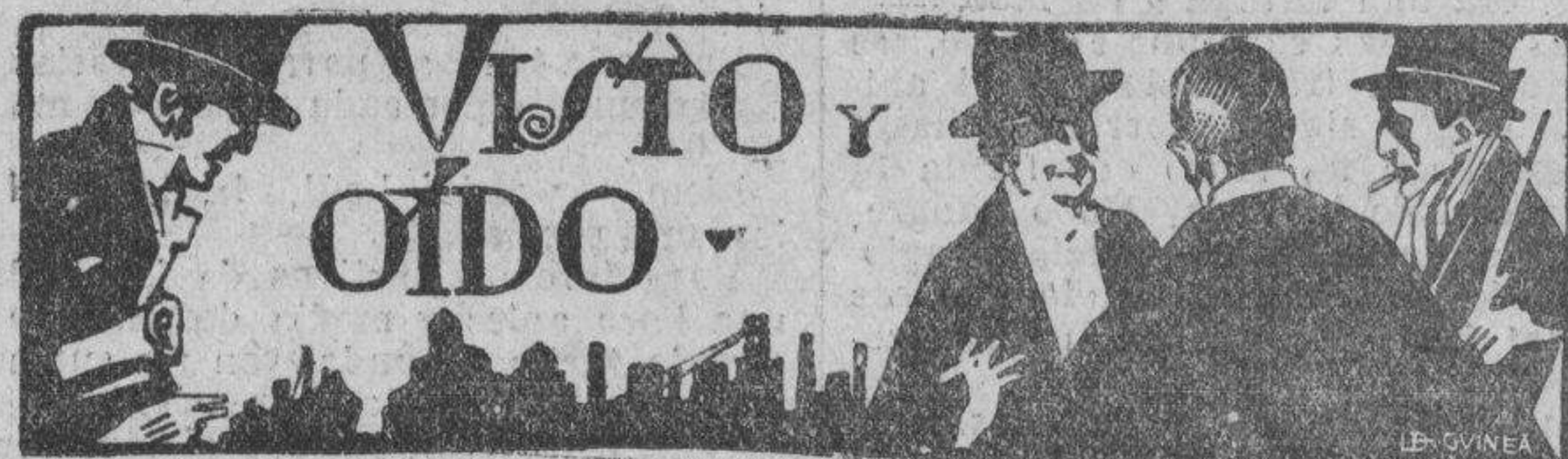
«EL SITIO» Y EL DÍA 29

Berlín 21.—La distribución de puestos en el nuevo Reichstag ha sido motivo de grandes dificultades ayer, por negarse casi todos los miembros de los antiguos partidos a tener sus puestos al lado de los partidarios de Hitler.