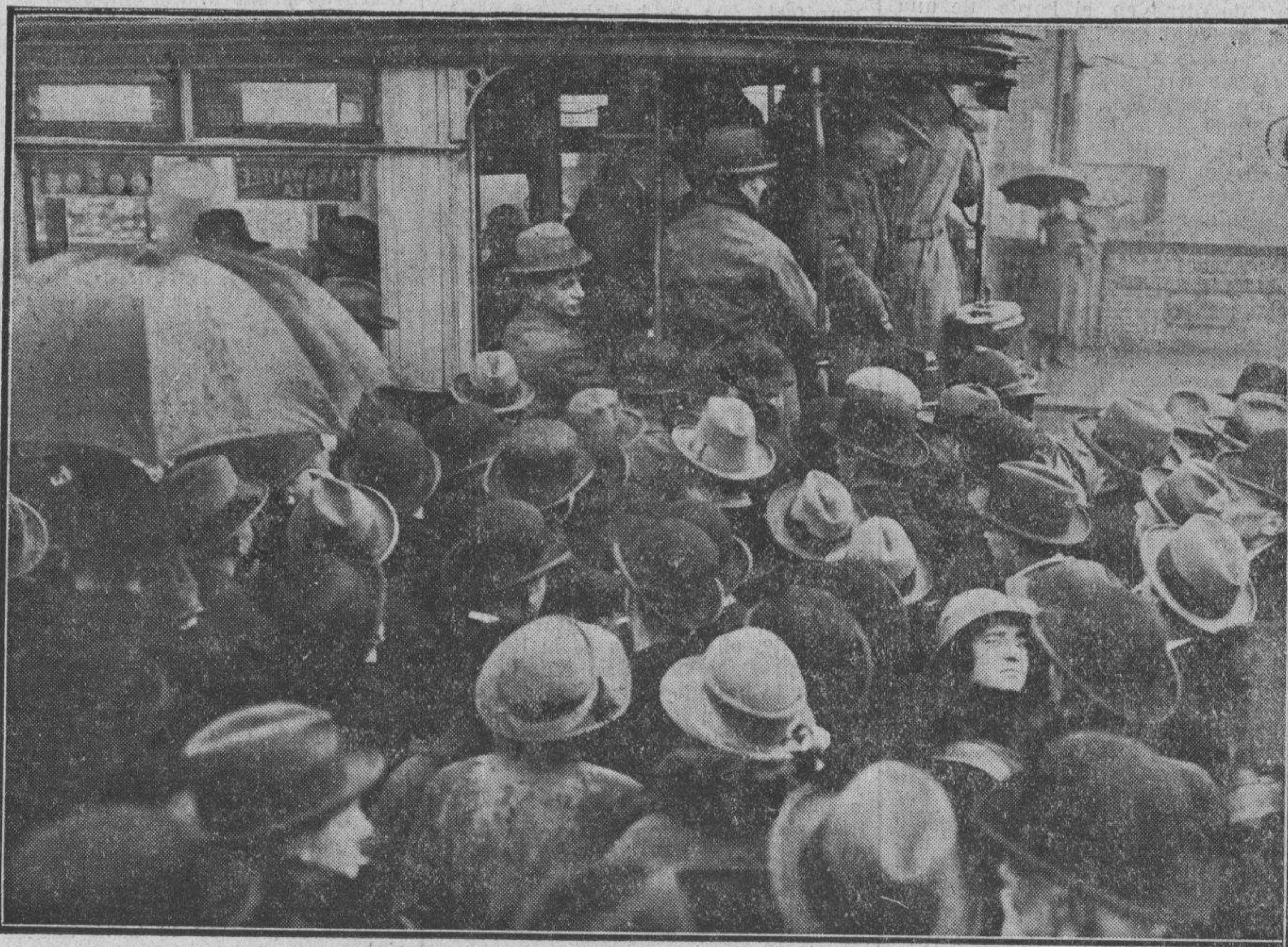
LOS LONDINENSES SE APRESURAN A TOMAR EL ÚLTIMO TRANVÍA

prender que la belleza sin par del arte y del carácter griegos y la sabiduría sólida de la legislación y de la administración romana sea y continúe siendo el obstáculo más grande para los impulsos creadores de la vida moderna. Por la manera como se enseñan en escuelas y colegios, las lenguas y literaturas clásicas son las materias más difíciles; ocupan el tiempo más precioso de nuestra juventud, nos roban las horas de placer, y ningún otro estudio importante puede coexistir con ellas. Presenta la historia de la humanidad con grotescas fallas de perspectiva, satura a sus víctimas de prejuicios griegos y latinos, que pervierten el concepto de todo proceso histórico. Su material consiste en lenguas muertas, y, aunque en menor grado, literaturas olvidadas, conservadas artificialmente, como los pickles, sin ninguna capacidad de evolución y crecimiento, y por lo tanto sólo comportan ejercicios de expresiones y de formas de pensamientos estereotipados. Al presente, ante las necesidades del mundo, es imposible considerar una escuela dirigida por un maestro clásico sino como un cementerio y como un foco de infección mortífera para nuestro sistema educativo.