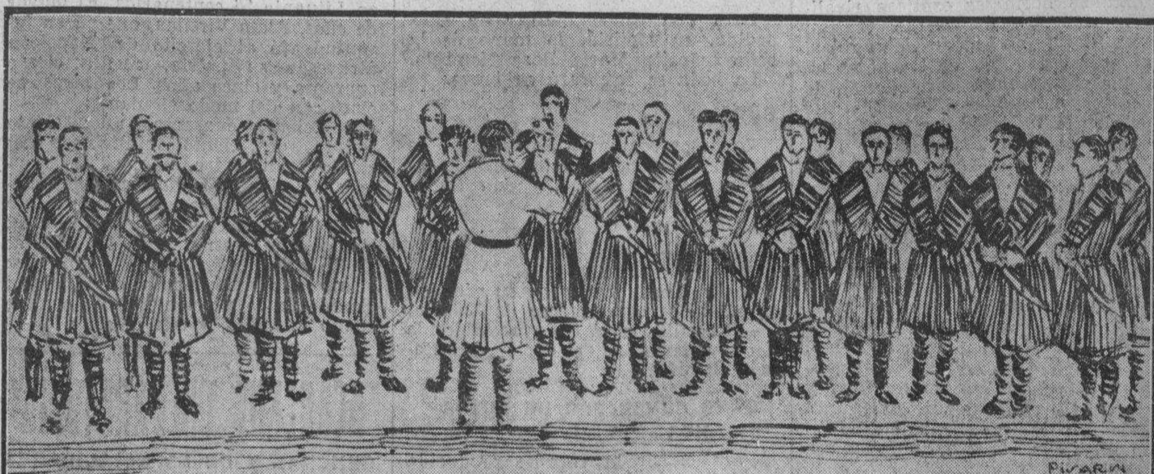
«Los cosacos del Kuban». (Apnnte durante el concierto, por «Pisarrin»)

El combate era para el campeonato del mundo del peso gallo, que desde ayer detenta Goldstein. El combate, que fué a 15 rounds, fué una neta victoria del challenger, que dominó durante todo el combate. Una muchedumbre enorme lo presenció.