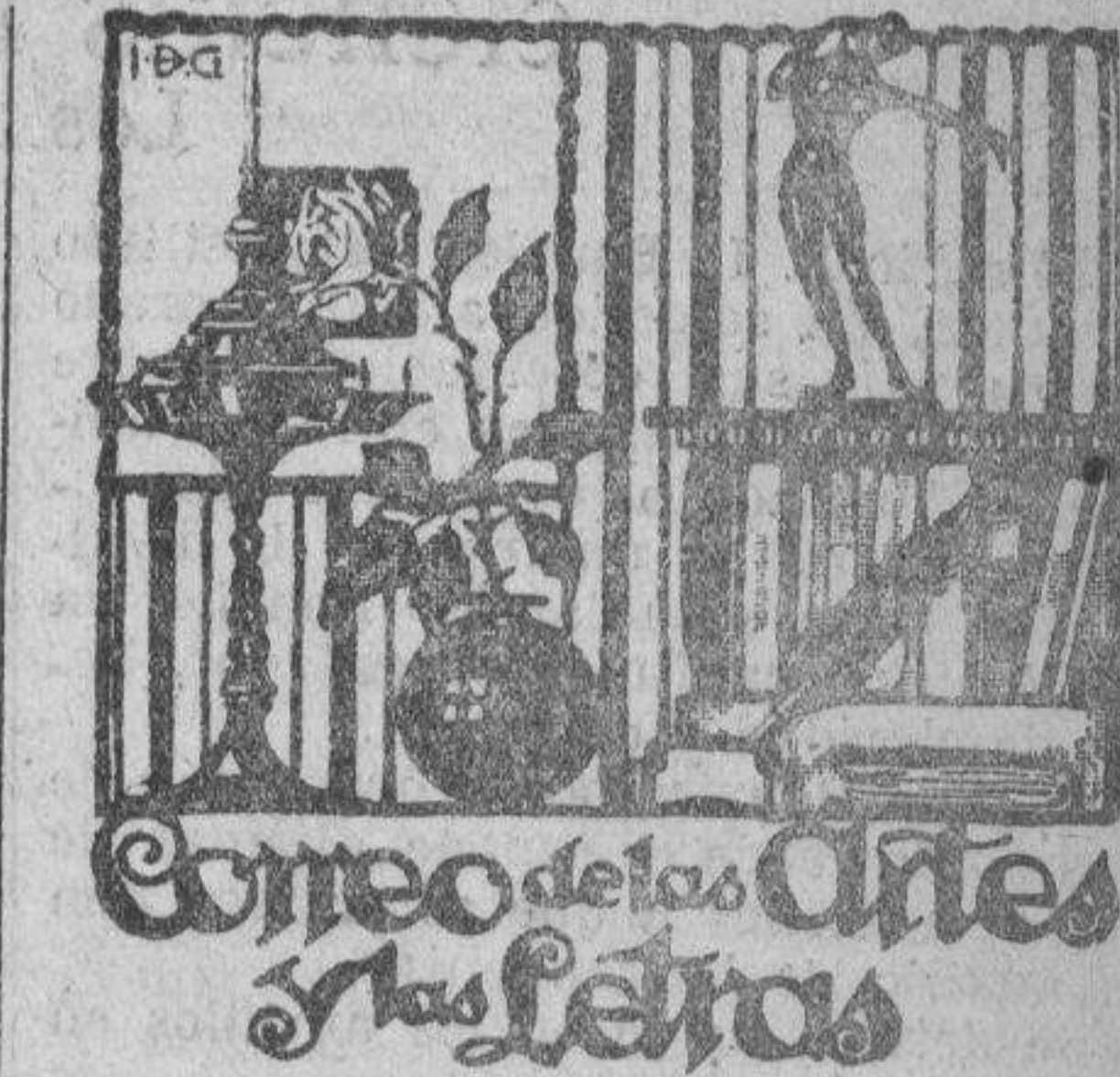
Como de los Cines Mas Letras

A la salida de la ceremonia religiosa se harán los honores militares por dos tercios de la guarnición de París que estarán al mando de un general de división. El Gobierno ha recibido el pésame de todos los Gobiernos y cortes aliadas y de otros países.