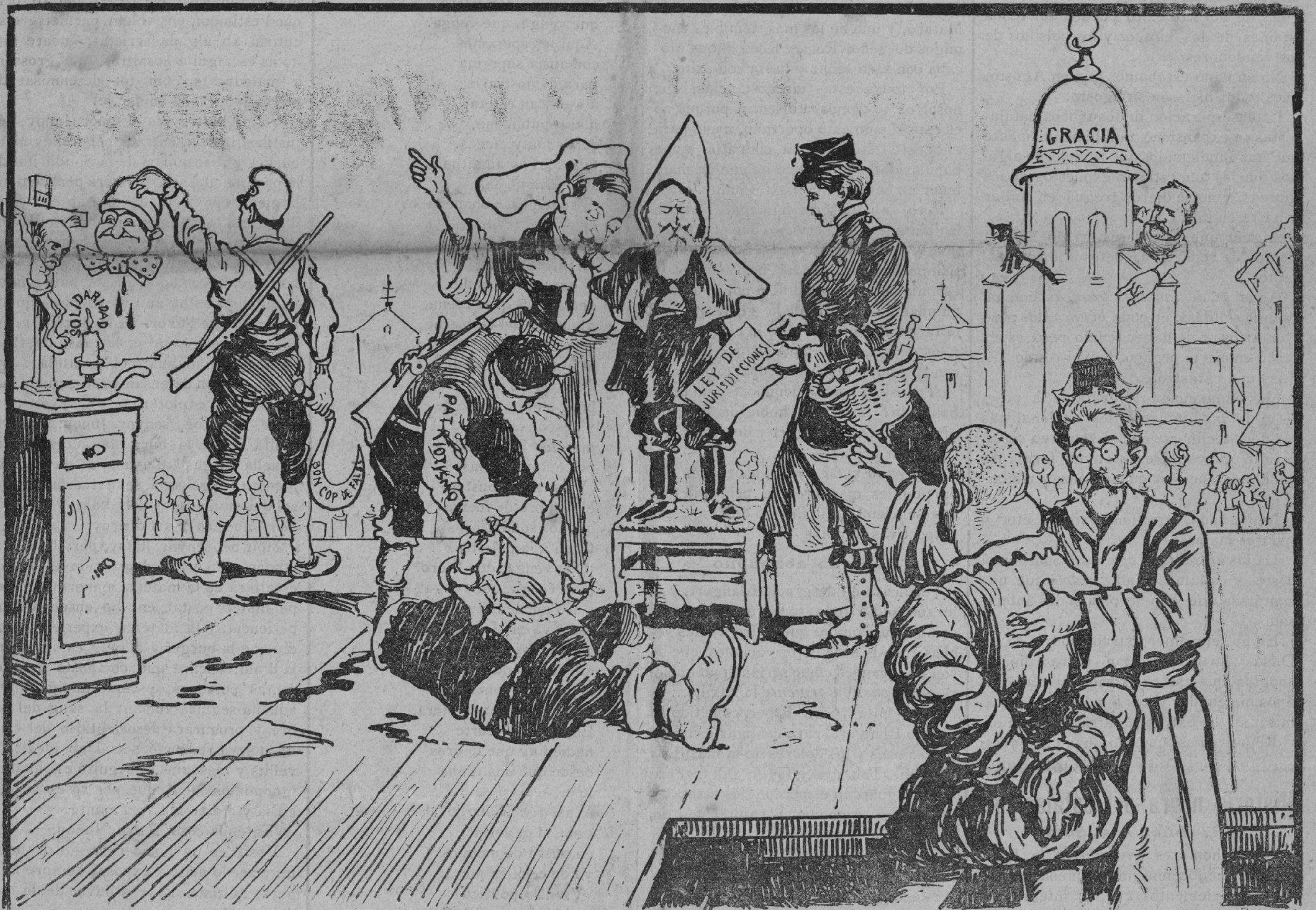
(Parodia del célebre cuadro de Gisbert, «Los Comunereros de Castilla»).

toda idea castellana, y es su nano un mal remedo de Gedeón ... ¡quina barra!... Cataluña, Cataluña, haz limpieza de tu casa, sacude el yugo ridículo de los necios que te engañan,