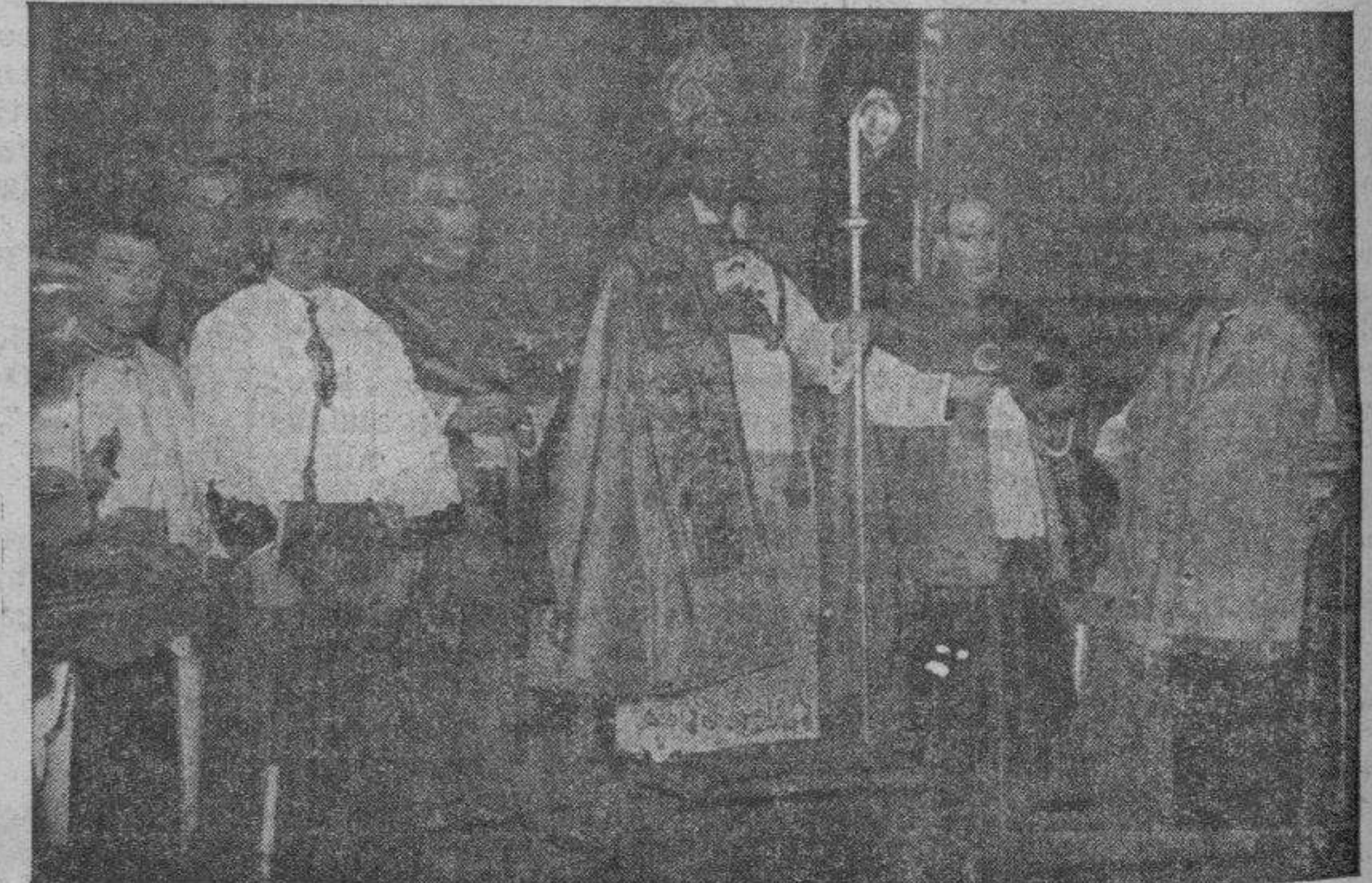
TERUEL.—El prelado, ya con todos sus atributos sagrados, momentos antes de comenzar el besamanos en la catedral