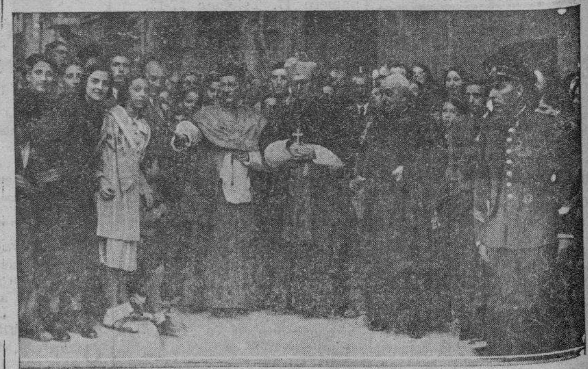
TERUEL.—El nuevo obispo de la diócesis, al llegar ante la catedral para la ceremonia del revestimiento, es rodeado por el público que le aclama