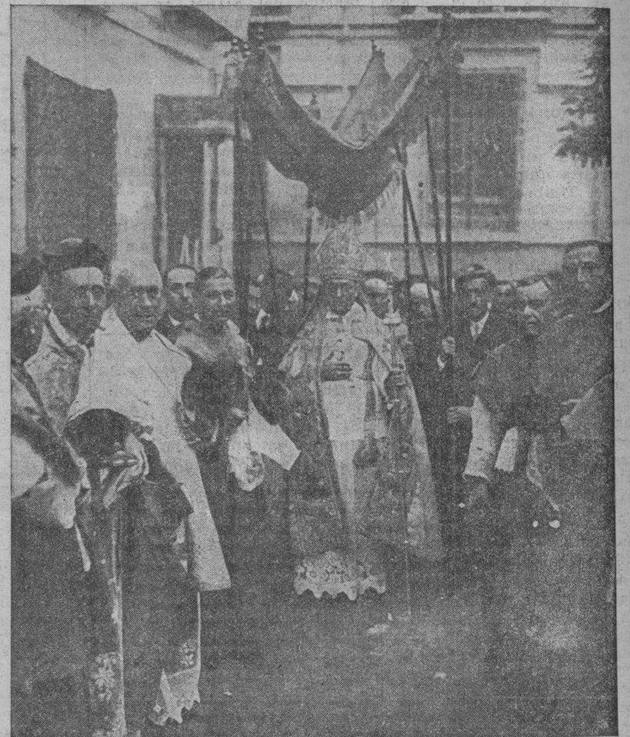
TERUEL.—El reverendísimo señor don Anselmo Polanco disponiéndose a entrar en la catedral bajo palio

Y lo hacemos público, a ruego de la Inspección de Primera Enseñanza, para el debido cumplimiento de la orden citada en todas las escuelas nacionales de la provincia.