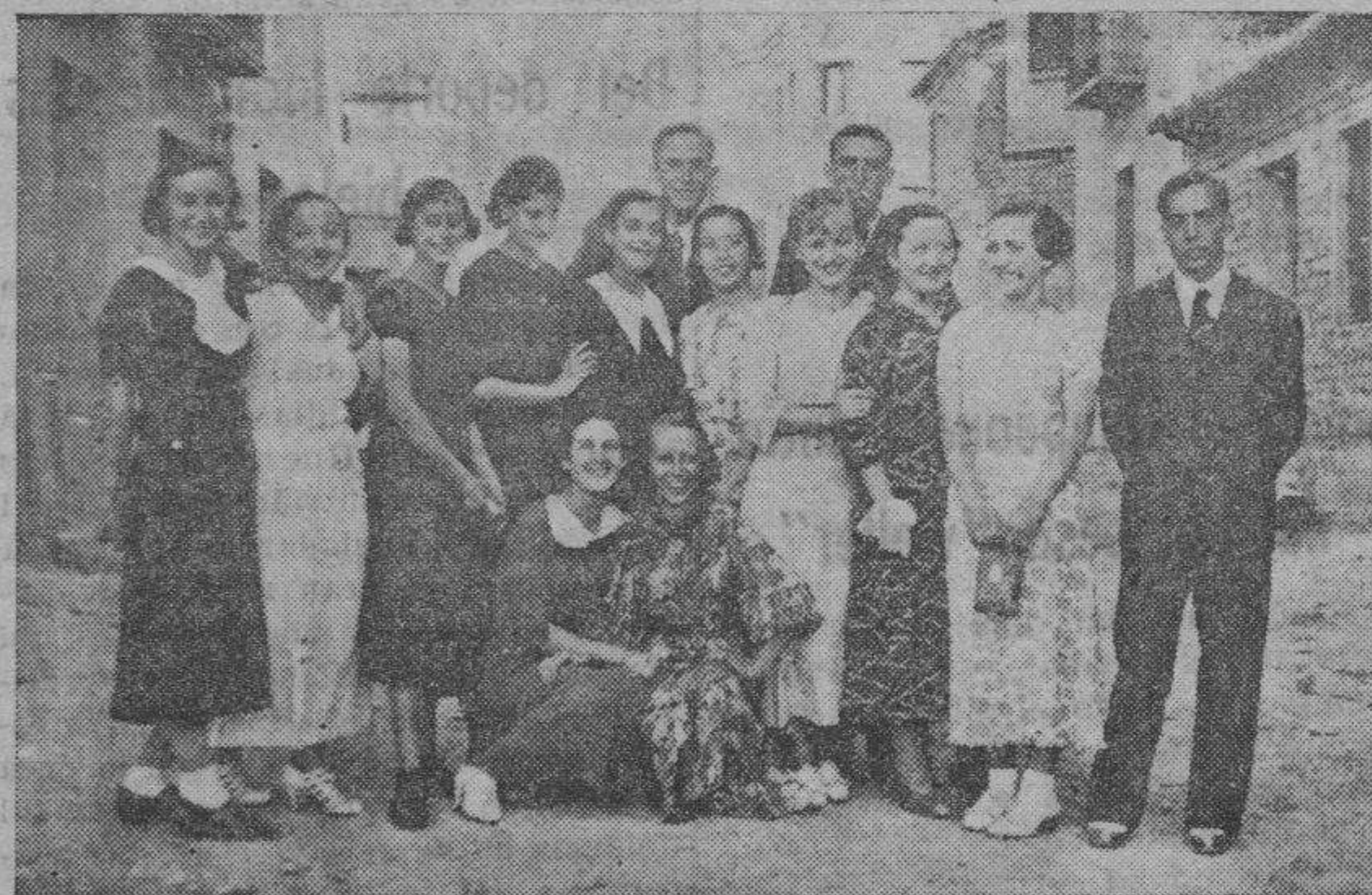
MORATA DE JALON. — Grupo de bellísimas señoritas que fueron uno de los más encantadores alicientes de las fiestas celebradas en este pueblo

"La Dolorosa", selección (a petición), Serrano.