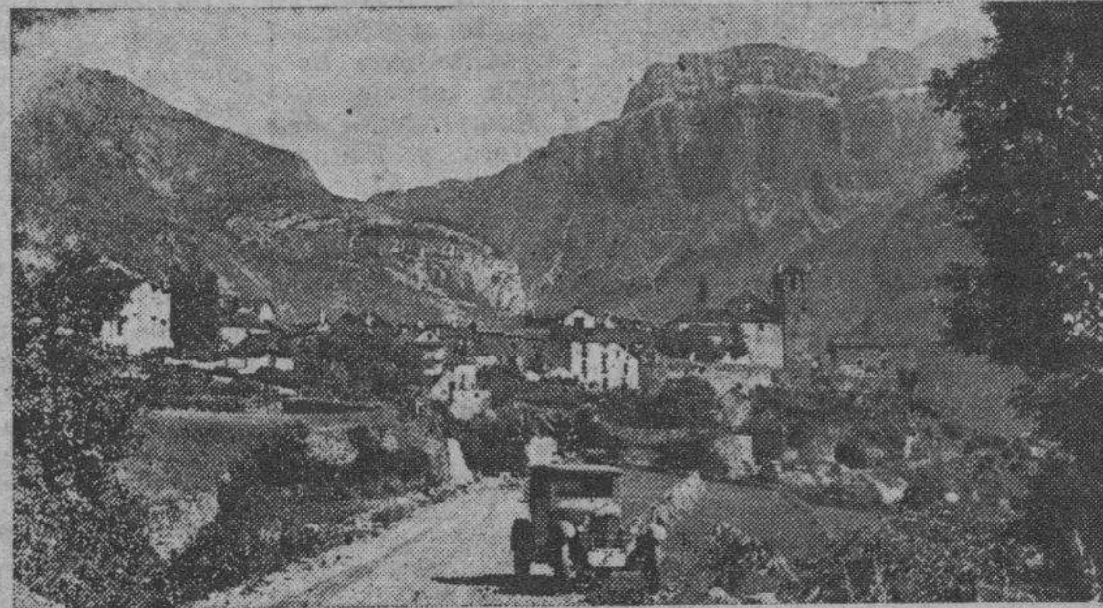
La carretera desde Torla hacia el hermoso valle, transitada ya por los primeros automóviles que este año han acudido al Parque Nacional

Sólo de este nuevo júbilo de descubrimientos quedarán algunos descontentos y aislados. Serán aquellos primeros visitantes de Ordesa que, mochila al hombro, buscaban soladad en el apartado Valle, y que ahora tendrán que huir hacia las alturas próximas, donde quedan nevados que recuerdan aquella época gla-