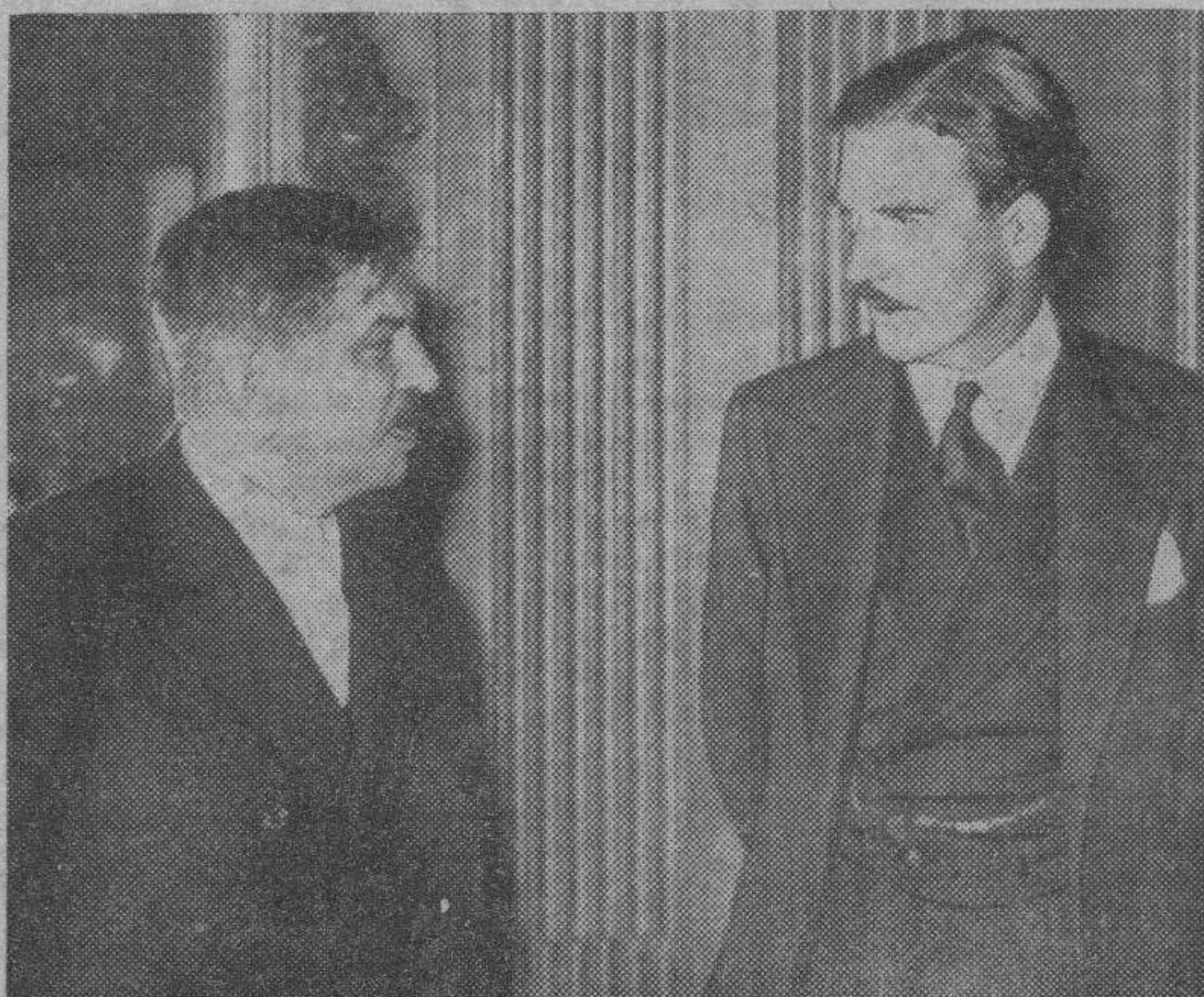
Enen y Lavai nan tratado detenidamente el asunto italo-abisinio, habiendo tomado acuerdos importantes de los que, al parecer, Italia hace poco caso

Si cuanto venimos diciendo honra la seriedad de los reyes de entonces, otros hechos comunes en aquellos tiempos indican en cuán poca esti-