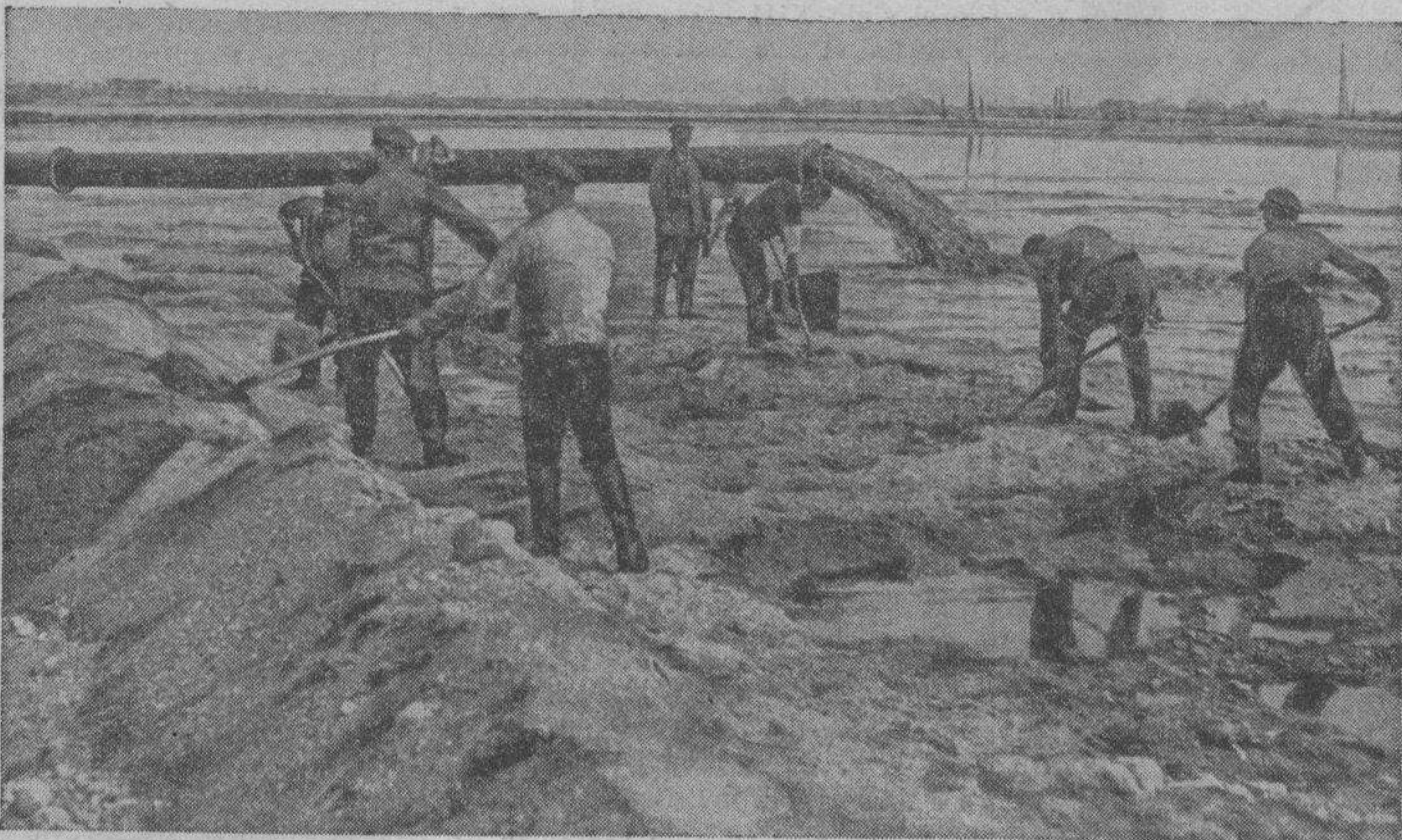
La región alemana de Rugen, litoral del Báltico, prosigue sus trabajos en relación con la desecación de terrenos para dedicarlos al cultivo intensivo de productos agrícolas. Estos obreros, siguiendo el procedimiento holandés, arrebatán tierras al mar, lentamente pero con efectividad que ha de traducirse, con el tiempo, en eficaz surgimiento de tierras ricas en substancias nitrogenadas.

El Juzgado, noticioso de la ocurrencia, se personó en el benéfico establecimiento y, tras tomar declaraciones a los compañeros del muerto, ordenó el traslado de éste al depósito judicial.