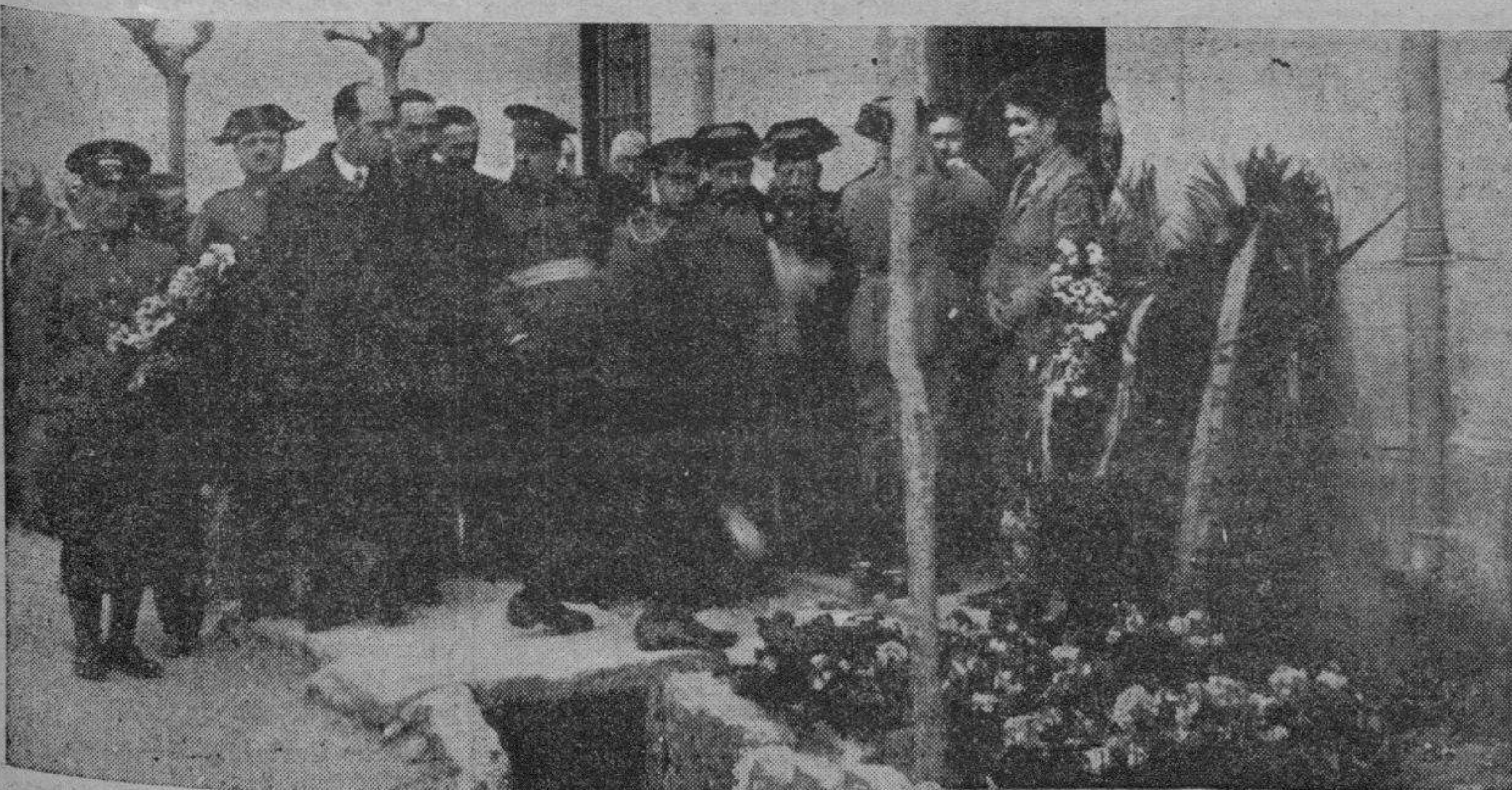
En el lugar donde cayeron muertos los defensores del cuartel fueron depositadas por las autoridades coronas y ramos de flores.