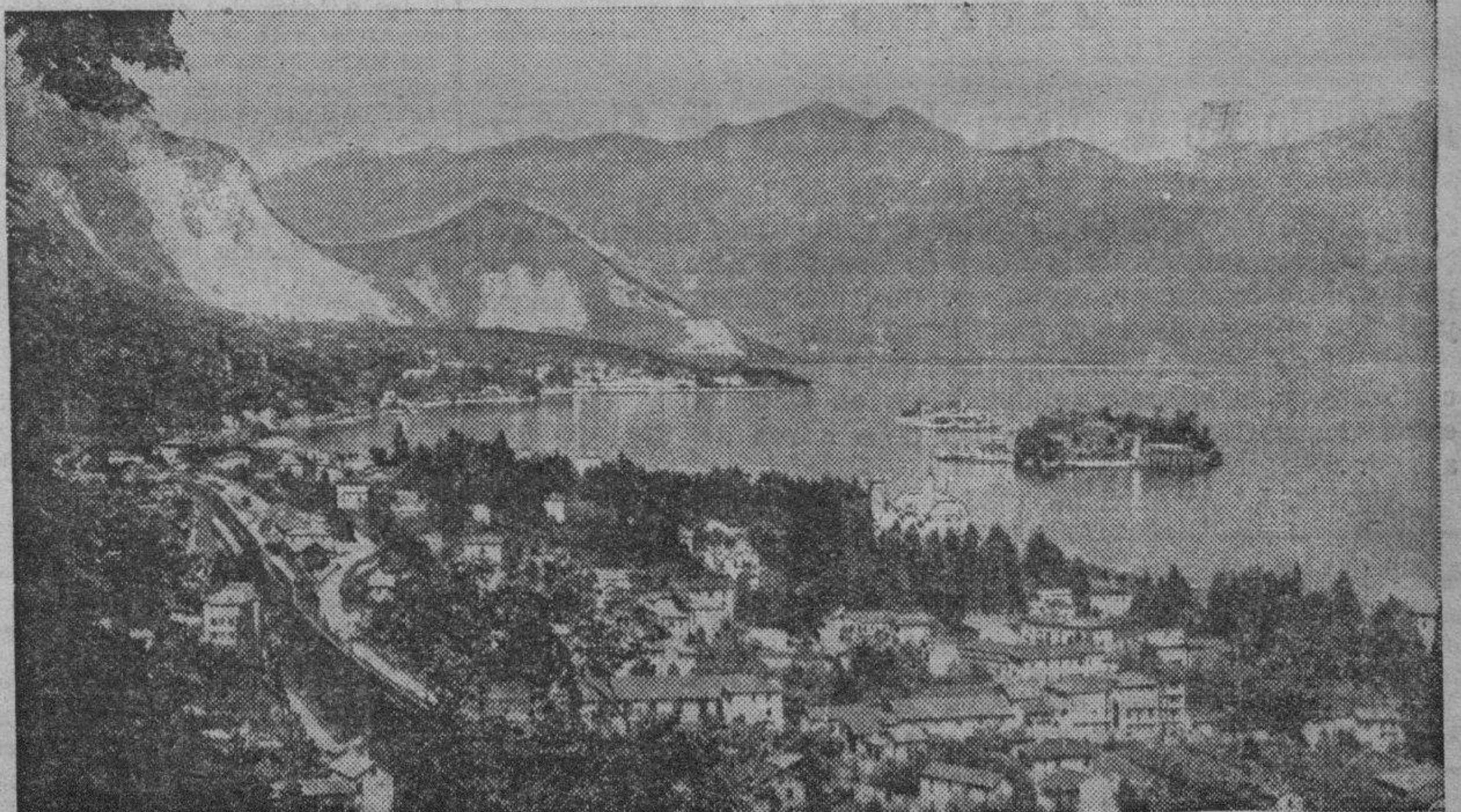
POLITICA INTERNACIONAL. — Pequeña isla, en el Lago Maggiore, al Norte de Italia, donde, el día 11 del actual, se reunirán las delegaciones británica, francesa e italiana, para conferenciar sobre el futuro inmediato de la política europea, dada la actitud de Alemania.

Los comisionados aragoneses entienden preciso el que los cultivadores dirijan telegramas al nuevo ministro de Agricultura pidiendo la urgente resolución del problema que tan hondamente está afectando a la economía aragonesa.