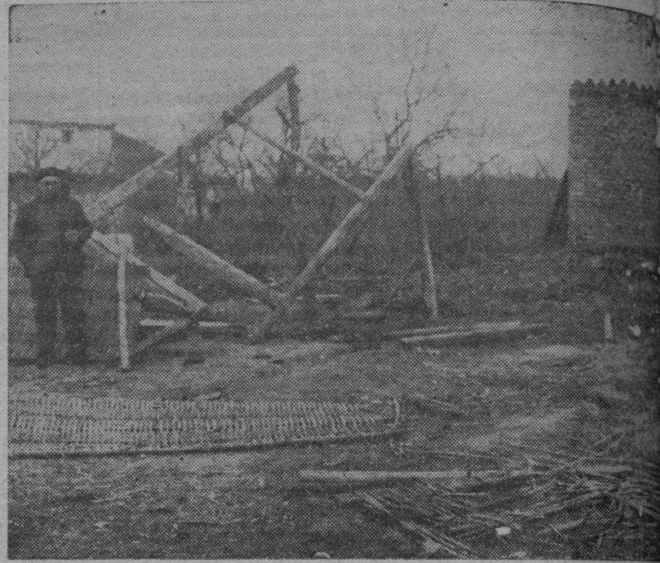
He aquí lo que quedó del taller de pirotecnia. Un montón de escombros, bajo los que aparecieron las víctimas del trágico suceso.