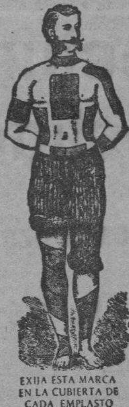
EXIJA ESTA MARCA EN LA CUBIERTA DE CADA EEMPLASTO

para que Vd. se cure. Sus efectos son definitivos contra catarros, gripe, dolores de costado, de riñones, reuma, ciático, lumbago, etc.