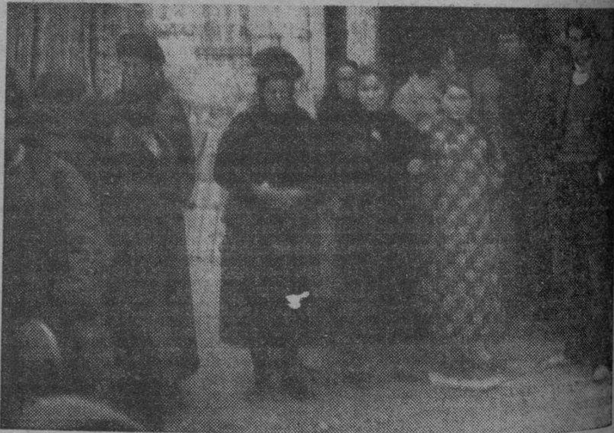
El vecindario de Montañana, bajo el peso de la tragedia, momentos después de la horrible catástrofe.