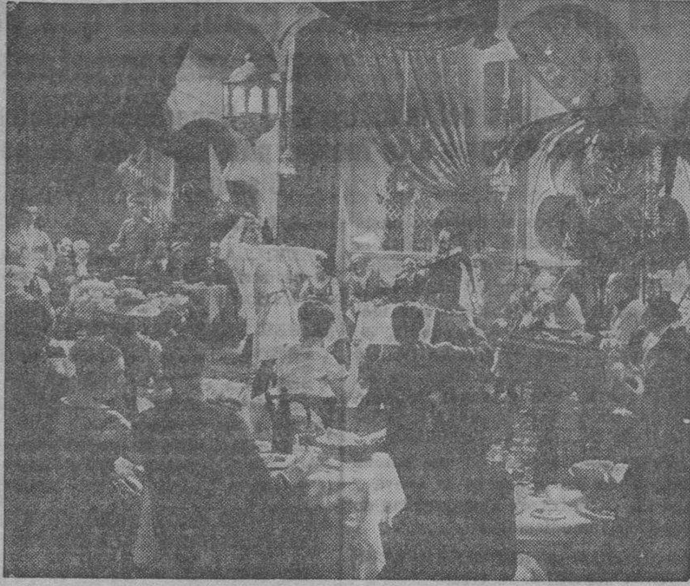
La célebre Orquesta Rodé, con Harry Baur y otras destacadas figuras, intérpretes de la película "Noches moscovitas".

Deseamos al joven artista los mejores éxitos.