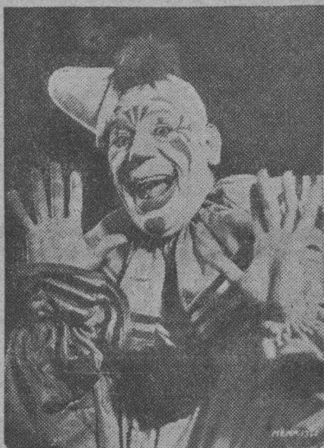
Dediquemos un recuerdo a Lon Chaney, el gran actor que con tan admirable justeza interpretó "El que recibe la bofetada".

lícula de más interés y emoción de las estrenadas en la actual temporada estival y que todo Zaragoza admirará, complacida, las indescriptibles bellezas de este sorprendente film. Hoy se proyectará la versión original, dialogada en francés, con los precios populares de verano: butaca, una peseta; sillón, una cincuenta.