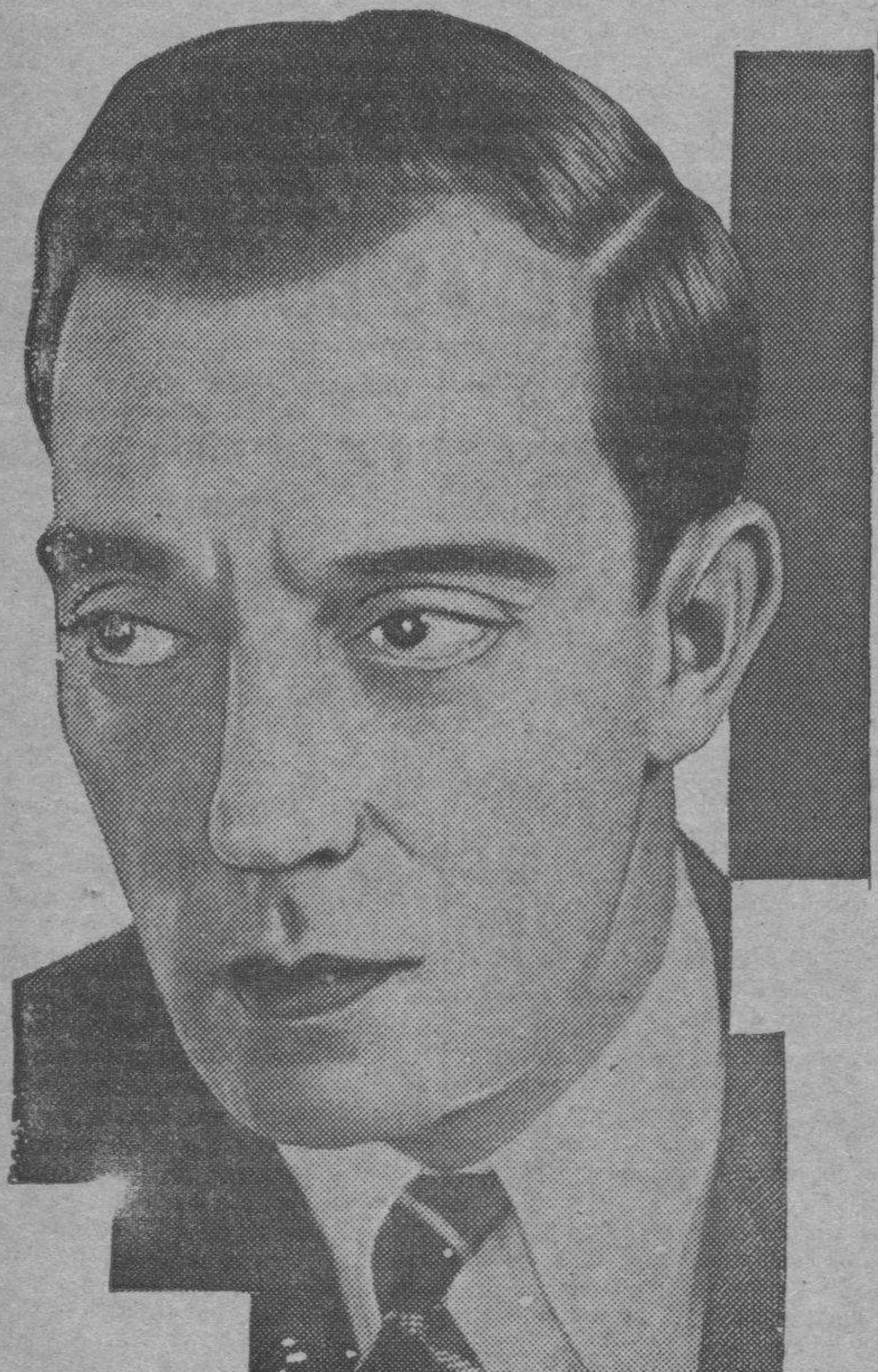
Buster Keaton sufre también la consecuencia de esta furia invasora de las operetas.