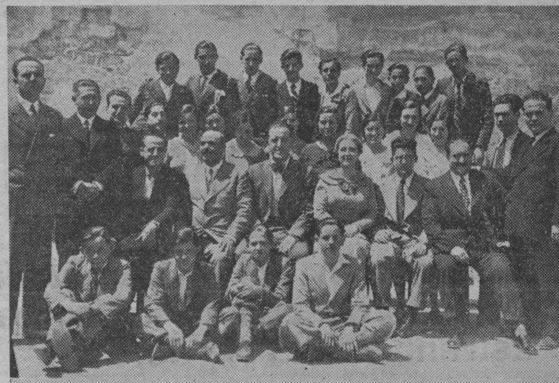
CALAHORRA. — Los nuevos y primeros bachilleres salidos de este Instituto de Segunda Enseñanza, rodeando a sus profesores después del banquete de despedida.