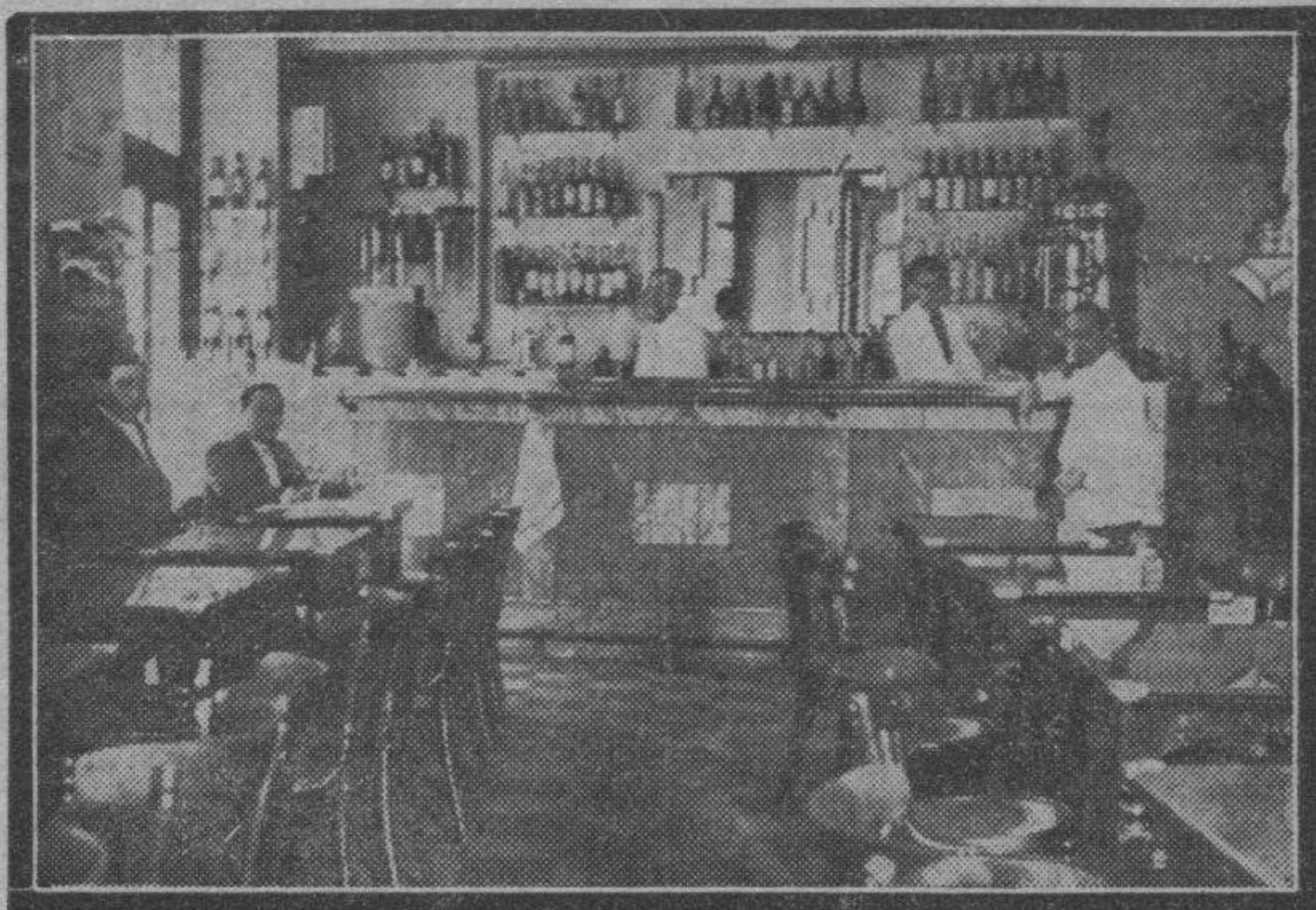
Un aspecto del moderno y bien surtido mostrador del popular BAR "EL RHIN", de la calle Cinco de Marzo.