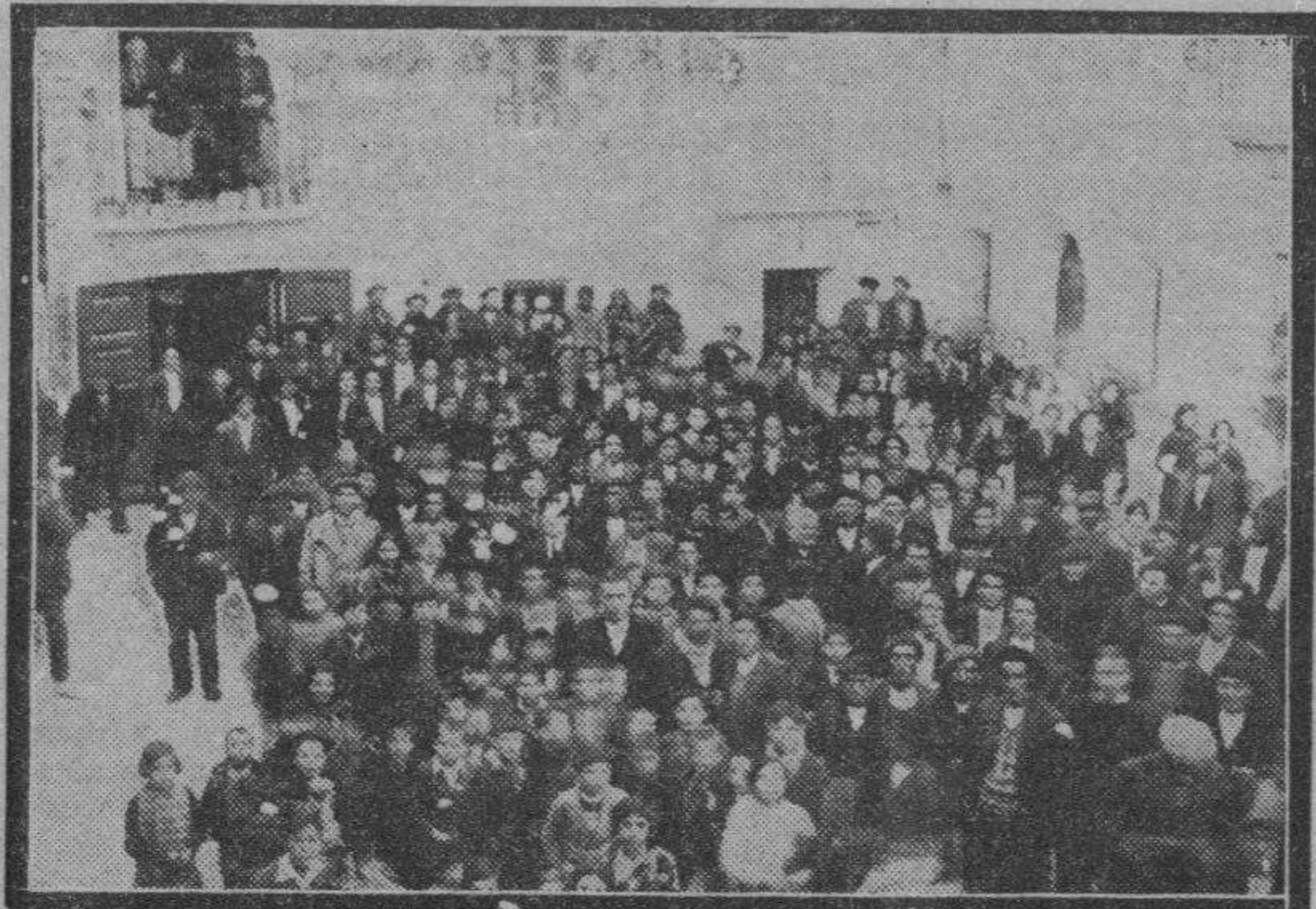
El vecindario de Muel, ante el Ayuntamiento, oyendo la palabra de las autoridades.

La dueña renunció a los perjuicios, y como los daños se produjeron sin intención, el fiscal, señor Lafuente, retiró la acusación que tenía formulada contra el pobre hombre, que se llevó el "banquillo" donde había permanecido durante todo el juicio.