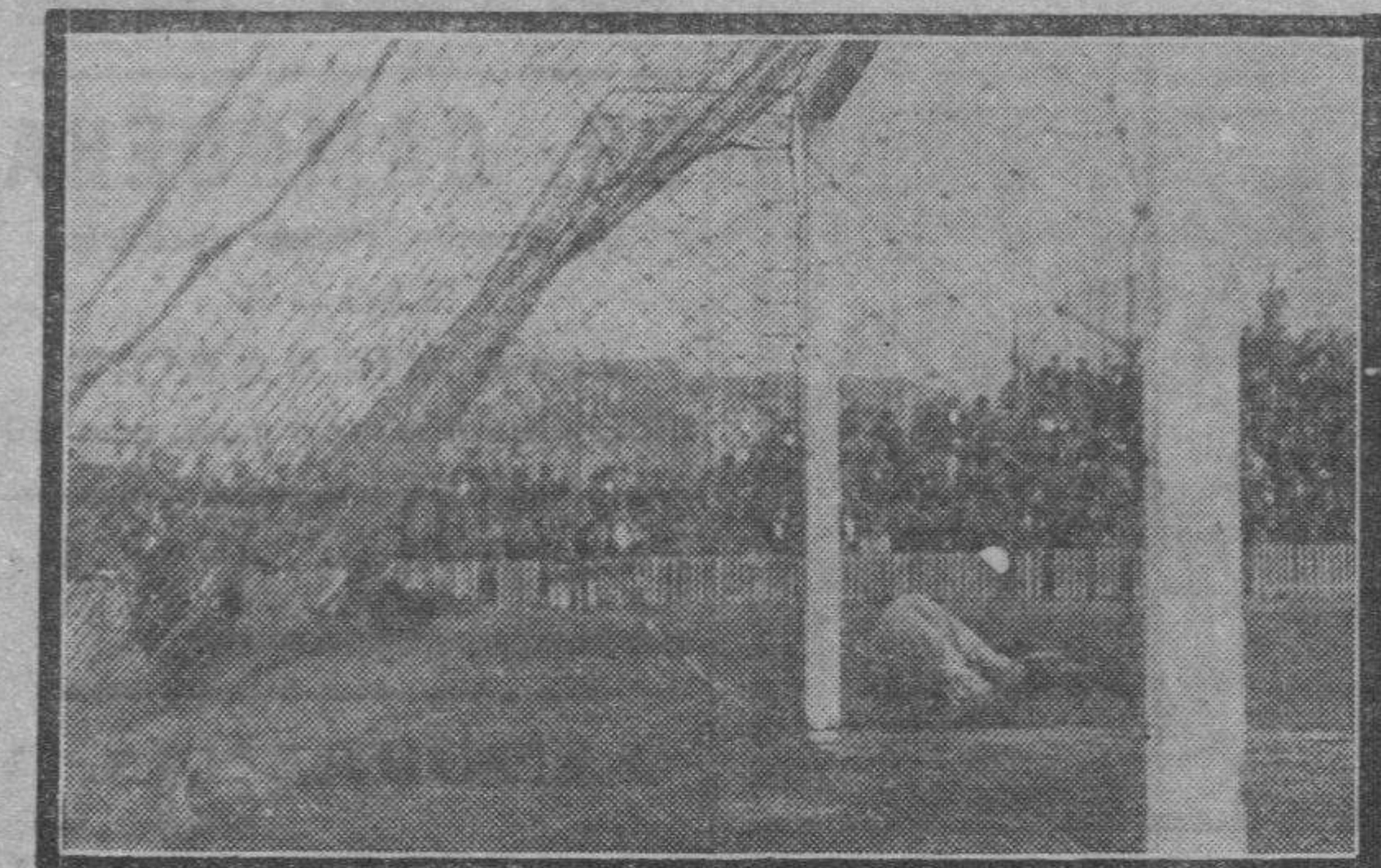
Uno de los tantos marcados por el Athlétic al Zaragoza, en San Mamés.