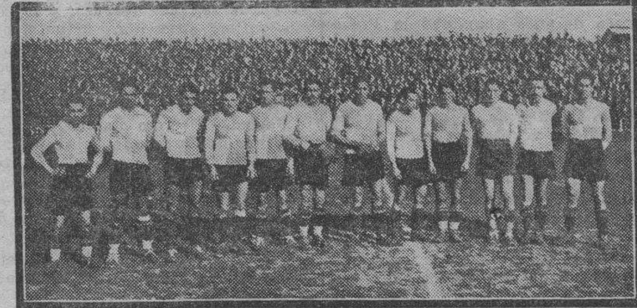
El Oviedo, el Sabadell, debutantes, mañana, en las divisiones de Liga primera y segunda, respectivamente.

En esta última parte se tiró un penalty contra el Alagón, lanzado fuera intencionadamente.