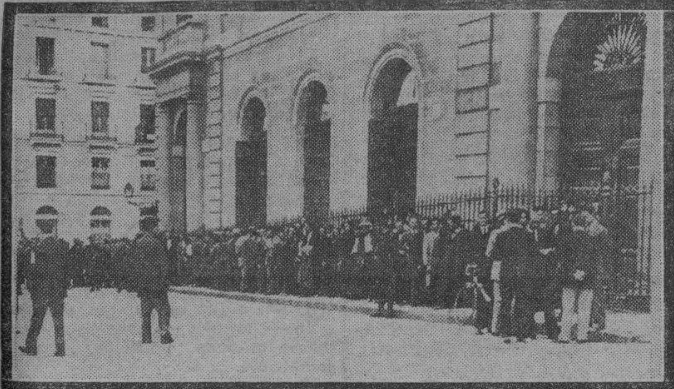
La expectación que la presentación a las Cortes del Gobierno Lerroux había producido se advierte en las "colas" formadas para entrar en el Congreso.

Observe usted en la calle el periódico predilecto de la juventud. Comprobará que toda la gente joven lee LA VOZ DE ARAGON