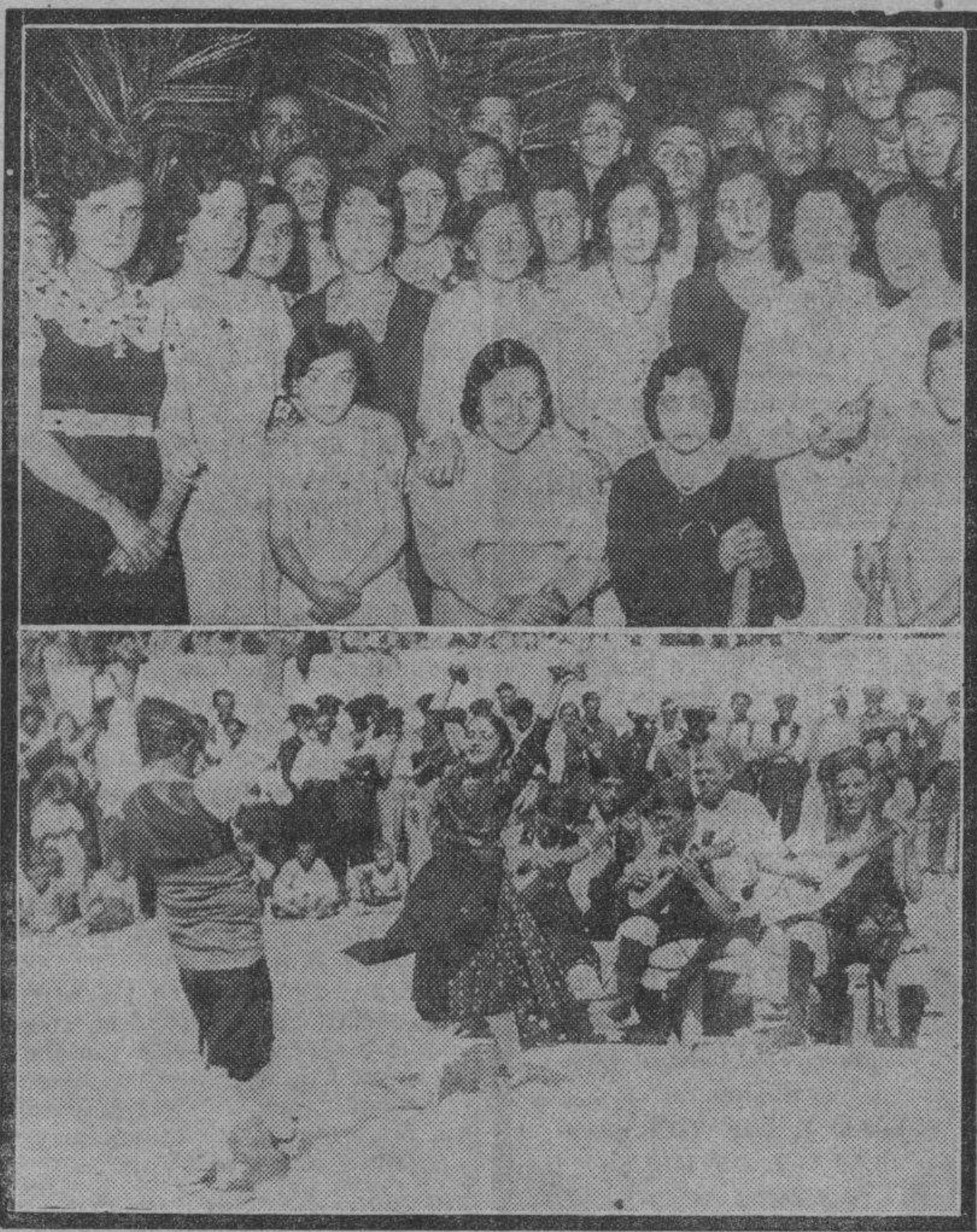
CARINENA y EPILA. — Arriba y abajo, respectivamente, un grupo de gente joven que ha dado extraordinario realce a las pasadas fiestas patronales de Carinena, y un interesante momento de la Fiesta-Homenaje a la Vejez celebrada en Epila con gran brillantez recientemente, festejo en el que tomaron parte valiosos elementos cultivadores de nuestro canto regional.

La sastrería "La Confianza" nos remite asimismo una tarjeta con una tricromía alegórica de la Jota y en el reverso el detalle de las fiestas del Pilar. Editada primorosamente en la imprenta Uriarte.