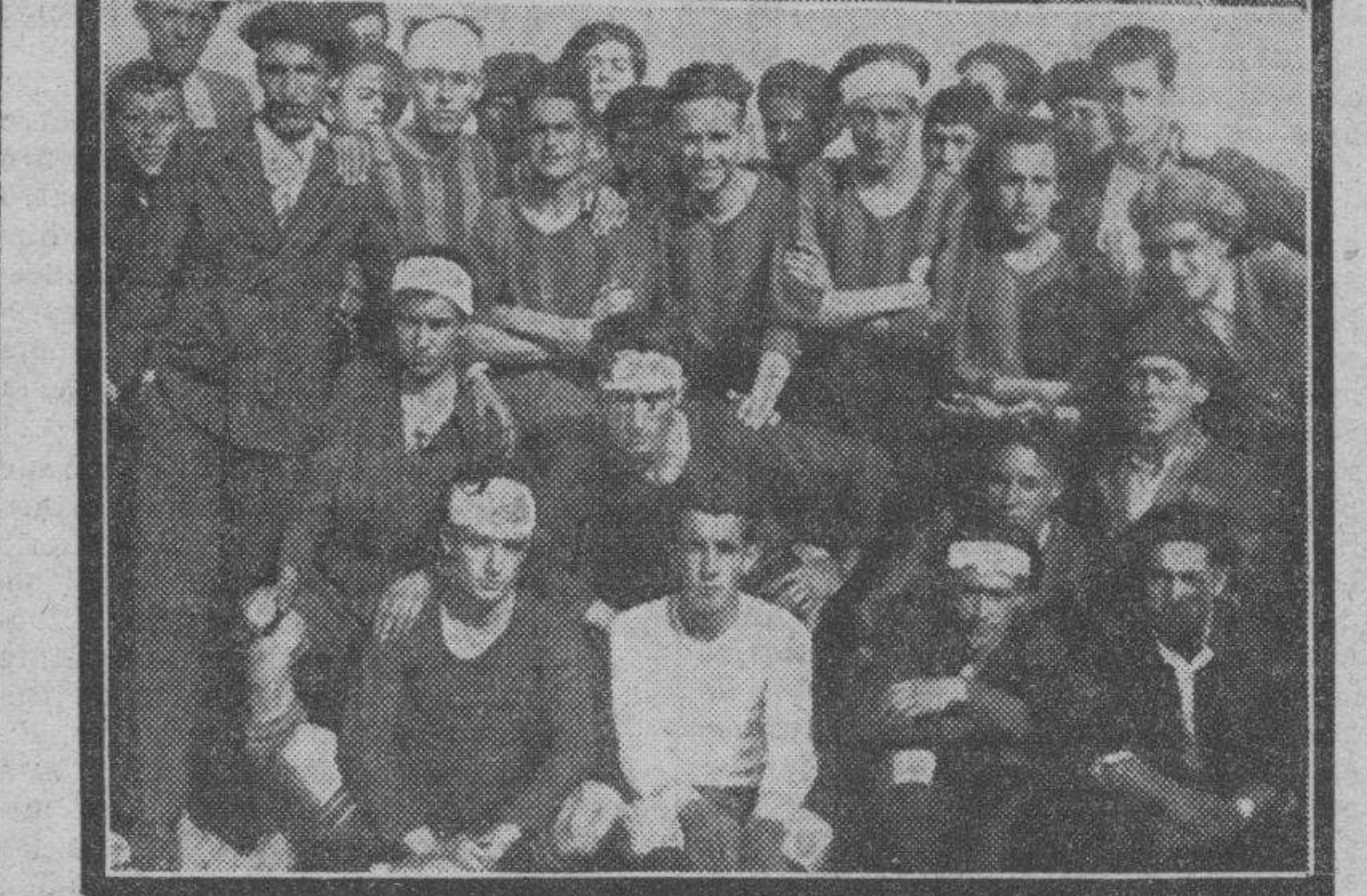
EL FUTBOL EN LOS PUEBLOS.—Equipos del Alagón F. C. y del U. D. Casetas, que jugaron un interesante encuentro, venciendo el primero por amplio margen.