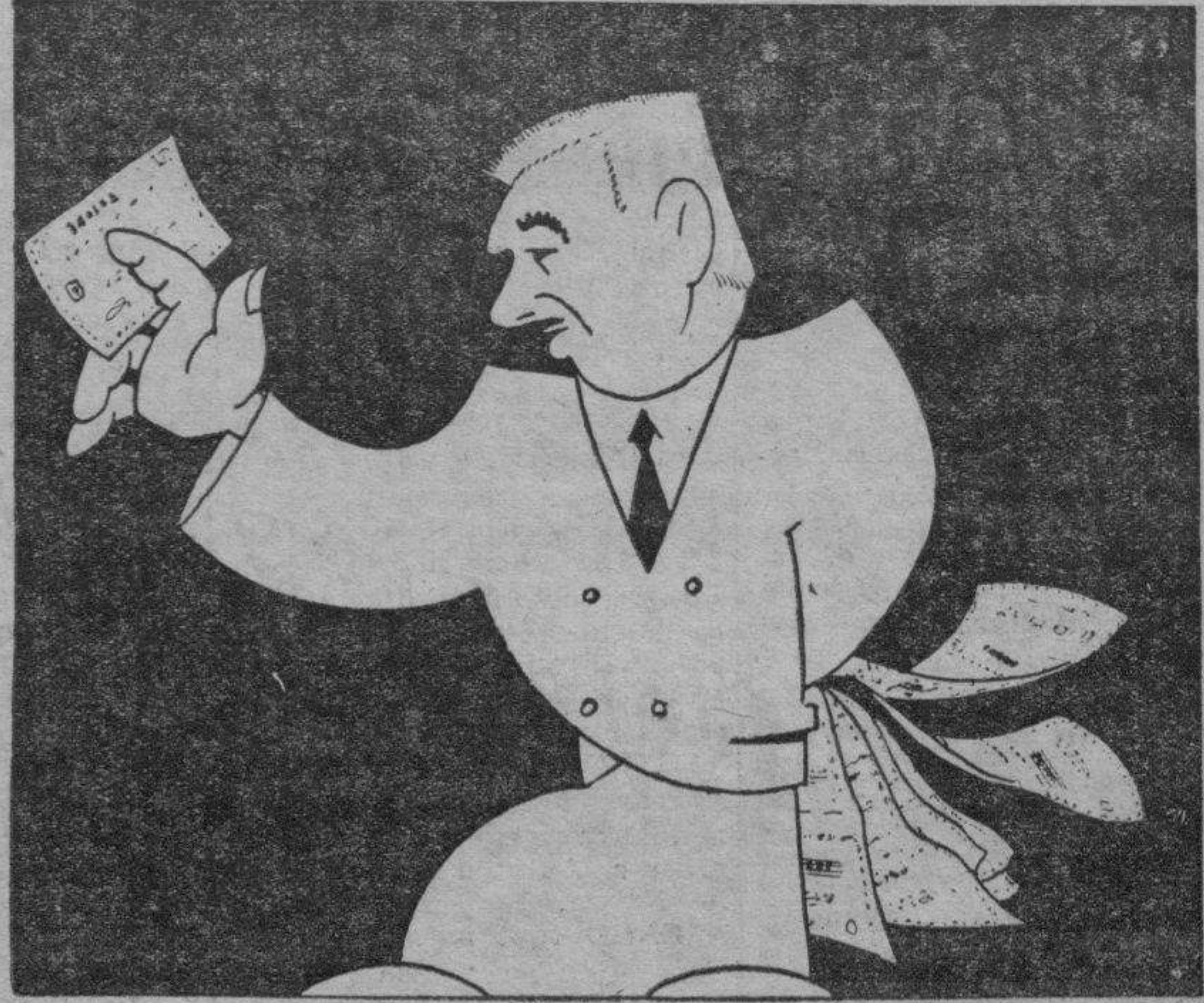
¡Animo, señores! ¡El último que me queda para el sorteo de Navidad!