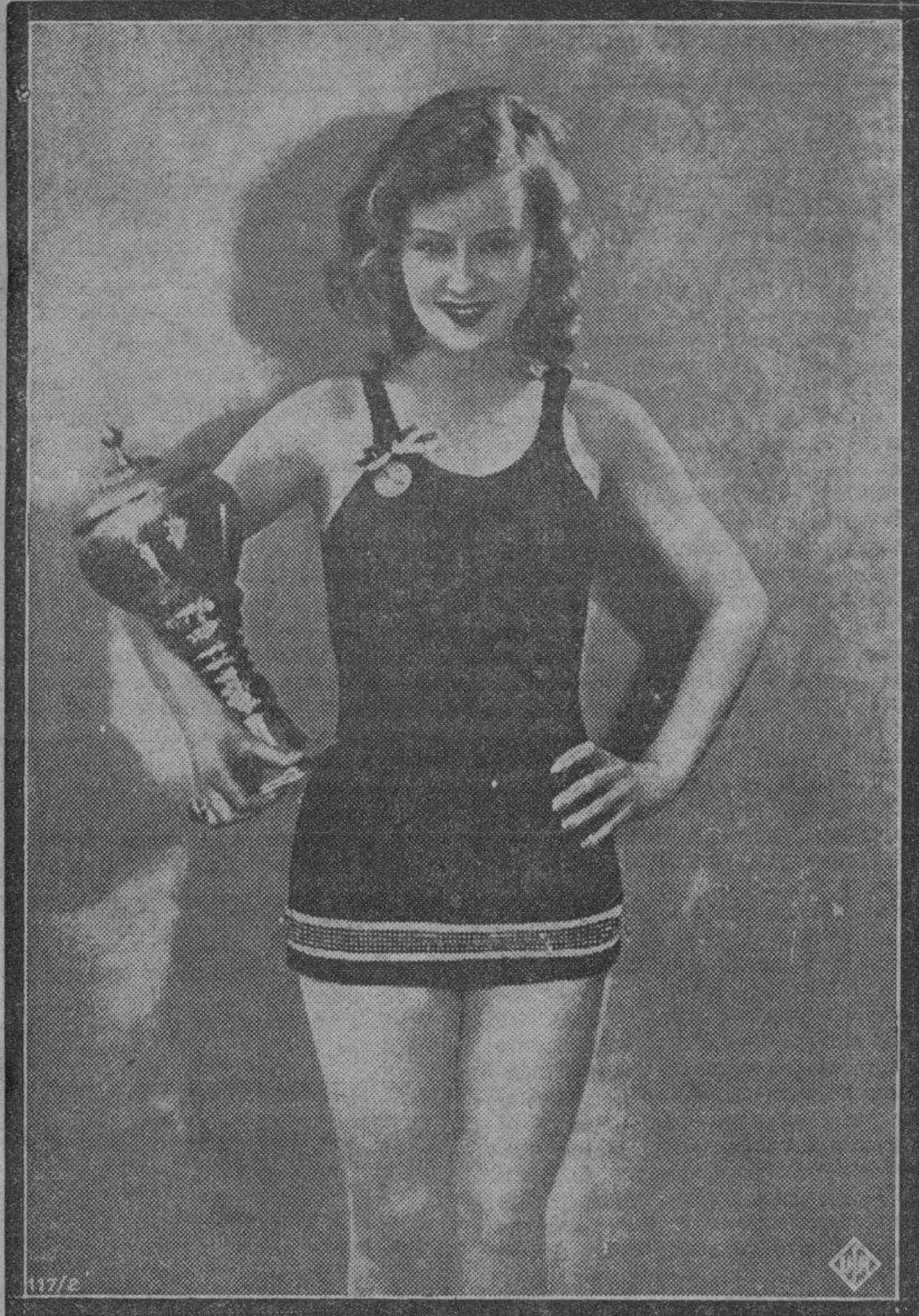
Lilian Harvey nos muestra el trofeo ganado en las últimas pruebas de natación celebradas en Berlín, poco antes de que la inimitable intérprete de "El trió de la bencina" pensara en marchar a Hollywood.

Sí, señores; Lilian Elen Muriel Harvey, la inglesita rubia diminuta, de cuerpo frágil, elegante y bien formado, que posee unas soberbias pantorrillas, que baila como los propios ángeles —suponiendo que estos seres, caso de existir, lo hagan— y que no sabe cantar aunque ella lo pretendió algunas veces sin éxito, es la única mujer inglesa que sabe besar. Porque habéis de saber, que las mujeres inglesas saben jugar maravillosamente al tenis, confeccionan pasteles y dulces exquisitos, llevan sombreros enormes cargados de frutas, flores y pájaros disecados, usan gafas aunque no las necesiten y viajan como turistas por España en época de Semana Santa. Pero sus conocimientos son relativamente escasos aunque presuman mucho de intelectuales. No saben amar ni mucho menos dar un beso con arte, salero y sensualidad.