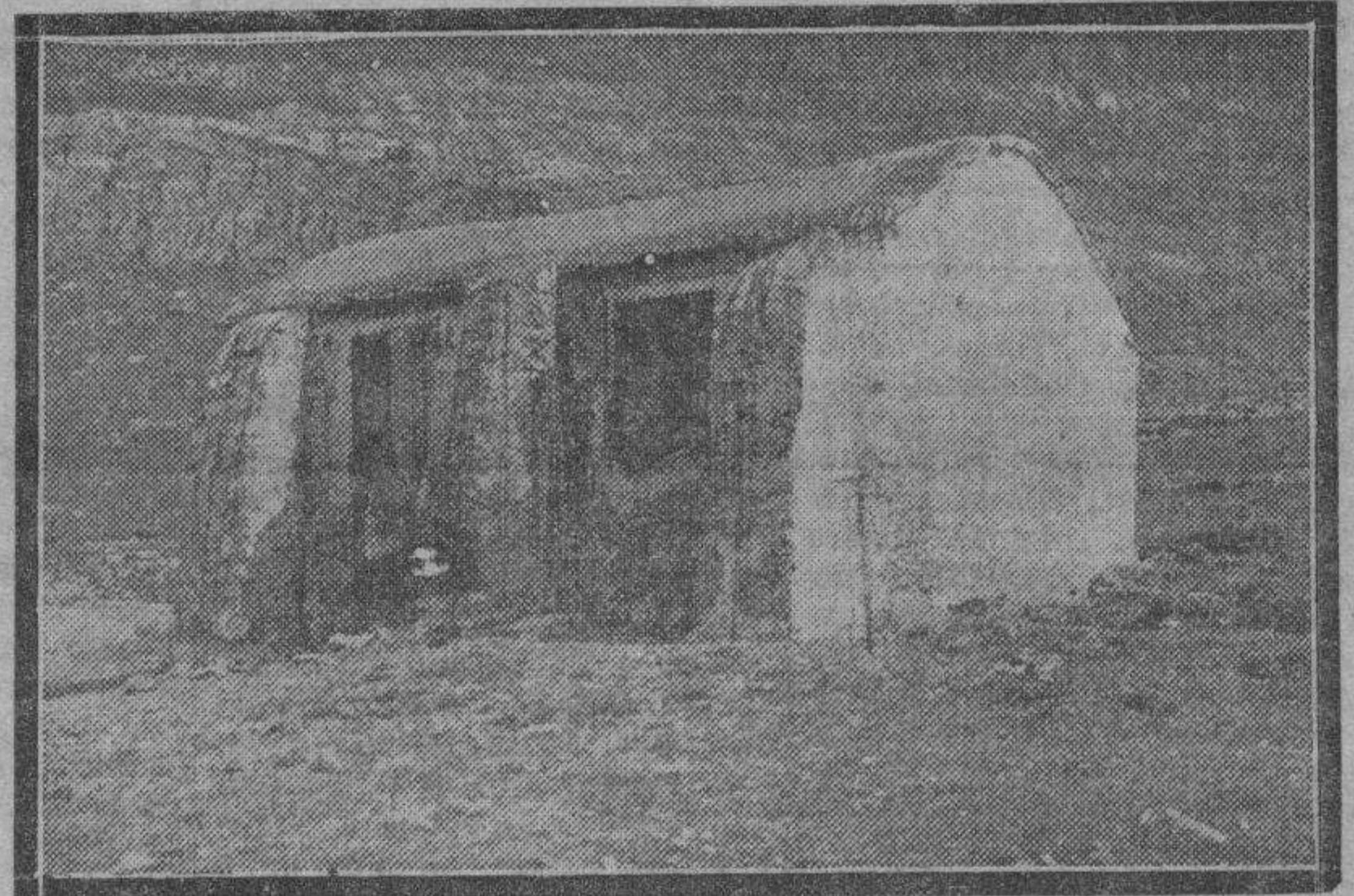
Un refugio de montaña, enclavado en el Pirineo aragonés, y base de excursiones interesantes. La estructura del edificio es a propósito para defender al excursionista de los rigores invernales. Dentro, la comodidad está en la cantidad que el huésped quiere tomarse.

El Juzgado se personó en el lugar del suceso, practicando las diligencias correspondientes para averiguar lo sucedido. Y en la mañana del día de hoy llegaron, con el mismo motivo, los señores juez de instrucción, actuario y médico forense. — P. P. SAENZ.