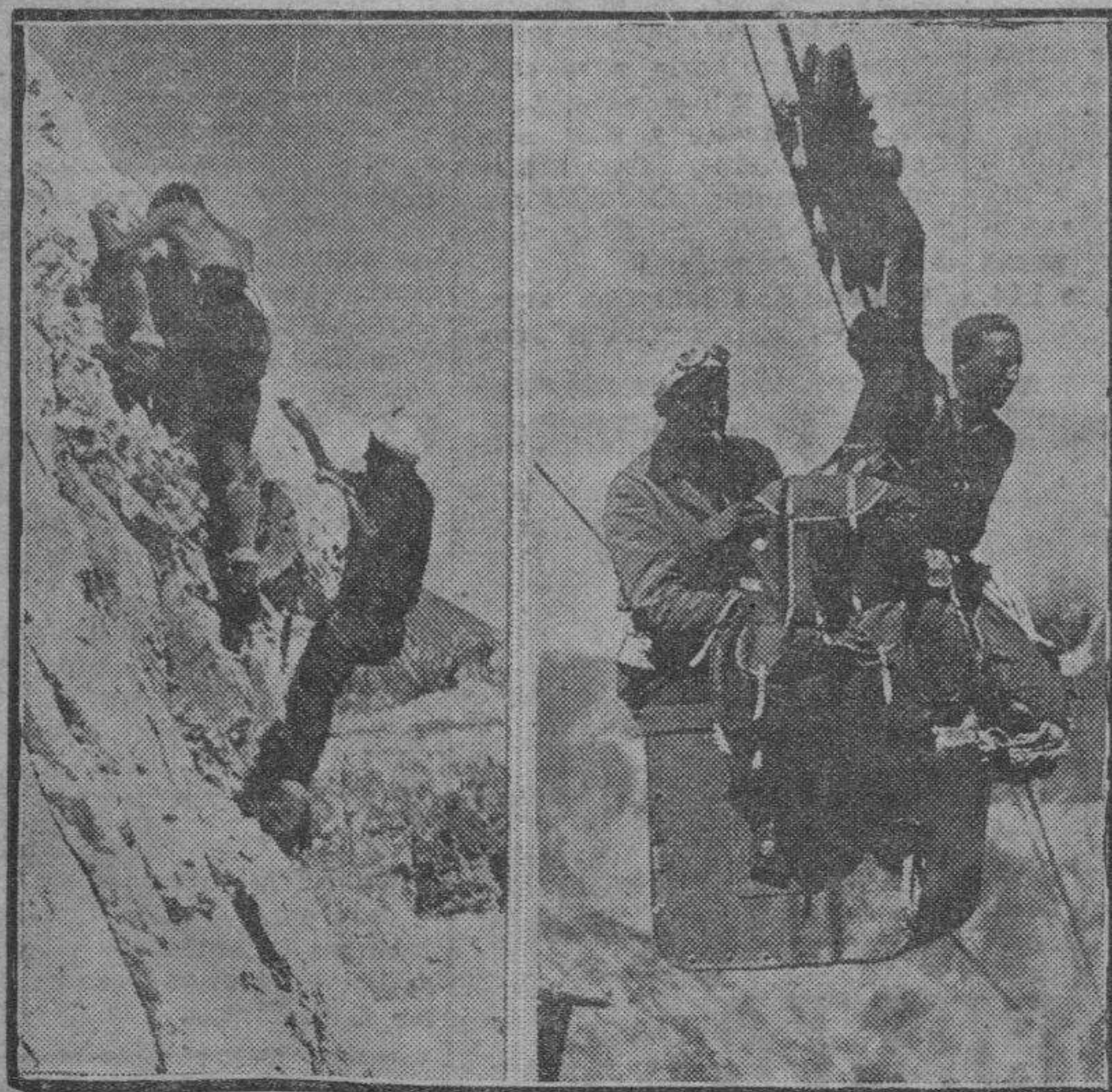
Un momento interesante de la excursión, en el que los montañeros aprovechan una línea de conducción de vagonetas para hacer el viaje a las alturas, desafiando el vértigo. Después vendrán las escaladas penosas, los últimos metros para coronar el pico, en los que hay que sacar todas las energías.