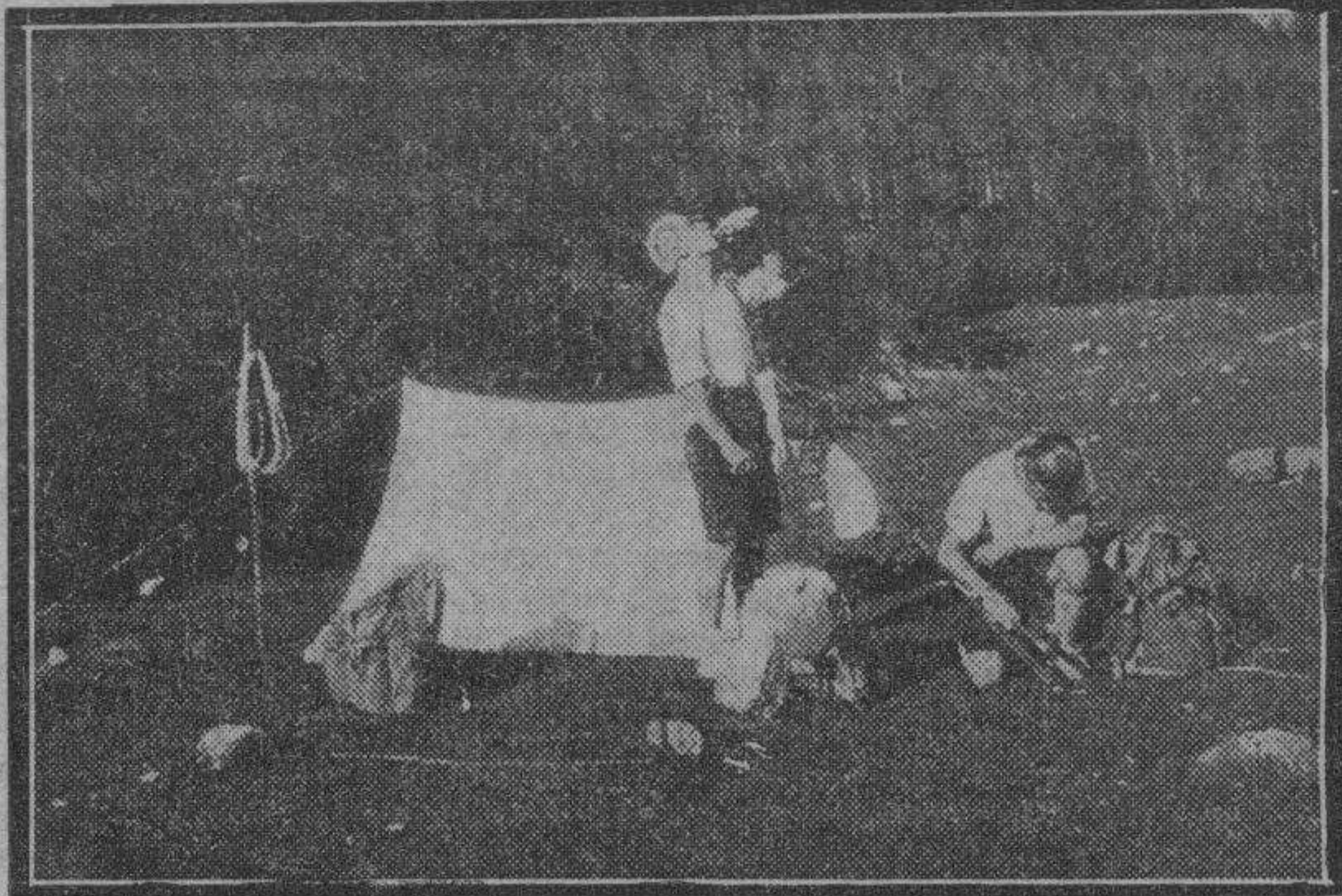
Una acampada en el valle, cuando para realizar travesías de montaña no pueden encontrarse refugios en ruta. Base de excursiones es también el campamento, cuando se enclava en praderas magníficas, en lugares que invitan a la vida al aire libre.

Lo interesante es saber cómo se vive a 3.000 metros, cómo es allí