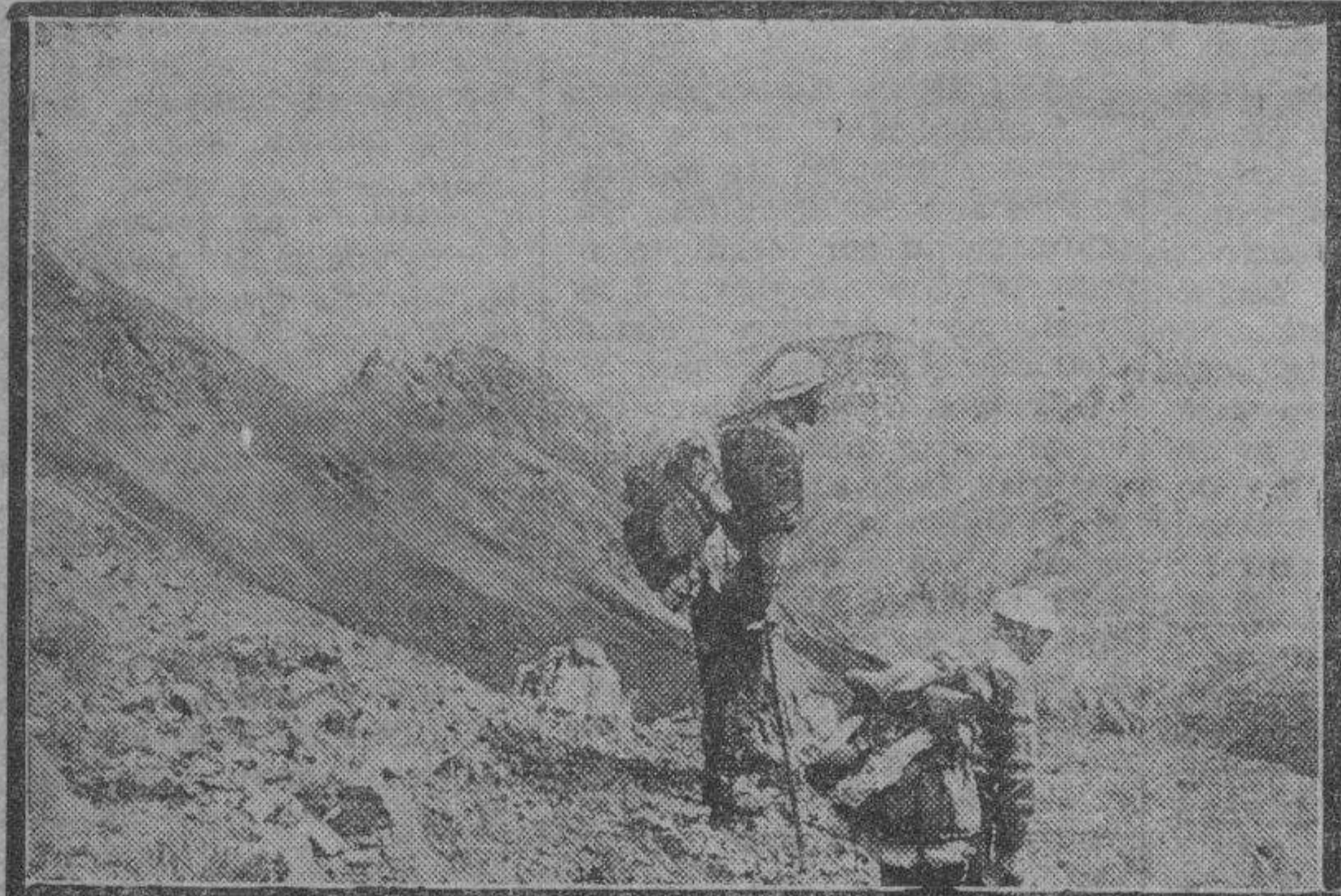
Mirando el valle que queda a sus pies, en un pequeño descanso hacia la cima. Al fondo, y entre neblina, desaparecen los ingentes picos de tres mil metros que es necesario escalar.

Daremos una lista incompleta de picos de esta altura enclavados en