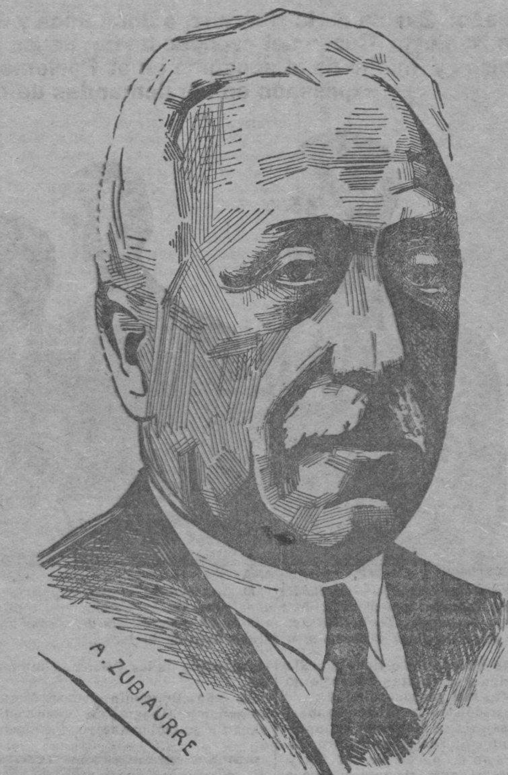
El presidente de la República, don Niceto Alcalá Zamora, que por primera vez ha hecho uso de su benevolente prerrogativa conmutando al general Sanjurjo la pena de muerte por la de cadena perpetua.

LA IMPRESION ERA DE QUE SE ACONSEJABA EL INDULTO Poco después de las siete salió el señor Azaña del Congreso, diciendo que se habían reunido y adoptado un acuerdo, del que iba a dar cuenta al presidente de la República, que estaba en Palacio. La impresión en los pasillos del Congreso era de que se concedería el indulto. EXTRAORDINARIOS DE LOS PERIODICOS En cuanto se tuvo conocimiento oficial de la sentencia algunos periódicos publicaron extraordinarios. "La Libertad" y "Ahora" lanzaron a la calle un número que fué acogido con extraordinaria ansiedad. Cuanto alcanzaba la información fué objeto de comentario apasionado. Por la tarde apareció "La Voz".