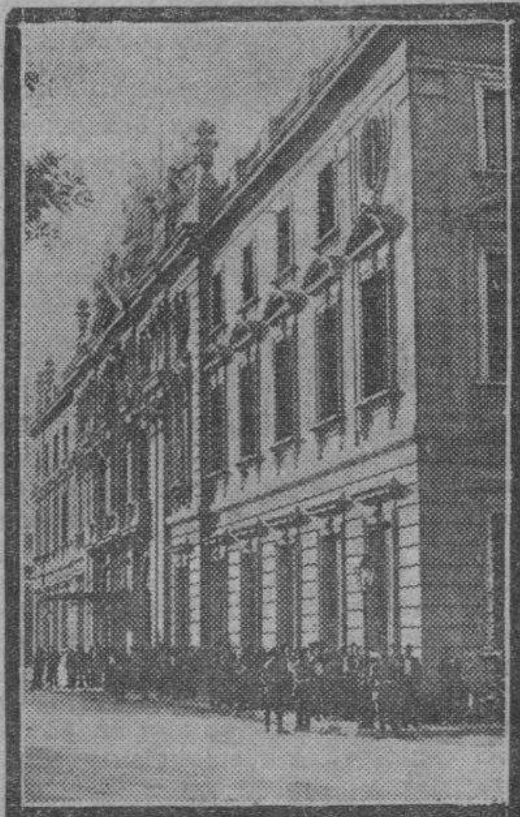
El público aguardando lleno de ansiedad, en las primeras horas de la mañana, a que se abrieran las puertas del Palacio de Justicia.