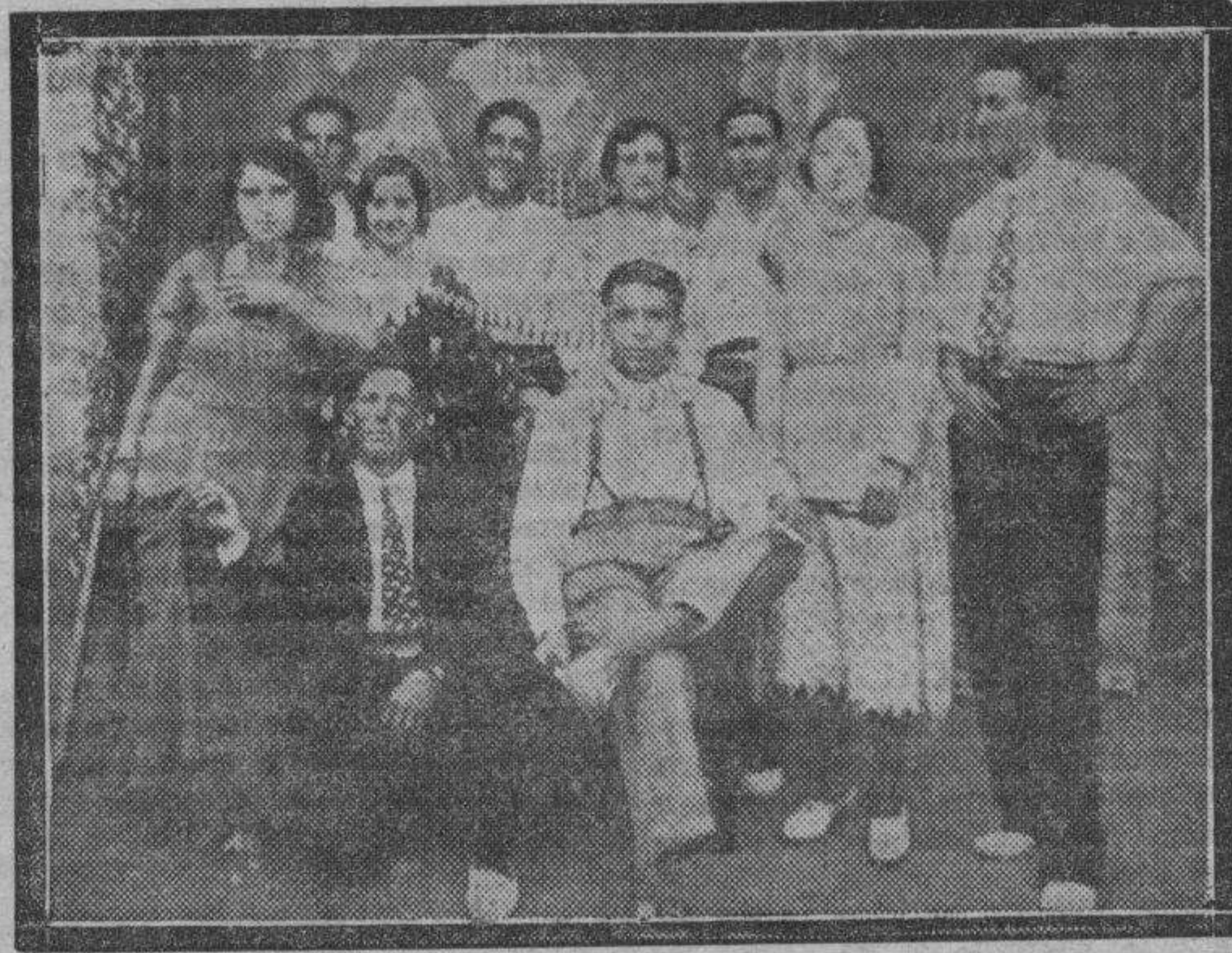
SARVISE.—Grupo de bellas muchachas y distinguidos jóvenes que han dado extraordinario realce a las pasadas fiestas.