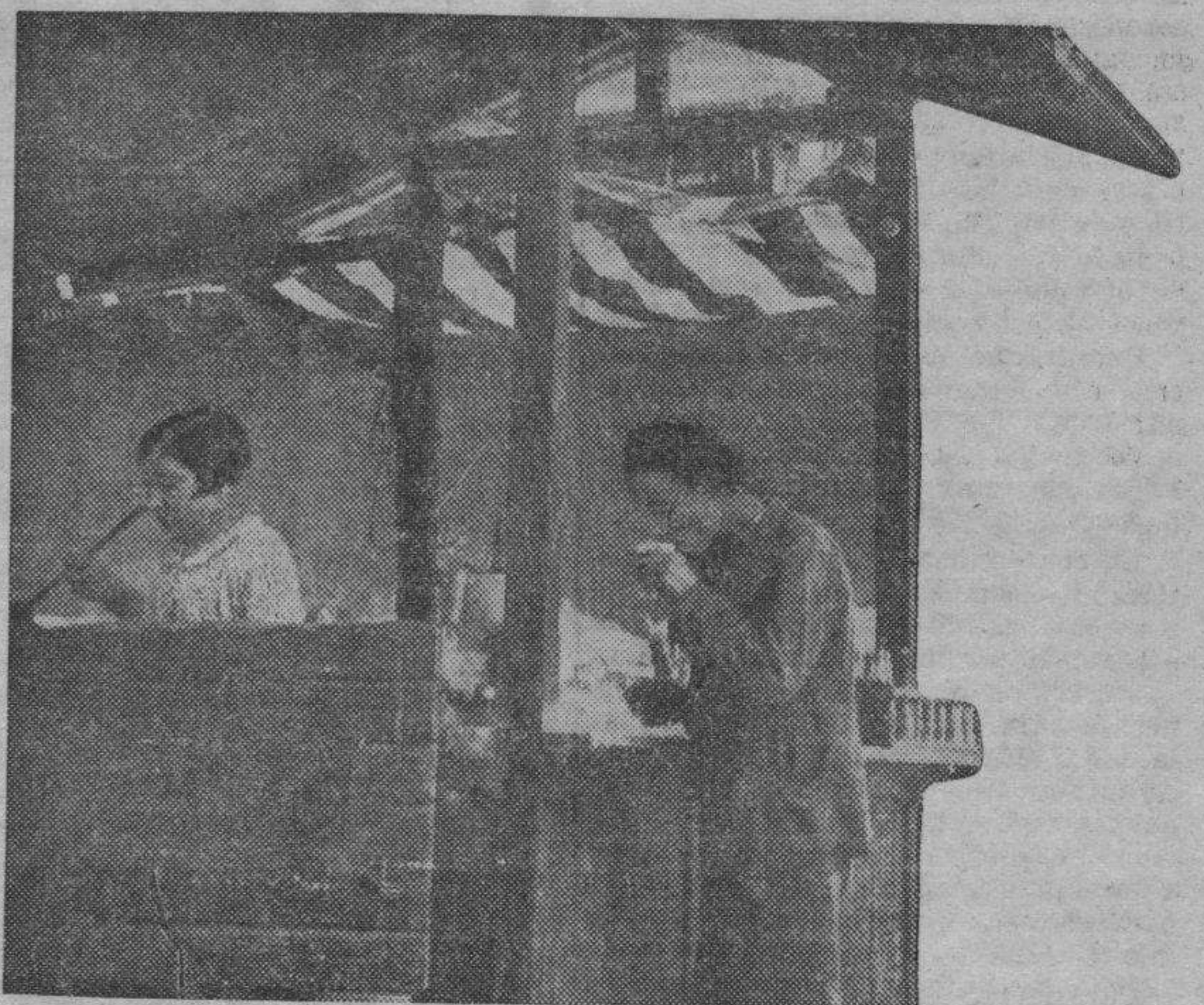
Escorzonera, buena, fresca y barata. Un vaso grande por una perra gorda. ¡Con qué fruición la absorbe, más que bebe, ese chaval que ha buscado la sombra acogedora de la garita.