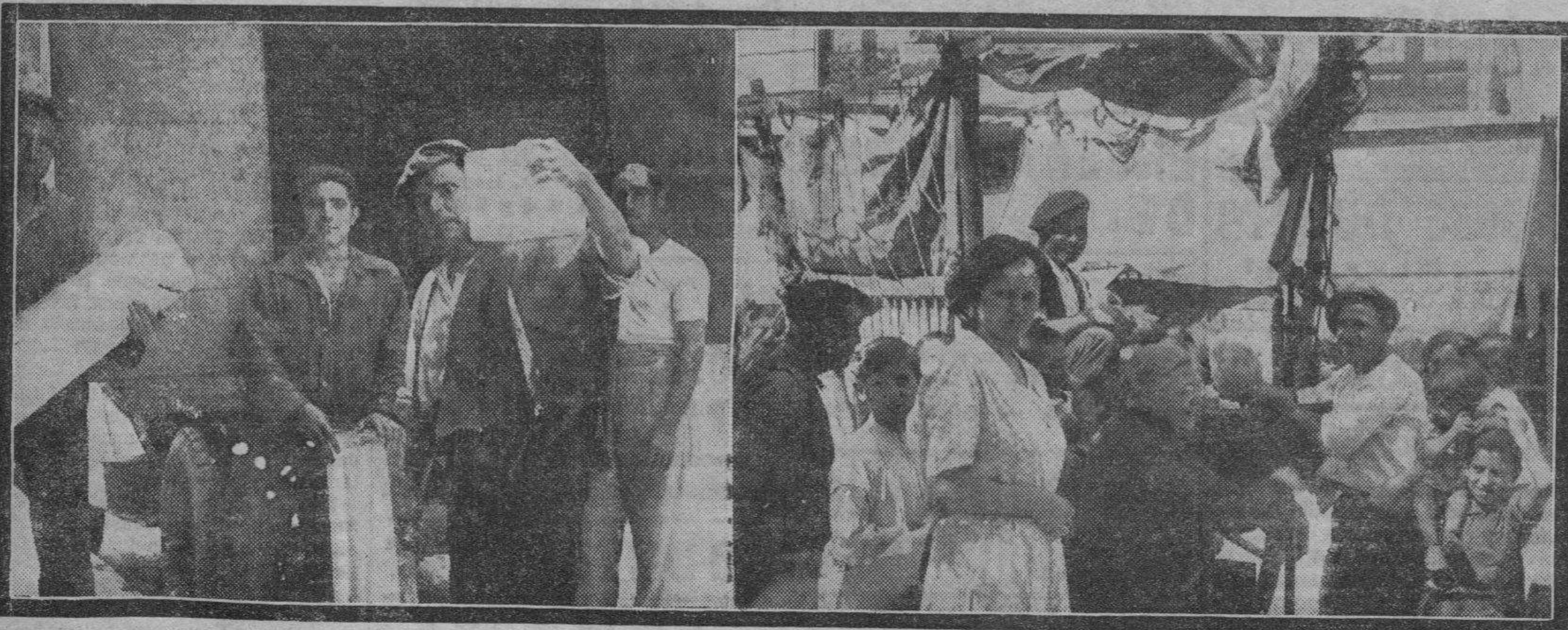
Pasar el verano entre barras de hielo debe dar gusto. Por eso, mientras la columna mercurial sube, envidiamos de todas veras al hombre del hielo.— ¡Melones, sandías!, manjar veraniego reconfortante que hace menos angustiosas las horas del calor.