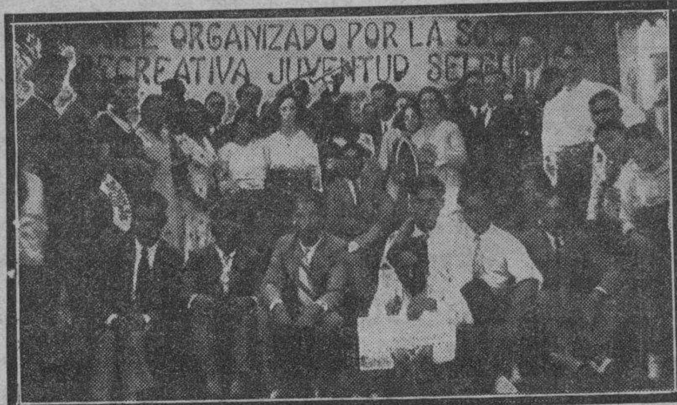
SARVISE.—Un grupo de concurrentes al baile celebrado con motivo de los festejos.