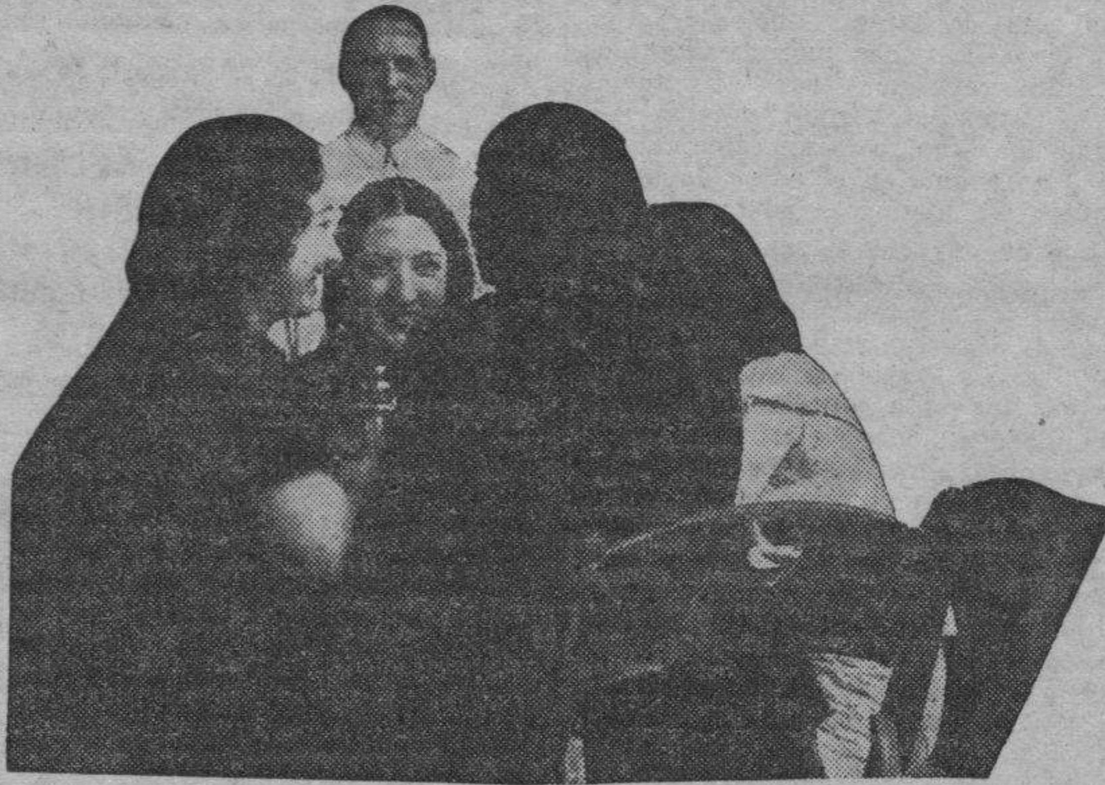
Cabe la acogedora sombra de unos porches, o adentradas en la umbría de un toldo cariñoso, estas bellísimas mujercitas desafían la caliginosa y derrengueante ola agosteña, mientras refrigeran la boca con horchata o cerveza heladas.

Febo guiña tras las moradas protuberancias, y al asomar su frente sin mancha, la romántica esbeltez de las agujas que prenden en su lanza el airón de una plegaria maña-