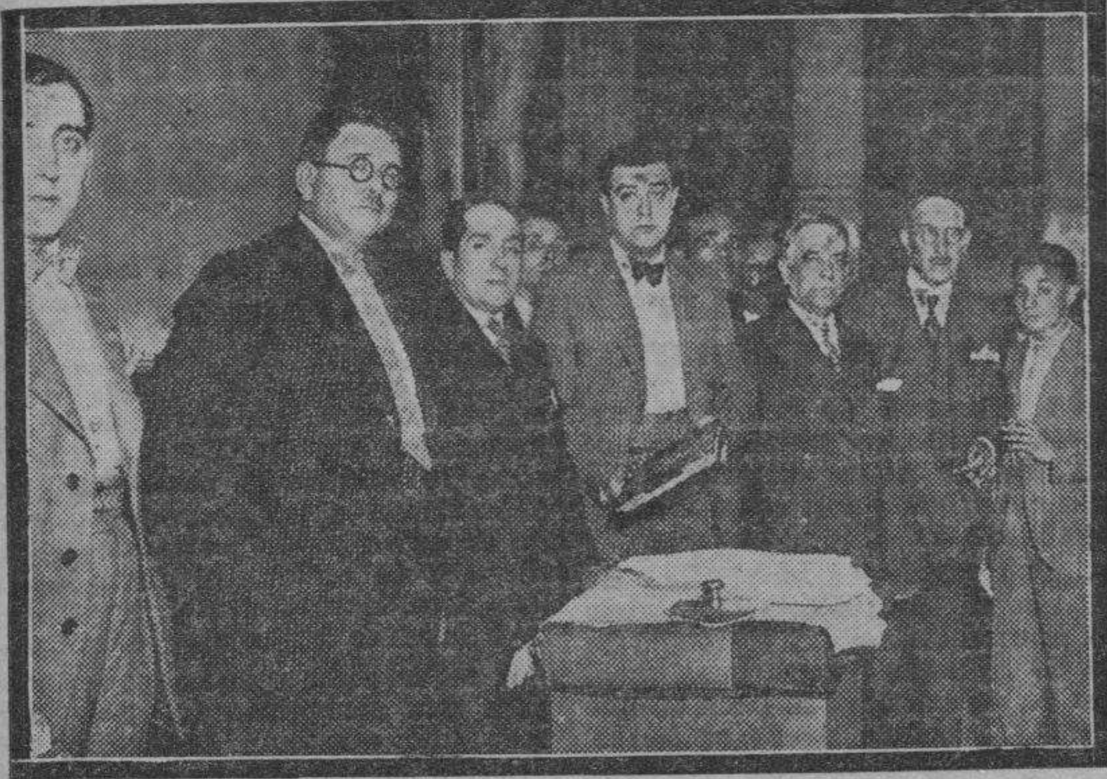
Presidencia del acto-homenaje a don Sebastián Banzo, tributado por los funcionarios municipales al último alcalde de la ciudad.

El pasado domingo, a las once, tuvo lugar en el Cinema Ena Victoria el homenaje que los obreros y empleados del Ayuntamiento dedicaron a don Sebastián Banzo Urrea, ex-alcalde de Zaragoza y diputado a Cortes.