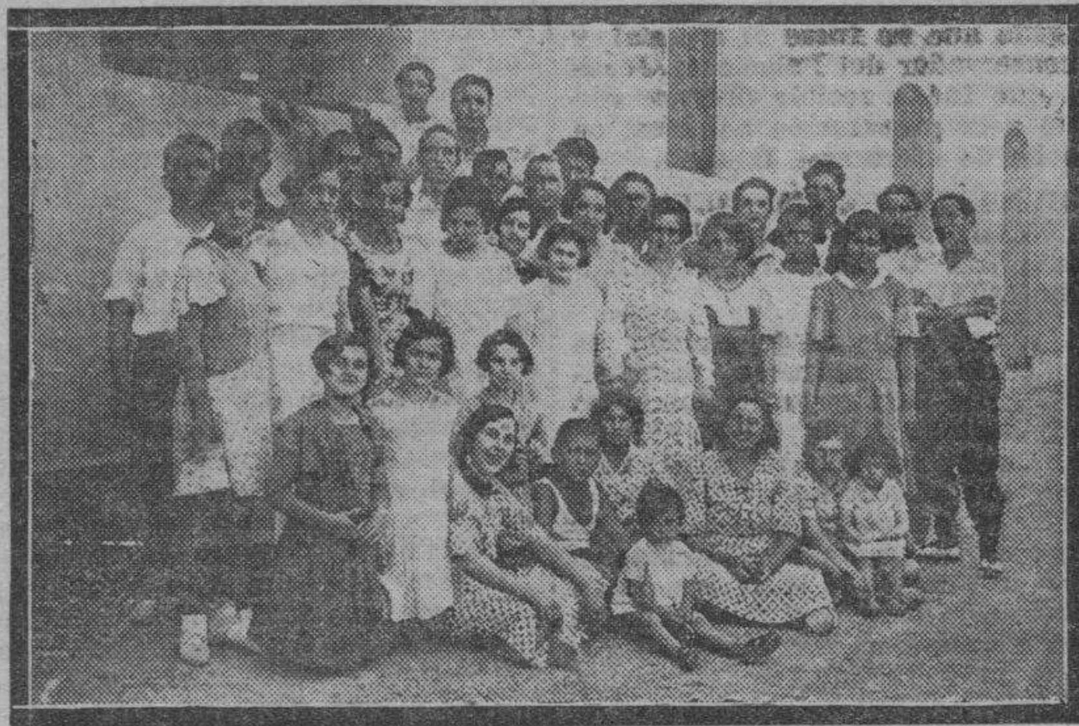
Un grupo de bellísimas chiquillas y bienhumorados jóvenes que han dado extraordinario realce a las populares fiestas celebradas en el populoso barrio de la Terraza.

Durante los días 20 y 21 del corriente ha celebrado este barrio sus fiestas anuales.