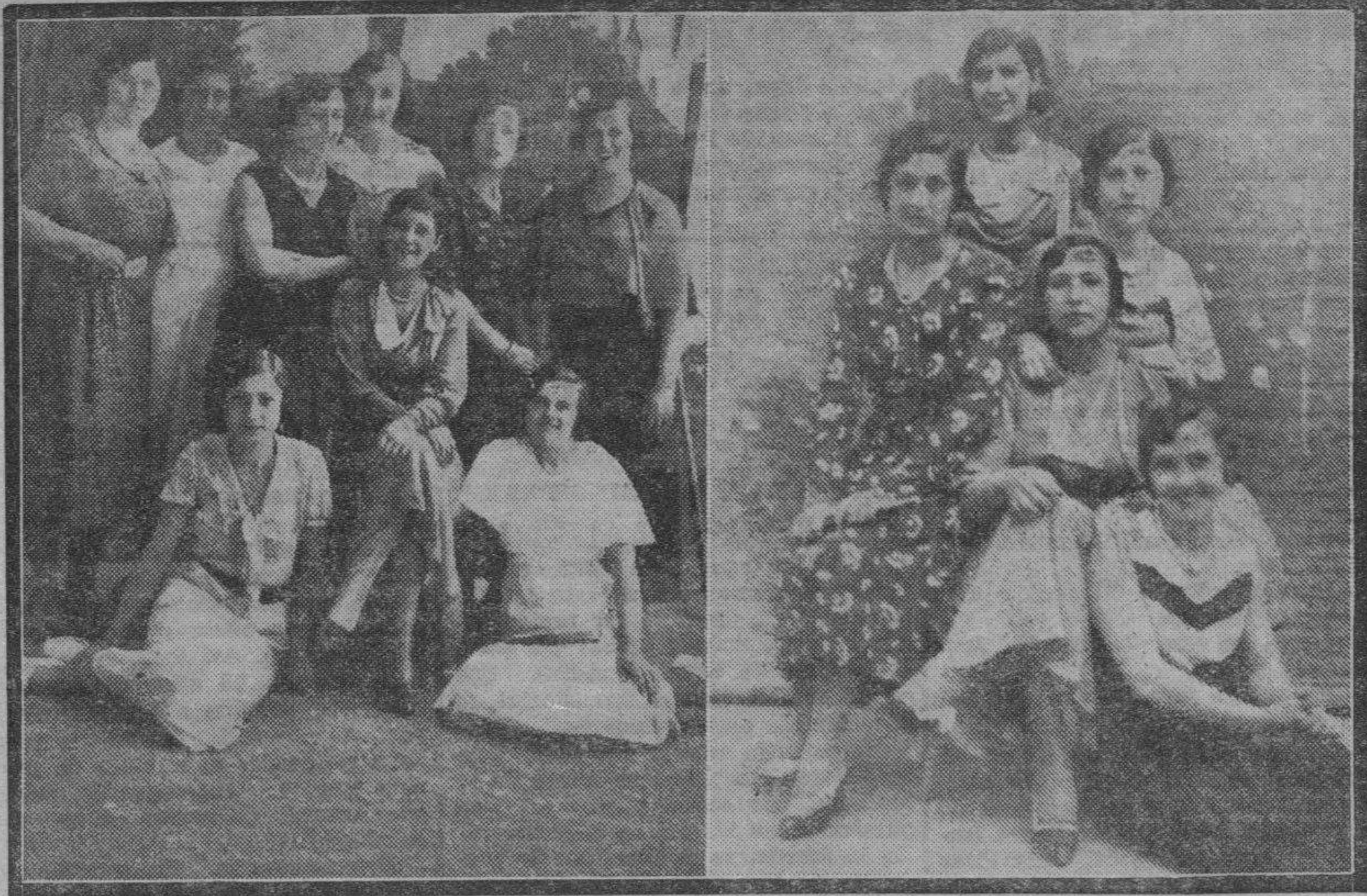
ALHAMA DE ARAGON. — Con gran solemnidad se han celebrado las tradicionales fiestas de San Roque, notándose gran afluencia de bañistas en los establecimientos termales de la localidad. Los festejos han tenido este año un atractivo encantador: El de las mujeres hermosas, agüistas y de la localidad, que han dado con su presencia la nota brillante de su risueña juventud a cuantos actos se han celebrado.

A partir del día 21 del mes corriente, por orden del ministro de Agricultura, Industria y Comercio, el maíz exótico que se declare para el consumo devengará por derecho de importación, cualesquiera que sea su procedencia y fecha