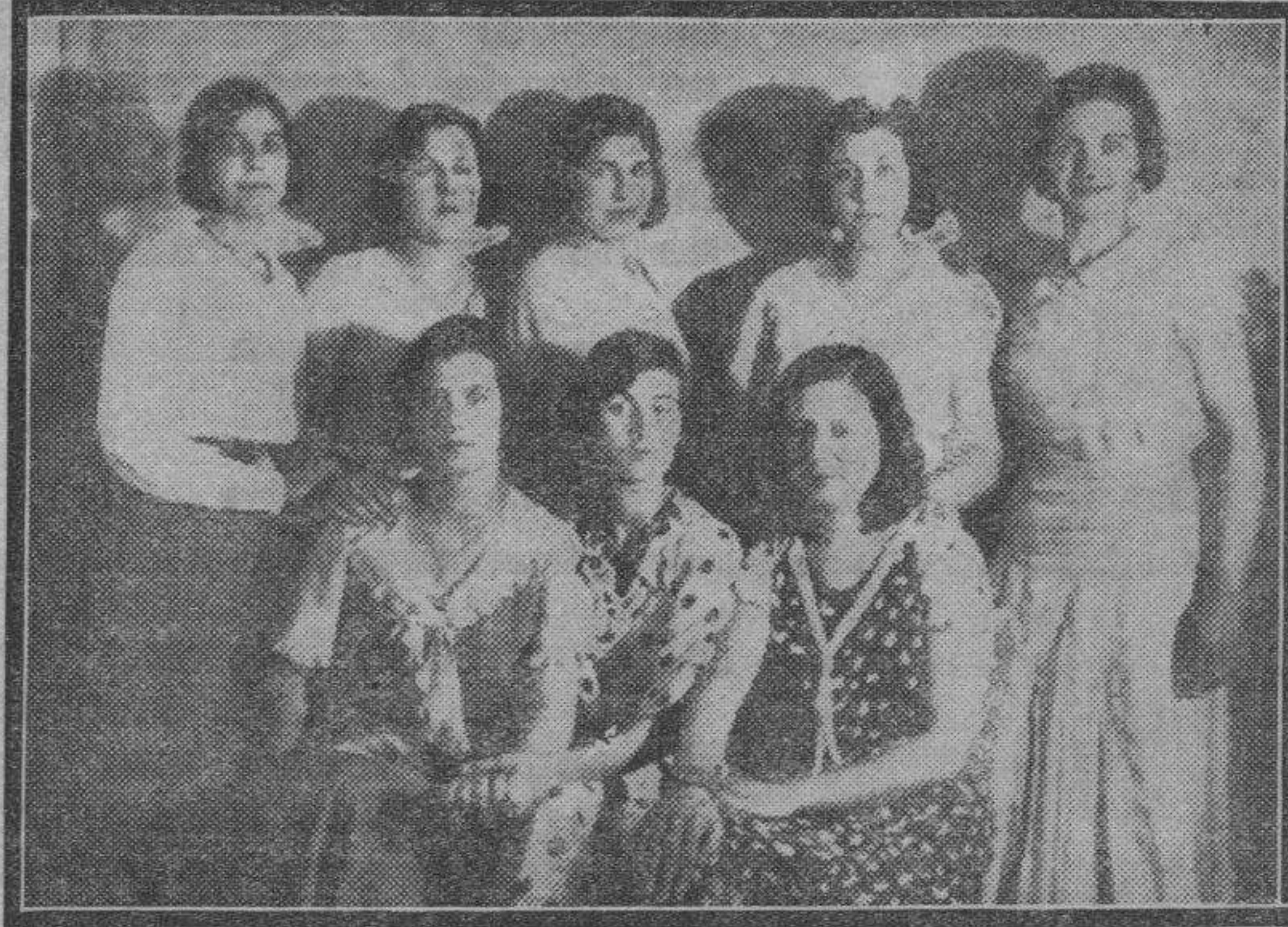
BELLVER DE CINCA. — Un grupo de preciosas chiquillas de la localidad que con su presencia y sana alegría han dado realce a las pasadas fiestas patronales, las que se han distinguido por su esplendor.

Detenido el agresor por la Guardia civil quedó a disposición del Juzgado municipal.