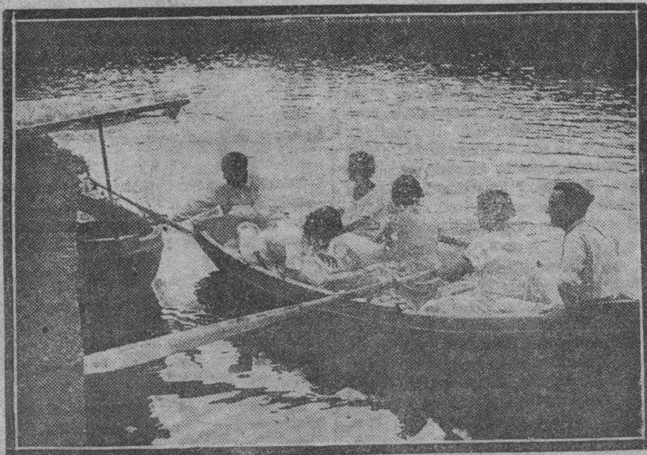
Las hijas del presidente de la República, paseando en lancha durante su veraneo en La Granja.