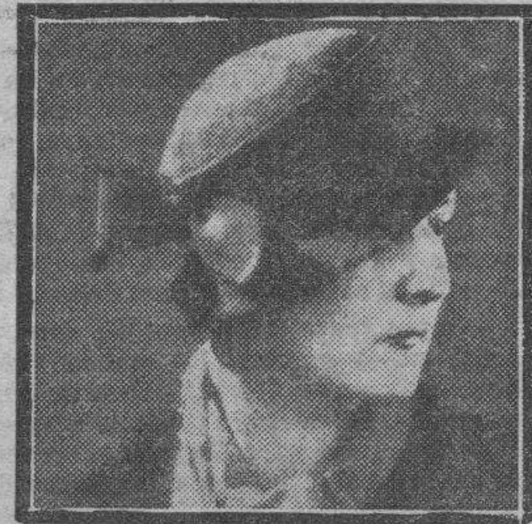
Tendrán una admirable adaptabilidad. Habrá para todo y para todas. Esto último es lo que los hará más amables. Porque la mujer, en su afán de descubrir bien su rostro si irra-