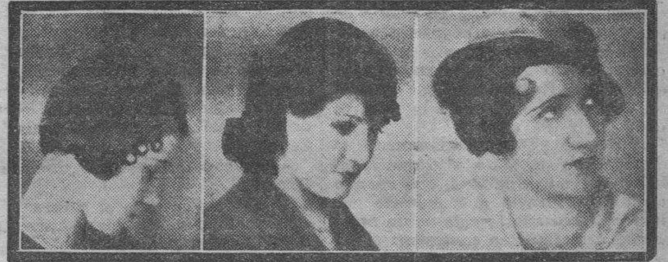
Resulta muy bizarro este gorrito de "taupe" negro adornado de un "cou-teau" rojo. Terciopelo verde botella se ha empleado en la confección de este elegante modelo. De "taupe" negro es esta original creación de líneas novedosas y tentadoras.