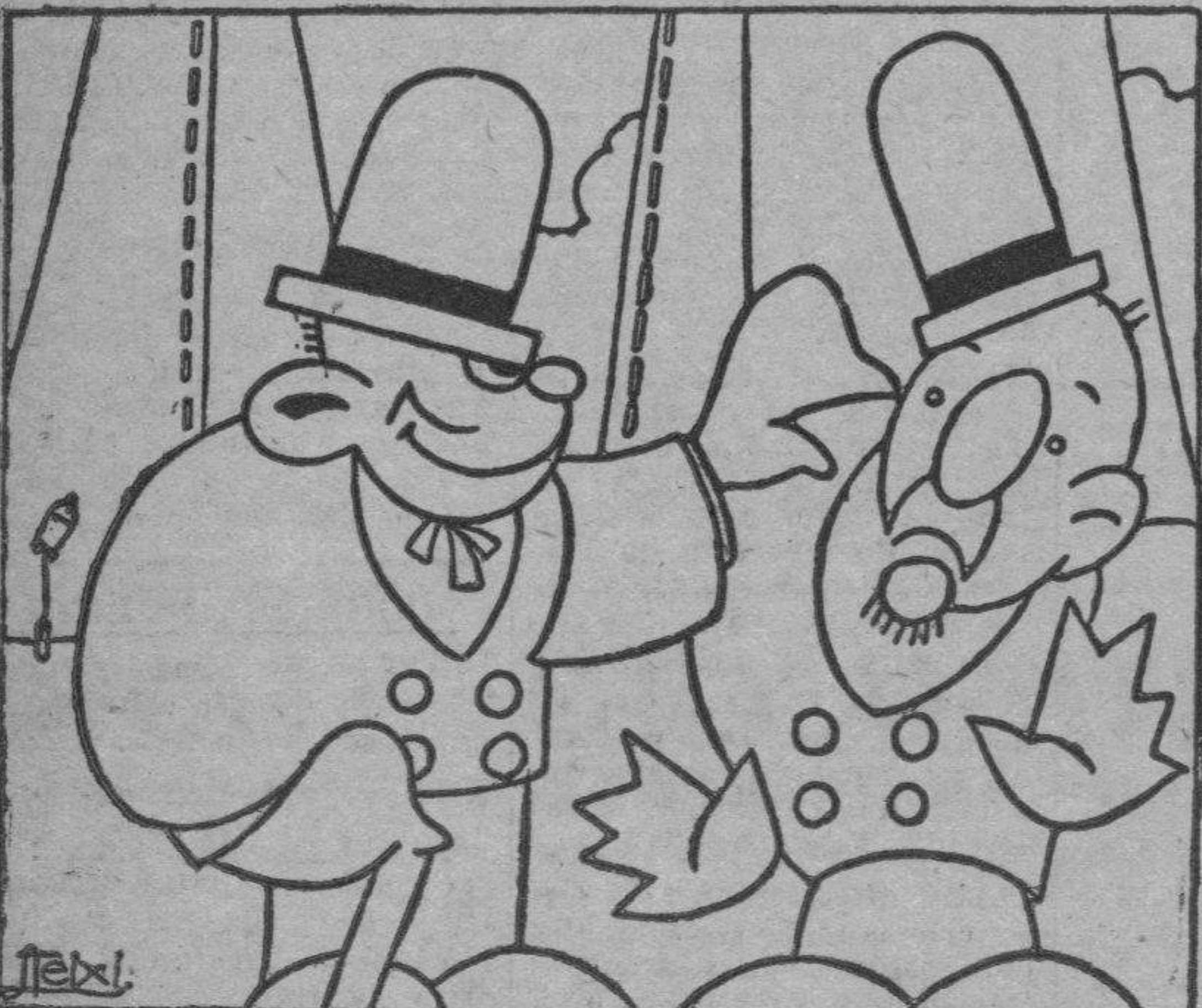
—¿Qué inocencial Pretender comprar una sortija en mi joyería... En las joyerías no vaya usted a buscar más que patatas, coles y tabaco.