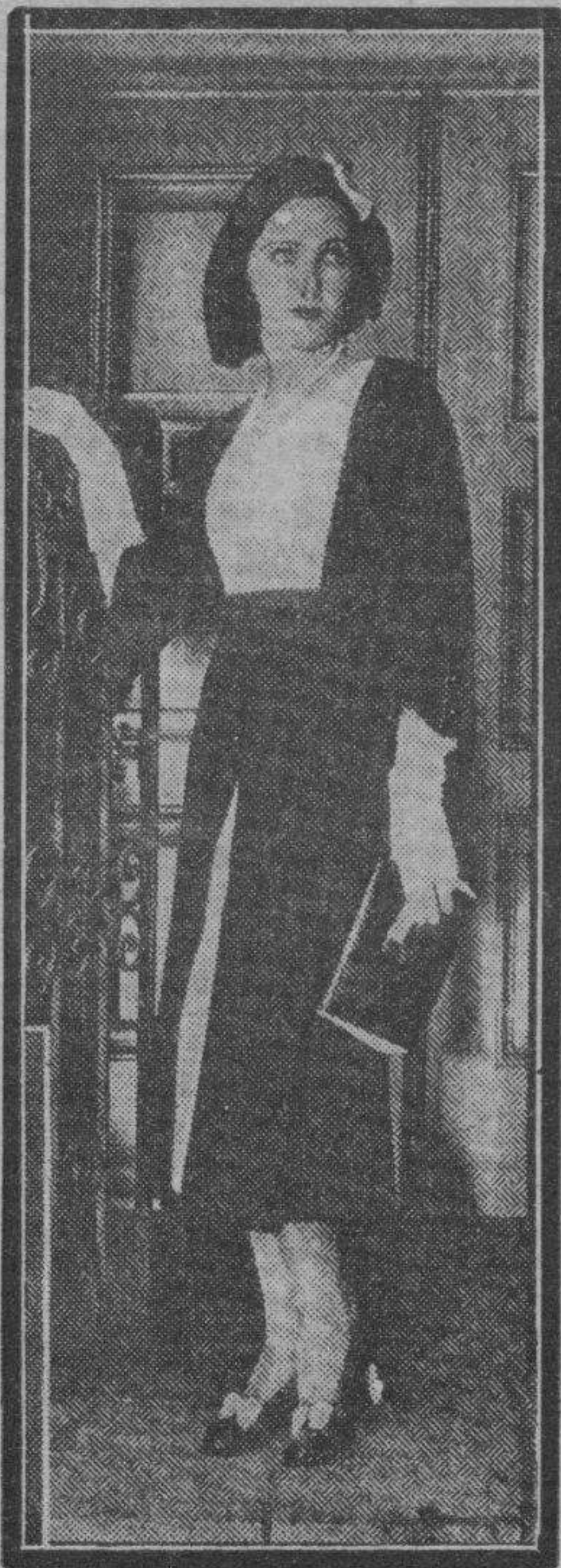
Fifi Dorsay luce en esta fotografía un elegante modelo de traje primaveral. Es de lana ligera, color fresa y adornado con lapin (conejo) color beige.