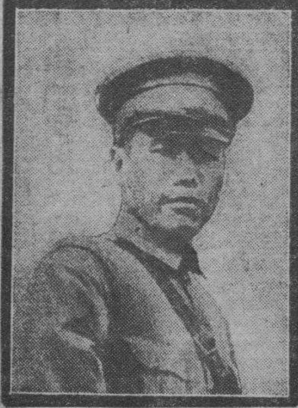
Ha sido nombrado Chiang Kai Shek presidente del Consejo militar con el mando supremo de los ejércitos de China.