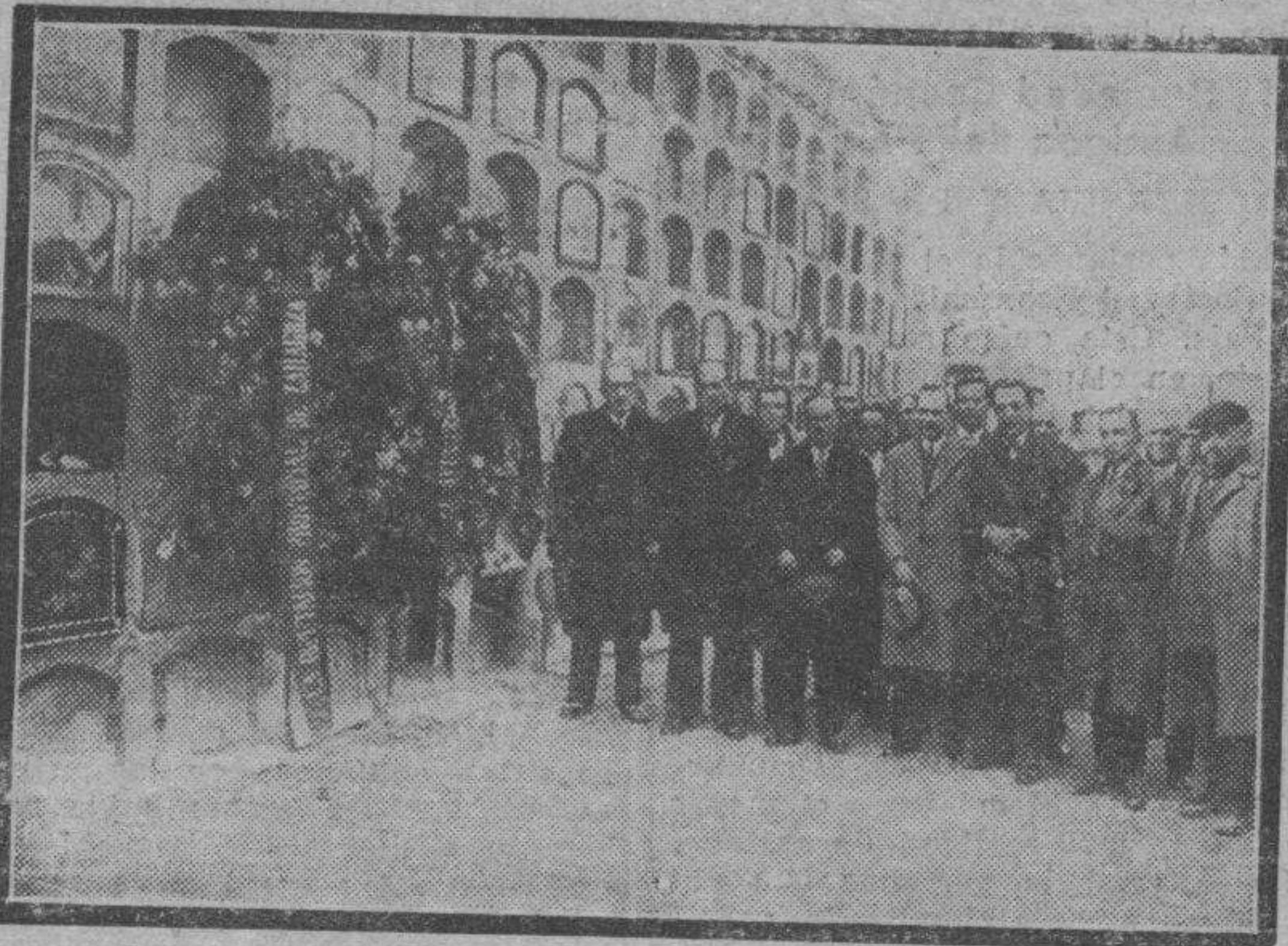
La representación del Ayuntamiento colocando una corona de flores en el nicho donde está enterrado don Marceliano Isábal. En el nicho figura la corona de flores que ha dedicado la Diputación en memoria del que fué gloria del Foro aragonés, al cumplir el primer aniversario de su muerte.