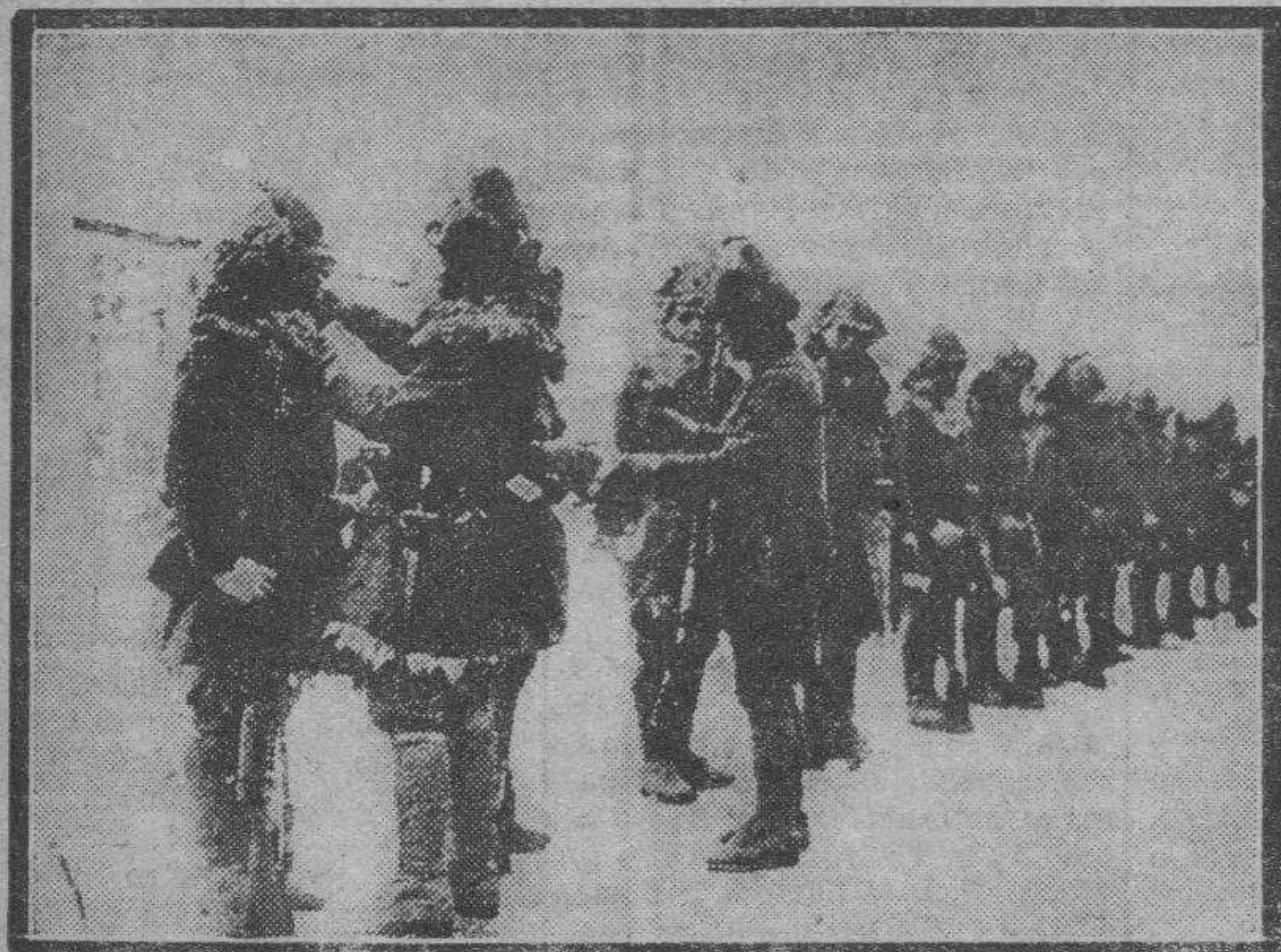
En la región manchuriana, cerca de Kharbin, los soldados japoneses inauguran un nuevo equipo de invierno, dando la sensación de una campaña guerrera más larga de lo que la S. de N. quisiera.